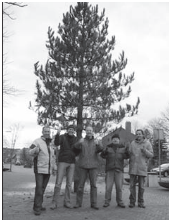
Het bestuur van de dorpsvereniging Bakkum heeft voor de derde keer een kerstboom opgetuigd.