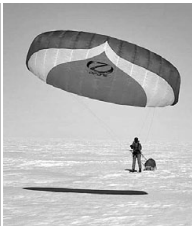
Met kites over Groenland