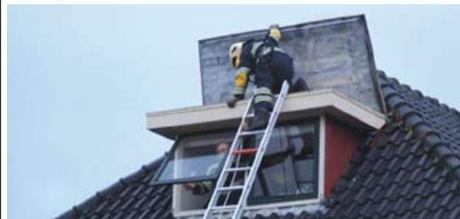
Zondagmiddag is de brandweer ruim een uur bezig geweest met het veiligstellen van een zinken dak dat op de Dorpsstraat van een woning dreigde te waaien.