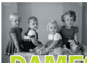
■ Vier kinderen op de foto met pluche hondje.