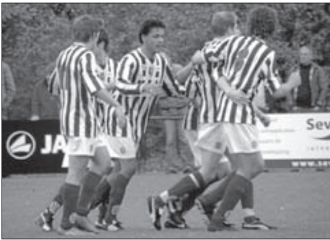
FC Castricum heeft gescoord tegen HBOK.