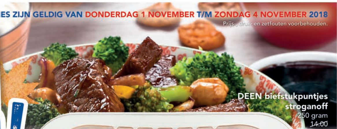
DEEN biefstukpuntjes stroganoff 250 gram 14.00

DEEN buitenlandse kaas kleinverpakking morbier, brie, St. Paulin, chevre naturel of gorgonzola per stuk