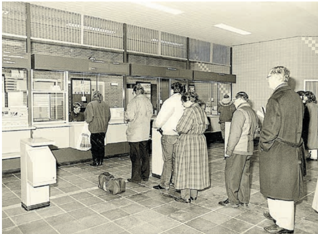
Velen zullen zich de rijen voor de loketten nog herinneren. In 1988 werden de loketten vervangen door een open balie