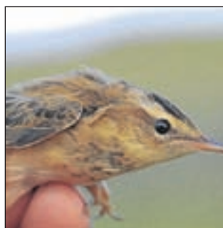
Cetti's zanger in de hand.

Voor alle vrouwen die interesse hebben in de unieke dertig minuten training houdt Fit4lady in Limmen een open inloopweek van 31 oktober tot en met 5 november. Fit4lady is te vinden op de De Drie Linden 3. Informatie of aanmelding: www.fit4lady.nl .