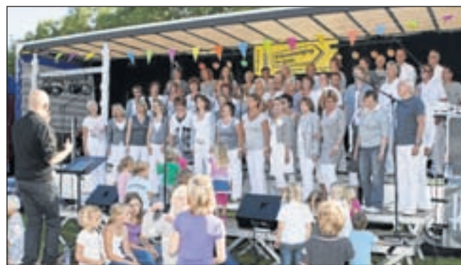
Een momentopname van het Popkoor SurpriSing tijdens het Midzomerfestival dit jaar.

Marian: "Een muziekcommissie gaat ieder seizoen opnieuw op zoek naar leuke nieuwe nummers. De meeste arrangementen komen uit Amerika. Ook voor het concert van 5 november zijn de meeste nummers nieuw. Wij hopen natuurlijk, dat alle 365 kaarten verkocht worden. Meer dan een kwart van de toegangsprijzen kunnen wij niet voor genoemd goed doel beschikbaar houden. Wij hebben natuurlijk onze kosten: voor de zaal waar wij oefe-