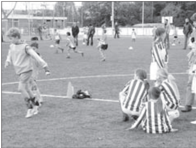
De E pupillen meisjes van FC Castricum waren ook aanwezig op het stratenvoetbaltoernooi.