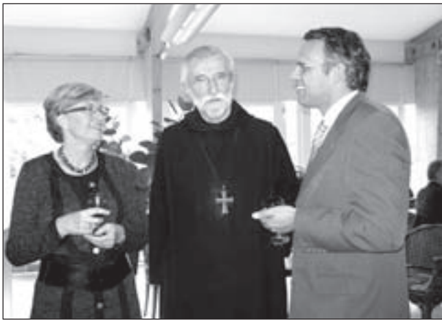
Foto-expositie in de Abdij van Egmond