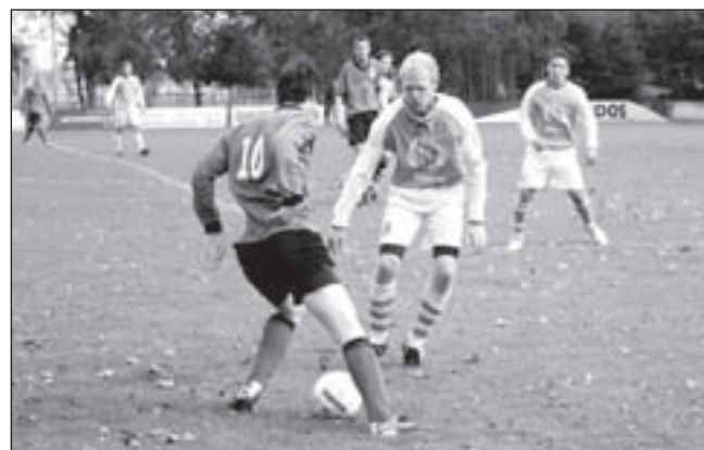
Aanval van Vitesse.

Zondag spelen de Ladies en de Colts op Wouterland; het Driede is op rugbypromotietour in Turkije.