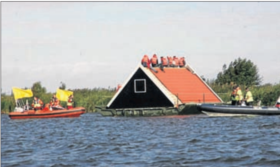
'Slachtoffers' van de overstroming werden met helikopters en vaartuigen gered.