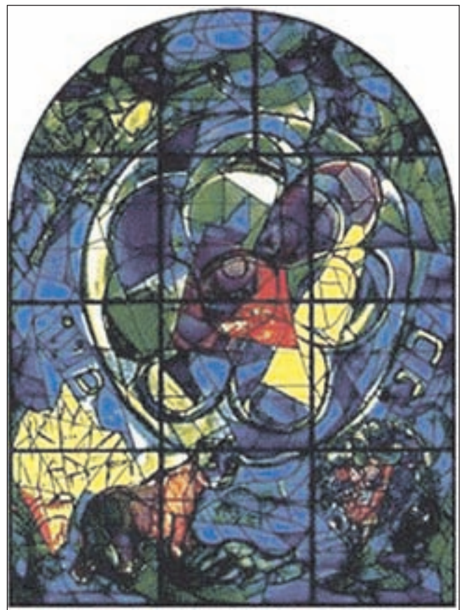
Raam Hadassah-ziekenhuis: Benjamin.

Wie interesse heeft in een van deze vacatures of ander werk wil doen kan langsgaan bij de Vrijwilligers Centrale, Geesterduinweg 5 in Castricum. De openingstijden zijn van maandag tot en met vrijdag van 9.00 tot 12.30 uur en 's middags op afspraak. Het telefoonnummer is 0251-656562. De centrale is ook te vinden op www.welzijncastricum.nl .