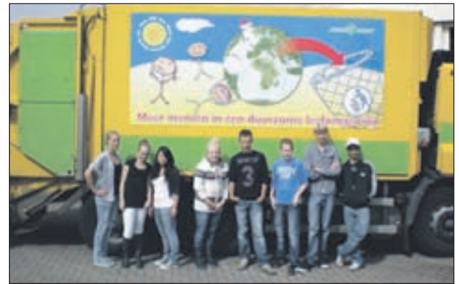
De ontwerpers voor een van de gedecoreerde wagens.

Castricum - Acht leerlingen van klas 3G3 van het Clusius College Castricum hebben in overleg met de burgemeester en de griffier van de gemeente Castricum een ontwerp gemaakt om een vuilniswagen op te vrolijken. Deze opdracht, die bij het vak Mens & Maatschappij is uitgevoerd, past in het Millenniumdoel 7, dat staat voor een schone omgeving. Dezelfde leerlingen hebben verleden schooljaar, toen ze in klas 2G3 zaten, een prijs gewonnen met hun idee een paar dagen in een Glazen huis in Castricum door te brengen voor een goed doel. Deze prijs wonnen ze in het kader van een project in samenwerking met de Gemeenteraad van Castricum. Na een heuse gemeenteraadsvergadering waarin de leerlingen ideeën konden verdedigen en beargumenteren, werd hun idee uitgeroepen tot best gebracht idee. De uitvoering van dit idee bleek echter niet haalbaar. Daarom hebben de leerlingen samen met