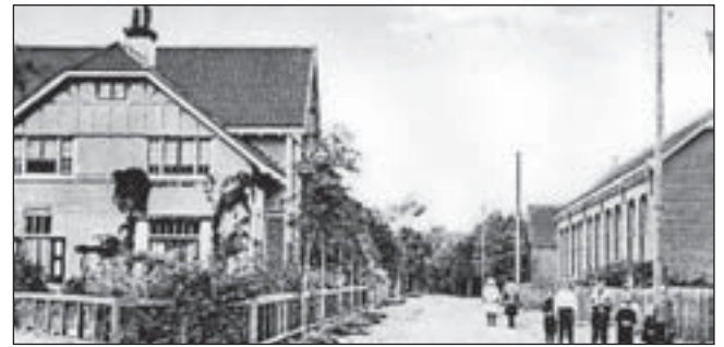
De Duinrandschool in Bakkum waar nu Perspectief gehuisvest is.

vers op de Oude Schulpweg 4 te Castricum, gelegen schuin tegenover de jachtopzienswoning Kijk-Uit, biedt een unieke blik op deze, verder verborgen, stille plek in het duin. De Stichting NatuurMedia die het jachthuis momenteel tijdelijk gebruikt, is die middag gastheer. Het net verschenen boek Duinen en mensen: Kennemerland van Rolf Roos is er verkrijgbaar en er is een gelegenheidsexpositie van de Bakkumse kunstschilder Dirck Nab die veel in de duinen van Bakkum en Egmond werkt. Het terrein achter Kennemerstraatweg 341 in Heiloo is een beoogde woningbouwlocatie. Op zaterdag 12 september nemen kunstenaars, archeologen en verhalenvertellers het publiek in deze open ruimte mee op reis in de tijd. De kleurrijke geschiedenis, verleden en heden van Zandzoom Zuiderloo komen voorbij aan de hand van foto's,