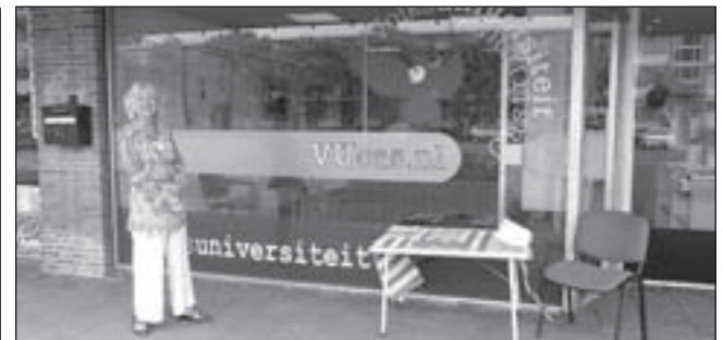
Coördinator Nanda Ranzijn voor het vernieuwde kantoor.

Op woensdagmiddag 16 september organiseren Gilde Castricum en de Bibliotheek Castricum van 14.15 tot 16.15 uur een themamiddag over het werken met dit fotobewerkingsprogramma. Belangstellenden kunnen zich hiervoor aanmelden bij Stichting Welzijn Castricum, tel. 656562. De kosten zijn 5,00 euro per persoon.