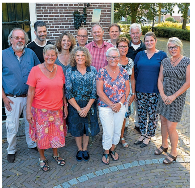
Het nieuwe bestuur van Limmen Cultuur

WWW.VERSPREIDNET.NL INFO@VERSPREIDNET.NL