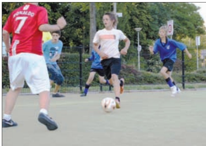
De eerste wedstrijden van het jongerenvoetbaltoernooi zijn al gespeeld; negen teams strijden om de titel.

Voor vragen of informatie kunt u contact opnemen met de sectie Communicatie: communicatie@castricum.nl