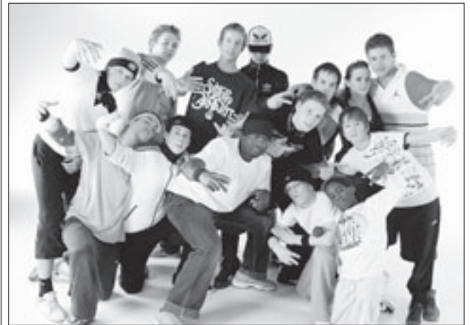
Meedoen aan Nederlandse kampioenschappen?

De F-pupillen, kinderen van 7 en 8 jaar trainen van 14.45 uur tot 15.45 uur. De oudere E en D pupillen jongens en meisjes van 9 jaar en ouder zijn welkom van 16.00 tot 17.00 uur. De meisjes vormen een aparte groep.