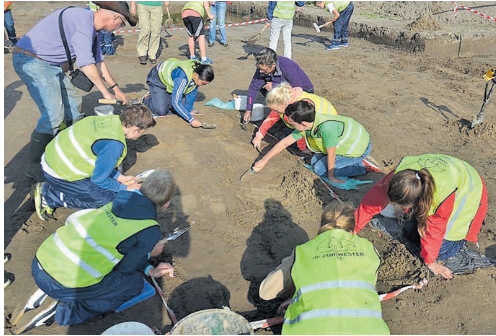
Schoolkinderen doen archeologisch onderzoek