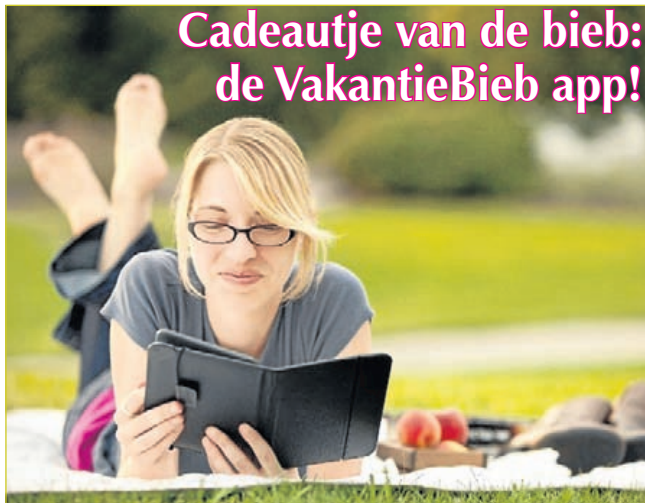
Cadeautje van de bieb: de VakantieBieb app!