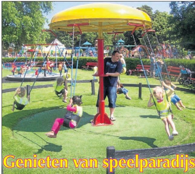
Genieten van speelparadijs

Uitgeester kinderen die niet in de gemeente zijn geboren, maar bijvoorbeeld in het ziekenhuis van Beverwijk of Alkmaar, worden niet vanzelf vermeld in de rubriek Burgerlijke stand. Ouders die zo'n publicatie toch op prijs stellen, kunnen contact opnemen met de publieksbalie in het gemeentehuis.