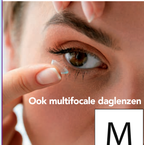
Ook multifocale daglenzen

... daglenzen voor een onbezorgde vakantie!