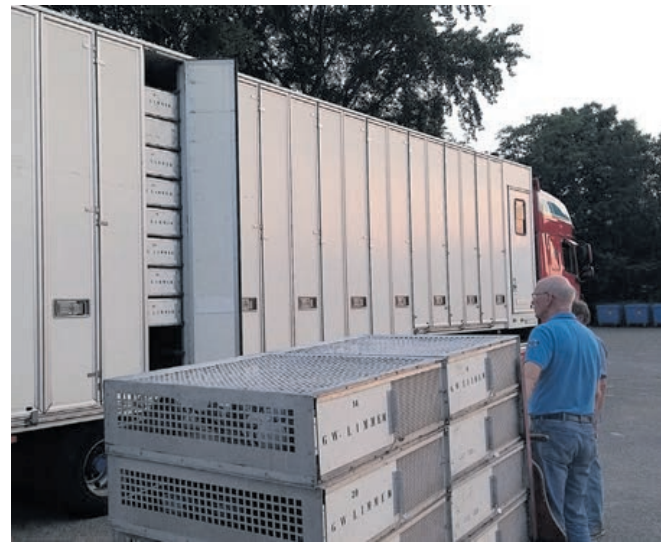
Het inladen van de duiven