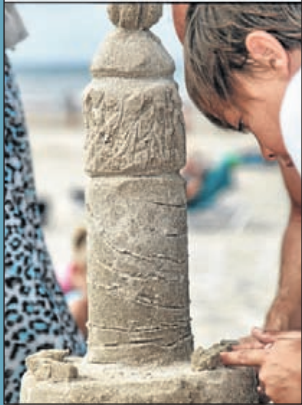
Zandsculpturen bouwen met Kunstgras aan Zee.

Castricum - Uit de Kunst in Castricum dient voor het tweede jaar als podium voor professionals en amateurs uit Castricum en de regio. Zij doet dat dit jaar voor het eerst vanuit de Stichting Uit de Kunst in Castricum. Van donderdag 4 tot en met 7 juli is Castricum de culturele hotspot. Op binnen- en buitenlocaties in het duingebied, aan het strand en in het dorp kan er dit jaar vier dagen lang worden genoten van tal van kunstuitingen. Er is muziek, kleinkunst, cabaret, dans, beeldende kunst, poëzievoordracht, verhalenvertelkunst en nog veel meer. Meer dan vorig jaar is het festival in 2013 erop gericht een brug te slaan tussen cultuur en de prachtige natuur in en om