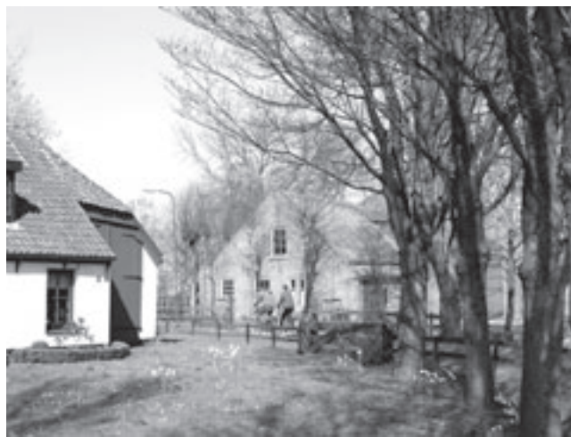
De Maer- of Korendijkroute gaat ook door de rustieke Breedeweg.

Nog in de ban van oranje tijdens een optreden met Emergo.