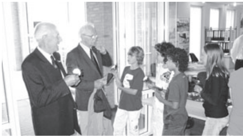
De veteranen werden bij het gemeentehuis verwelkomt door vijf leerlingen van de Montessorischool uit Castricum. Zij spelden de genodigden een anjer op.

De verlengde reactietermijn (per email) sluit op 25 juli 2008.