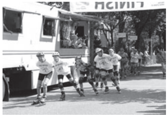
De skeelers in actie tijdens de Ronde van 2007

Tieners vanaf 12 jaar kunnen onder begeleiding verantwoord fitnessen, zo heeft onderzoek aangetoond. Ray: "Wij waken er voor dat ze in hun enthousiasme niet meteen teveel willen. Het is ook niet nodig om tot het uiterste te gaan. Met een normale inzet kun je al heel veel bereiken. Tieners tussen de 16 en 18 jaar kunnen al wat zwaarder trainen. Het allerbelangrijkste is dat de techniek op een goede wijze wordt aangeleerd en daar zijn we bij SportPlan Uitgeest in gespecialiseerd!" Tieners die na een zomer lang fitnessen door willen gaan, kunnen uiteraard lid worden. SportPlan Uitgeest biedt een uitgebreid pakket aan sportieve mogelijkheden voor jong én oud. "Plezier in bewegen op een verantwoorde manier, dat staat bij ons altijd voorop", besluit Ray. SportPlan Uitgeest is gevestigd op de Populierenlaan 45a in Uitgeest, tel.: 0251-311231.