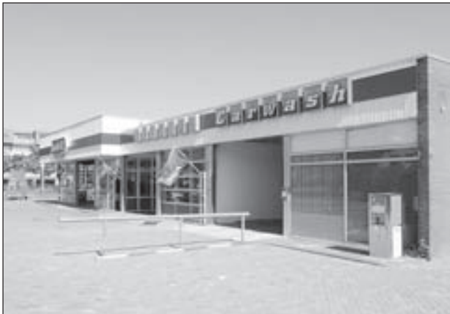
Het nieuwe bedrijf Indoor Carwash Castricum bevindt zich rechts van Kwik-Fit aan de Soomerwegh 1a.

Castricum - Je eigen auto wassen voor de deur lijkt wel niet meer 'in' te zijn. Steeds meer mensen laten hun auto wassen. Het scheelt tijd en bovendien is het voor het behoud van de lak beter. Indoor Carwash Castricum naast Kwik-Fit aan de Soomerwegh 1a is een nieuw bedrijf, dat voorzichtig startte op 3 februari. Vanaf heden draait het bedrijf op volle toeren.