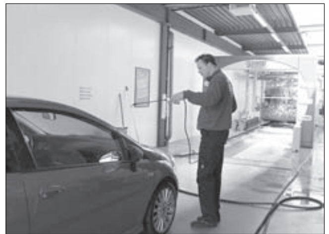
De extra service van Indoor Carwash Castricum: het verwijderen van hardnekkige vlekken.

men heeft een eigen waterbron gegraven. Per wasbeurt wordt er 300 liter water gebruikt. Maar Indoor Carwash gebruikt geen leidingwater, maar bronwater, wat zelfs na de wassing wordt gerecycled. Er wordt met kalkvrij water gewassen, zodat er geen witte vlekken op de auto achter blijven. Er zijn vier programma's: 1) Standaard (wassen en drogen); 2) Wax (wassen, drogen en wax); 3) Polish (wassen, drogen, bodemreiniging en polish wax) en tenslotte de superbehandeling Super Bubble Polish (de poetsbeurt in de wasstraat). Bij alle programma's worden de velgen gereinigd. Met een speciale waspas met prijzen vanaf 50 euro krijgt men een bonuskorting. Voor verdere informatie zie de website: www.indoorcarwash.nl . (Marga Wiersma)