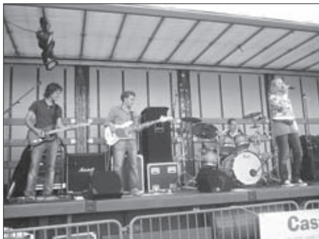
Mindfield in actie op het podium tijdens Akerpop 2007.