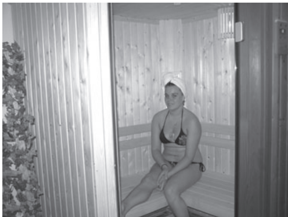
Je voelt je optimaal na twintig à dertig minuten in de infrarood cabine te hebben doorgebracht.

Tot 1 juni 2008 GRATIS gebruik van de sauna