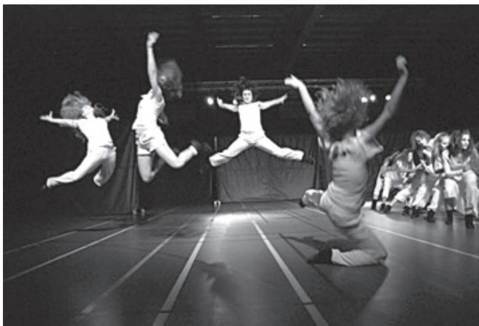
Vuurwerk van de showgroep op het nummer Firestarter van Prodigy

Een groep van 5/6-jarigen had er zelfs een liedje bij ingestudeerd, gecombineerd met een dans. Aan aparte bewegingen die je niet bij dans zou verwachten ontbrak het ook niet, de meiden dansten bijvoorbeeld als poppen/marionetten op de muziek. Volgend seizoen zal zeker ook weer getraind worden voor een demonstratie tijdens de onderlinge wedstrijden.