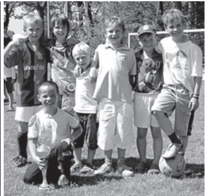
Stralende gezichten na afloop van het WEA Pinkstertoernooi. De jongste jeugd is dolgelukkig met de gewonnen bokaal.