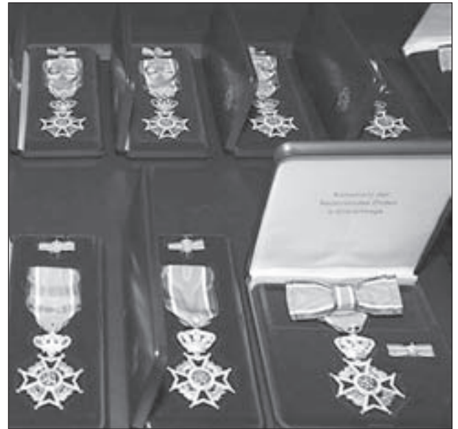
De lintjes liggen klaar, inmiddels zijn ze uitgereikt.

De heer Van den Berg (81) uit Akersloot heeft zijn maatschappelijke verdiensten vooral behaald op het gebied van de krijgsmacht en de geschiedschrijving hierover. Heel uitzonderlijk was zijn benoeming tot Luitenant Kolonel. Dat gebeurt niet iedere dag bij een reserve-officier. In 1987 volgde een eervol ontslag. Hij publiceerde 'Lo-