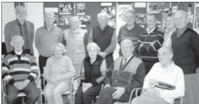
De verhalengroep in het gebouw van Stichting Werkgroep Oud-Castricum.

Castricum - Ook dit jaar verzorgt Radio Castricum 105 op 4 mei weer een uitzending rond-