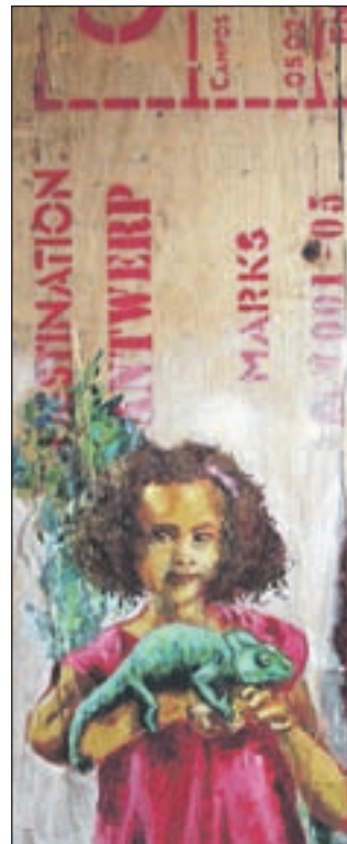
Een werkstuk van Hans Goedhart.

Op zondag 10 mei luistert de muziek- en theatergroep De Scric der Zee de tentoonstelling op met volksmuziek om 13.00 uur, 14.30 uur en 16.00 uur. Dit gezelschap brengt op theaterale en humoristische wijze volksmuziek, zang en dans uit de rijke historie van de Lage Landen in