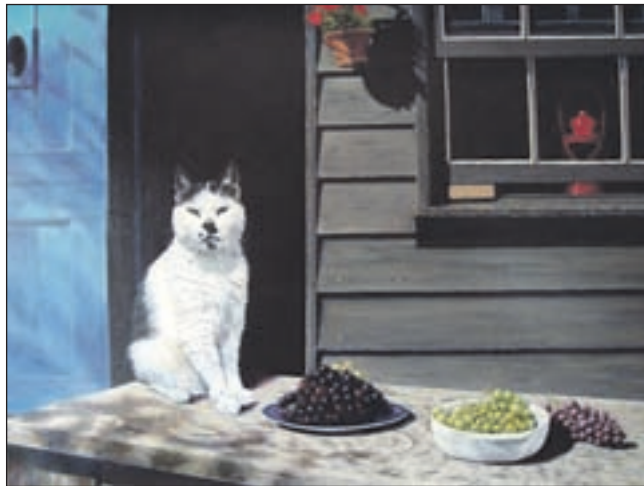
Een schilderij van Tinie Hanck, te zien in De Werkplaats.

Atelier Dorine van Rij, Pagenlaan 33 toont schilderijen, zowel abstract als figuratief. Soms gebruikt Dorine collagetechnieken. In Atelier De Werkplaats, Pagen-