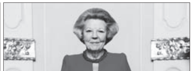
Koningin Beatrix.

De uitzending kan men volgen via 105.0 FM in de ether en via de kabel op 104.5 FM in Bakum en Castricum en op 89.0 FM (in Akersloot, Limmen en op De Woude).