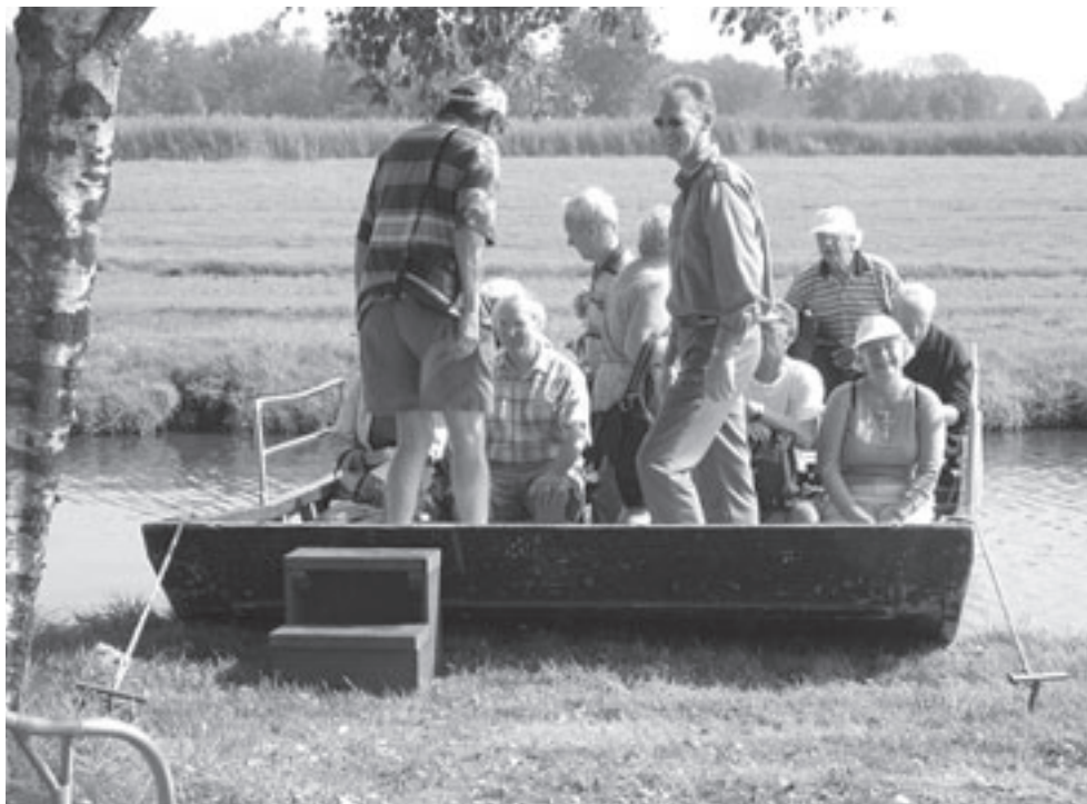
Excursieboot in Eilandspolder door Johan Stuart.

Meer informatie en routebeschrijvingen is te vinden op www.landschapnoordholland.nl . Alle buitenactiviteiten in Noord-Holland staan op www.natuurwegwijzer.nl .