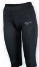
RUNNING LONG TIGHT DAMES €29,95

GOLFHANDSCHOEN ONE SIZE FITS ALL VOOR HEREN EN DAMES RECHTS EN LINKSHANDIG €17,95