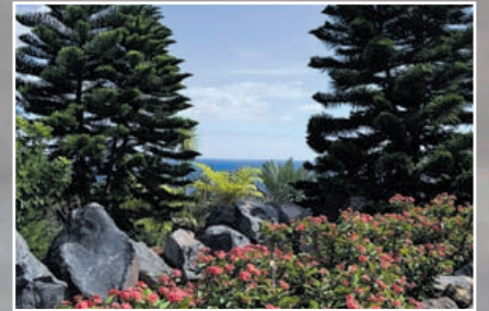
HOF VAN EDEN in de Atlantische Oceaan