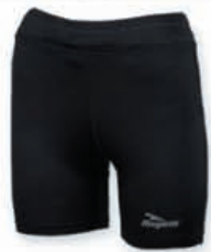
RUNNING TIGHT HEREN €24,95