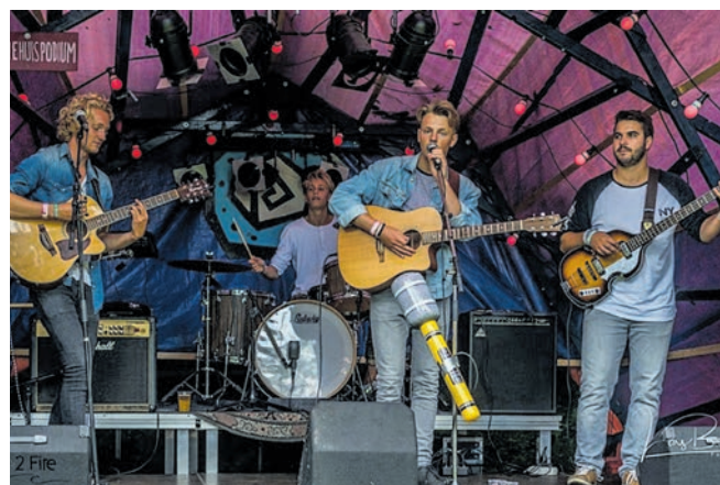
Close 2 Fire op het Uit Je Bak Festival 2017

25 april, zaal de Nollen Geesterhage, inloop 19.30 uur, start 20.00 uur.