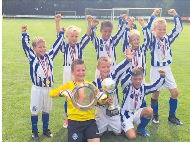
FC Castricum JO9-1

een defilé waar alle 32 clubs aan deelnemen. Om 10.00 uur starten de eerste poulewedstrijden. De finale staat gepland om 16.00 uur.