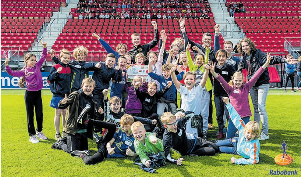
De leerlingen van basisschool Cunera maakten de beste vlog