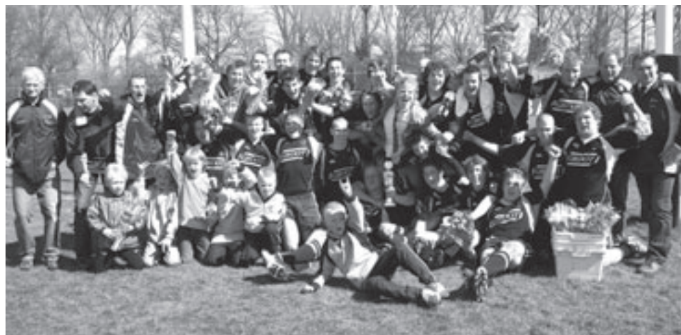
Colts Cas RC zijn dolgelukkig met hun landskampioenschap

Al met al een zeer geslaagd kampioenschap. Voor meer informatie over Trampoline springen bij DOS kunt u kijken op de websi-