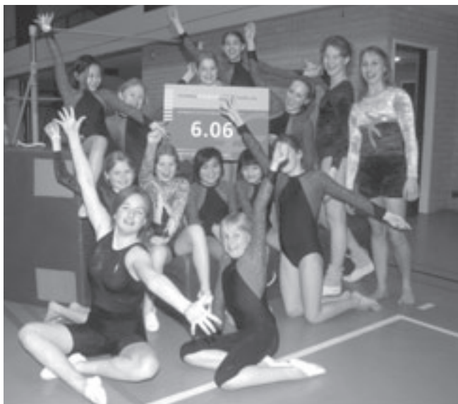
TIOS is uiteraard erg blij met de flinke donatie

Limmen - Donderdag 3 april werd de jubilerende sportvereniging TIOS blij verrast door een flinke donatie van het Schipholfonds. Elk kwartaal schenkt Amsterdam Airport Schiphol een bedrag aan verenigingen en stichtingen uit de omgeving. TIOS heeft Schiphol aangeschreven voor een donatie om materialen voor de jazz- en turnafdeling te kunnen kopen, en wachtte met spanning af.