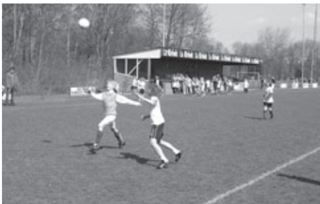
Klimop 1 werd voor de tweede keer winnaar