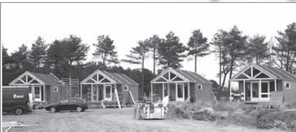
Ook in de recreatieve sector werkt Teerenstra aan comfortabel wonen. Deze strandhuisjes zijn recent opgeleverd op Camping Bakkum.