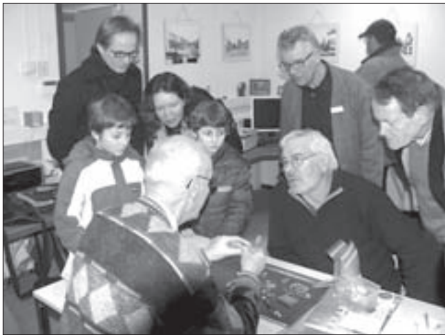
Bezoekers van de open dag in maart tonen veel belangstelling voor het determineren van de gevonden voorwerpen.