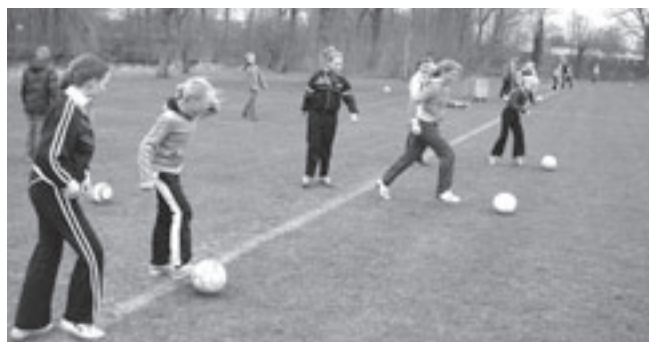
Volop strijd tijdens de meiden voetbaltraining afgelopen vrijdag.

Een enigszins teleurstellend resultaat dus voor de Castricummers, die misschien wel met een beetje meer geluk een puntje aan deze ontmoeting hadden kunnen overhouden.