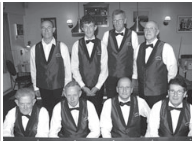
Het driebandenteam en het libre-team gezamenlijk op de foto. (Foto: Giel de Reus).