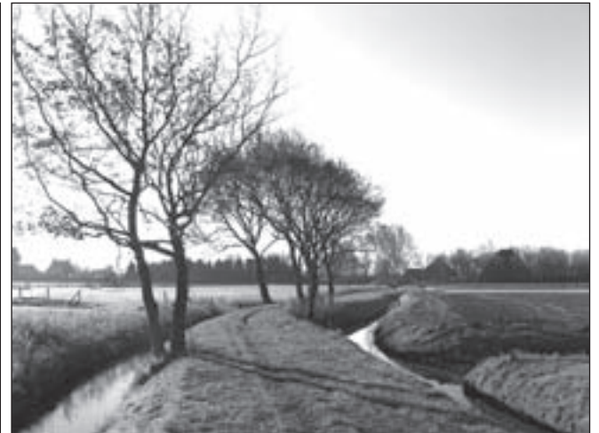
Grasdijk bij Akersloot