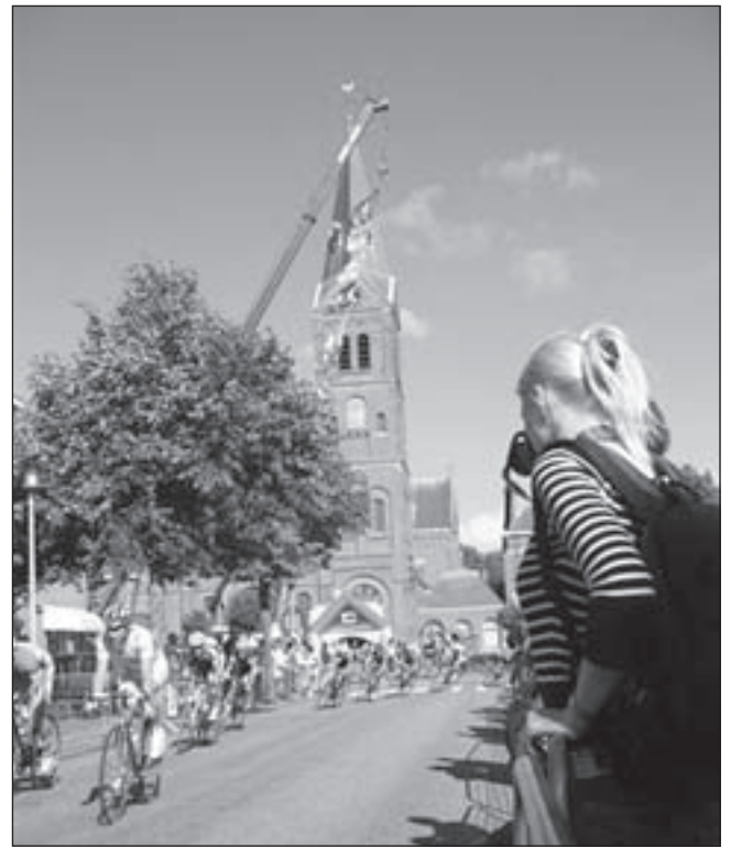
De Ronde van Limmen zoals die graag gezien wordt!