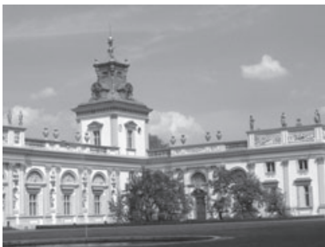
De Lakenhal in Krakau

traditionele Unicef-sponsorloop rondom de school. De kinderen van de onderbouw lopen 20 minuten lang rondjes, van de middenbouw 25 minuten en van de bovenbouw 30 minuten. Na de sponsorloop worden spannende en leuke activiteiten in en rond de school georganiseerd. Verder zijn er allerhande producten te koop en wordt een boekenmarkt georganiseerd. Het adres is Koekeksbloem 55.