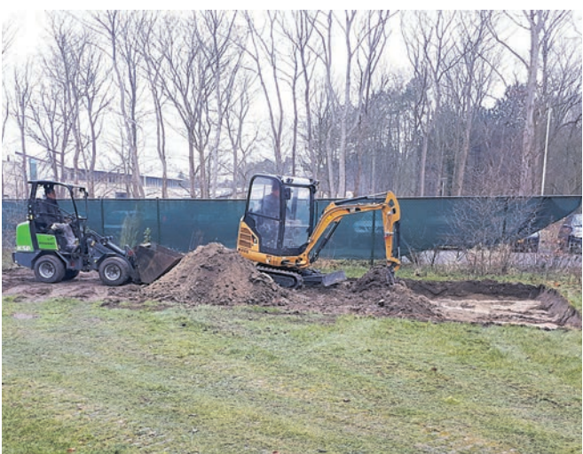
Op 19 februari ging de eerste 'schip' de grond in voor het realiseren van de beweegtuin en maandag, drie weken later, is de opening.