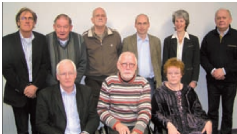
De leden van de WMO-raad.

Voor vragen of informatie kunt u contact opnemen met de sectie Communicatie: communicatie@castricum.nl