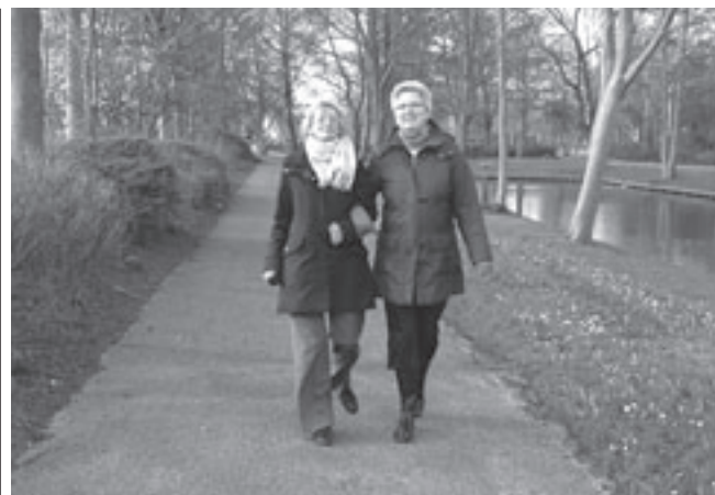
Samen aan de wandel, een van de mogelijkheden van 'Samen uit of thuis'