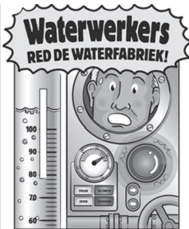
EEN ACTIEVE TENTOONSTELLING OVER DE WERELD VAN HET WATER.