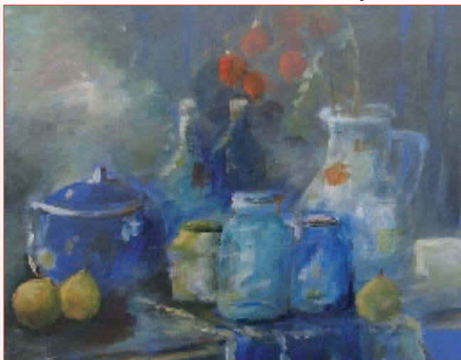
Een stilleven van Diny Dijkman-Mulder, acryl op papier, is een van de vele werken die geveild wordt voor het goede doel.

Castricum - Stichting WOL organiseert op zondagmiddag 1 februari in samenwerking met Rotary Castricum een kunstveiling in restaurant Blinksers op het strandplateau in Bakkum.