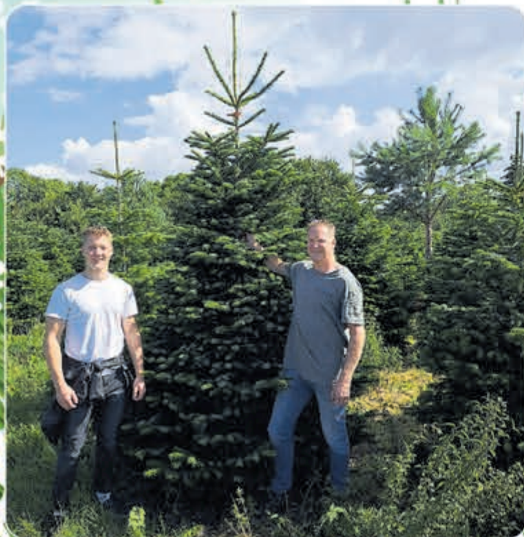
Het team van Bobs Kerstbomen eerder dit jaar bij de kweker in Denemarken.

Wil je er zeker van zijn dat je boom recht en stevig staat en blijft staan? Schaf dan gelijk de handige EasyFix-standaard aan. Deze is bij Bobs Bomen te verkrijgen in verschillende kleuren en maten.