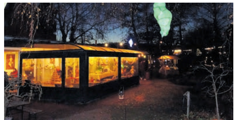
Sfeerbeeld van de vorige editie van het Lichtjespad.