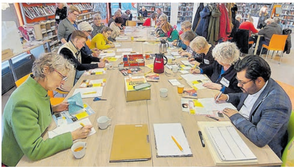
Ook vorig jaar schreven deelnemers samen brieven om de mensenrechtensituatie van bepaalde personen te verbeteren.

De gemeente organiseert deze cursus samen met ProDemos, Huis voor democratie en rechtstaat. Wie meer over de cursus wil weten of zich wil aanmelden kan mailen naar de raadsgriffie via raadsgriffie@castricum.nl of bellen naar 088 9097094.