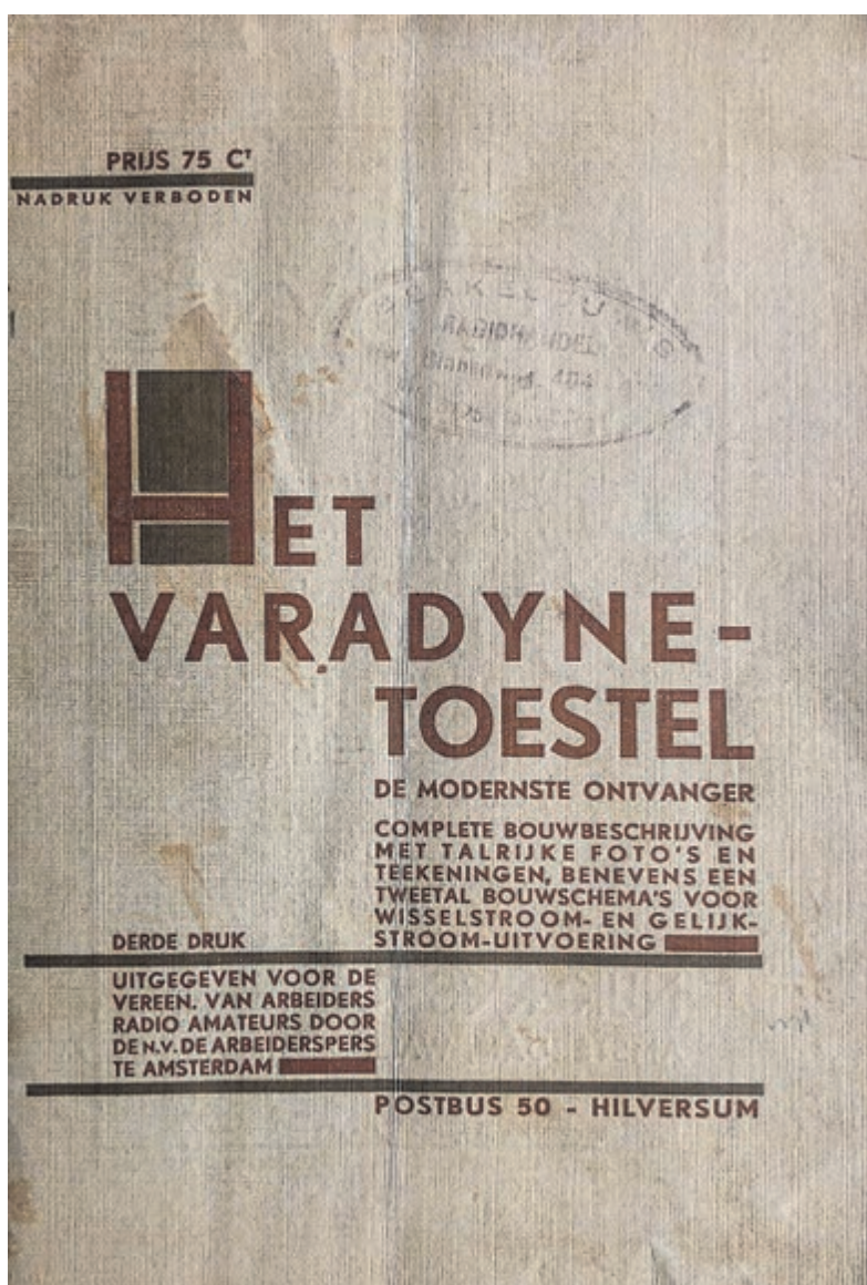
Het boekje uit de dertiger jaren waarin wordt uitgelegd hoe je zelf een radio kunt bouwen.