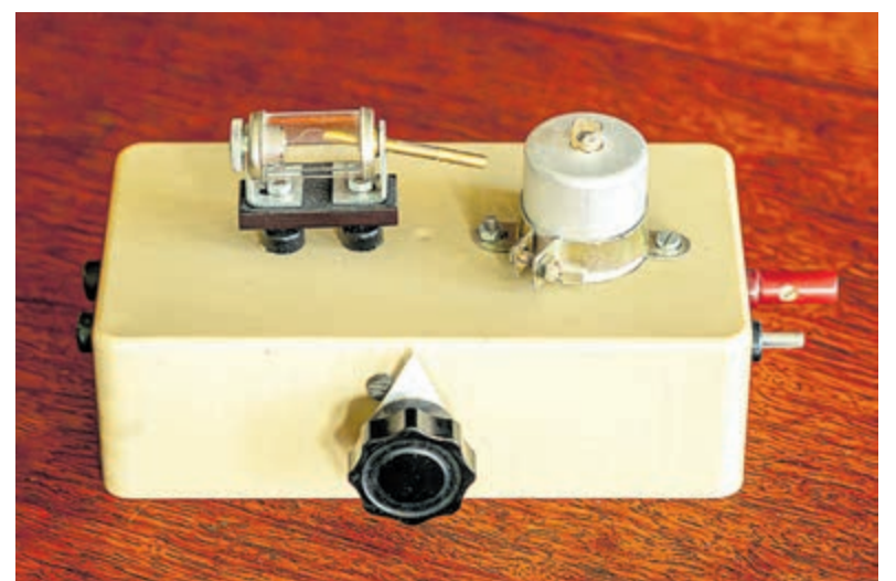
Het type kristalontvanger waarmee Henk in de oorlog probeerde Engelse zenders te ontvangen.