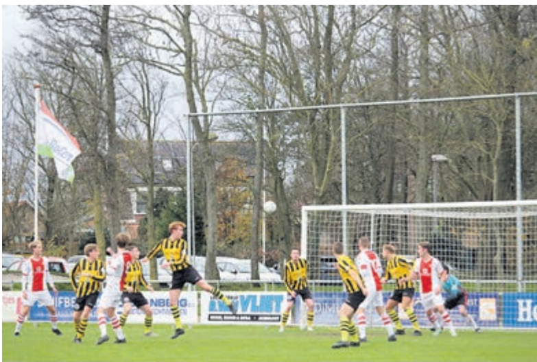
Spitsuur voor de Meervogels-goal.