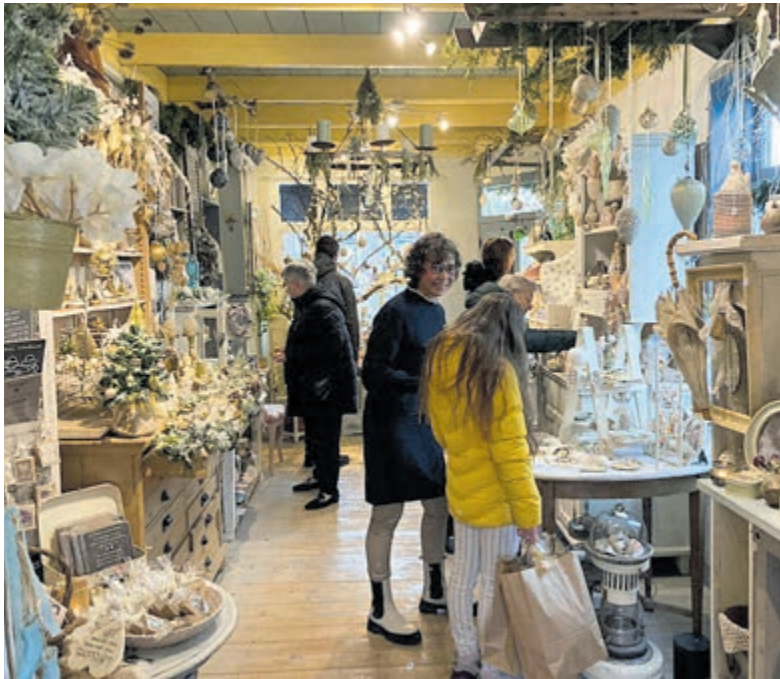
Anastasia in wintersfeer.

Limmen - Ook dit jaar is Anastasia, de winkel voor creatieve cadeaus, brocante en sfeervolle decoraties, geheel in winterse sferen gehuld. Het is al voor de elfde keer dat klanten kunnen genieten van dit sprookjesachtige tafereel. In een warme ontspannen sfeer, met de heerlijke geuren van glühwein en een gezellig knetterende open haard, word je verrast en geïnspireerd door de lieve, leuke en creatieve cadeautjes met een persoonlijk tintje. Anastasia in wintersfeer is nog de komende twee weekenden geopend aan de Dusseldorperweg 97 in Limmen. Voel je welkom op vrijdag, zaterdag en zondag van 11.00 tot 17.00 uur.