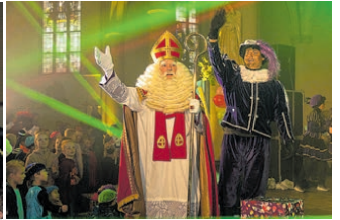
Sint en Piet in de spotlights