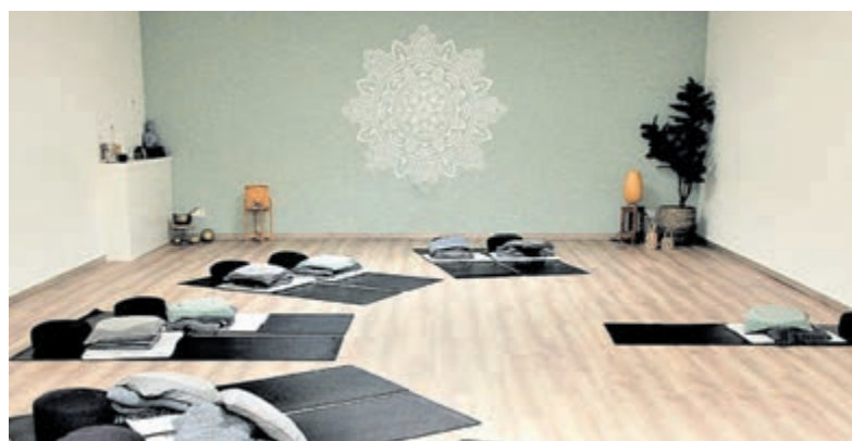
De training wordt in een fijne ruimte gegeven.