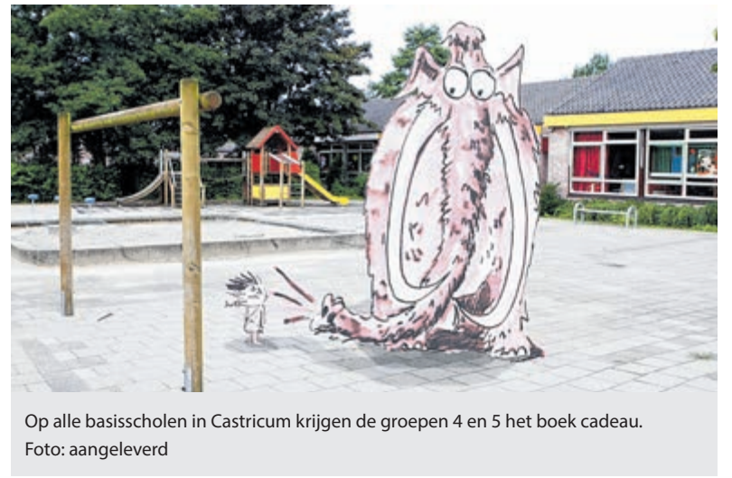
Op alle basisscholen in Castricum krijgen de groepen 4 en 5 het boek cadeau.

gitaren, mondharmonica, dwarsfluit, saxofoon en nog veel meer is het een programma om naar uit te kijken. Zondag 28 november om 15.00 uur te zien in Heiloo. Kaarten à 15 euro zijn online te koop via www.cultuurkoepelheiloo.nl en bij het VVV-kantoor op Landgoed Willibrordus.