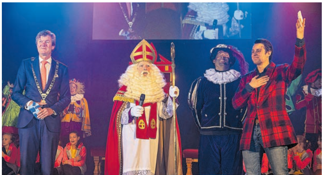
Kinderen zingen een welkomstlied voor Sinterklaas