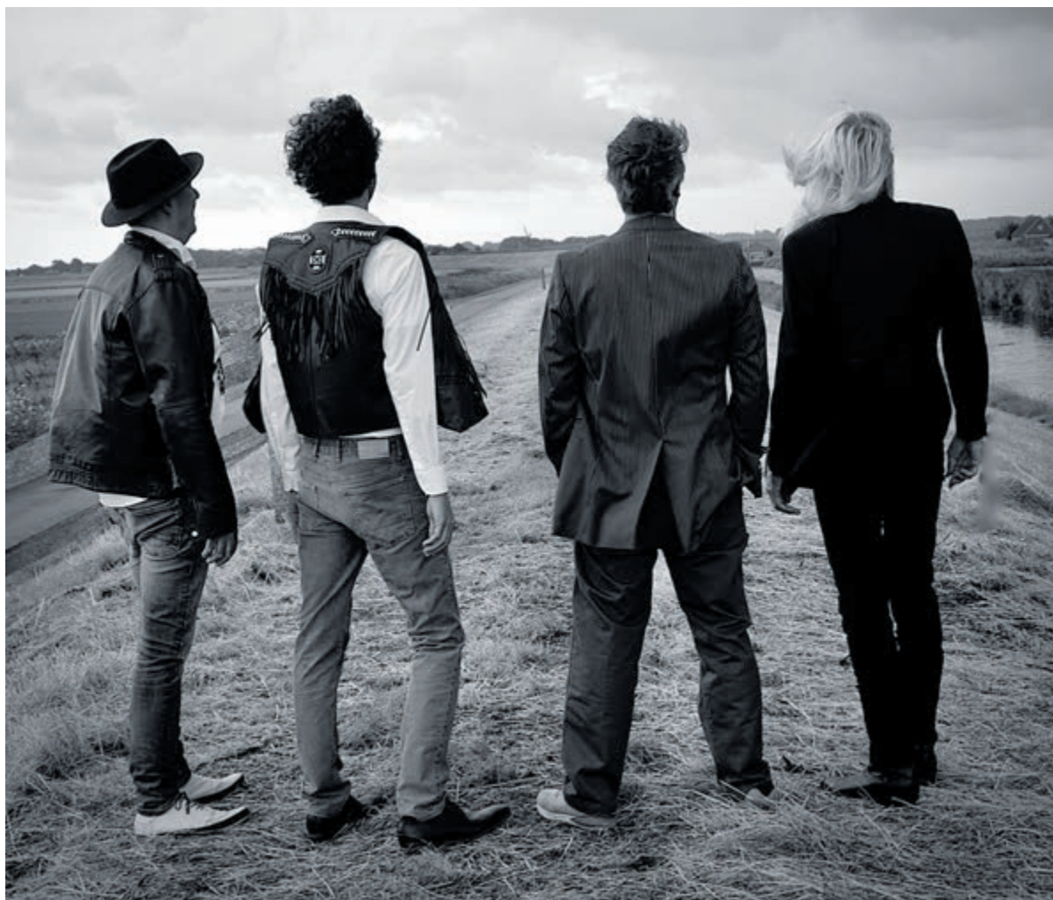
Vier muzikanten brengen een eerbetoon aan de 80-jarige Bob Dylan.

zich af tijdens deze cruciale kerstdagen in de vroege jaren 90 waarin prinses Diana besluit dat haar liefdeloze huwelijk met prins Charles niet werkt. Ze zal moeten afwijken van het pad dat voor haar was uitgestippeld als toekomstige koningin. Spencer is een verbeelding van wat er gebeurd zou kunnen zijn tijdens die paar noodlottige dagen.