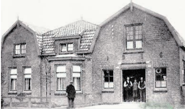
Woonhuis en werkplaats AC Borst 1923 aan de Bakkummerstraat 79.