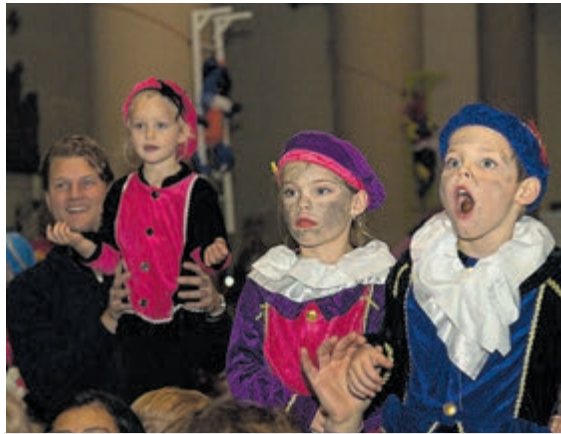
Lekker uit je dak gaan tijdens de show