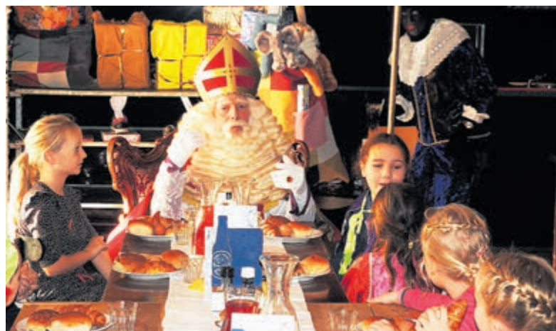
Ontbijten met Sinterklaas behoort tot de mogelijkheden.

Castricum/Akersloot/Limmen - Het zal niemand ontgaan zijn; Sinterklaas is weer in Castricum, Akersloot en Limmen aangekomen. Hij heeft in Castricum zelfs zijn slaapplek ingericht om zo dicht mogelijk bij de kinderen te verblijven en natuurlijk ook de ouders. Dorpshart Castricum en zijn ondernemers spelen hier goed op in.