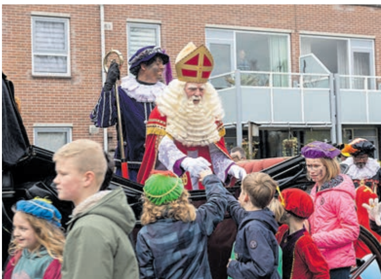
Handen schudden als de stoet voorbij komt