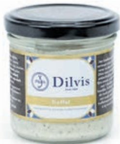
De ambachtelijk gemaakte truffelmayonaise van Dilvis.

Akersloot - Het familiebedrijf Dilvis, dat sinds 1884 bestaat, heeft deze maand iets te vieren. In november 2011 begon het visbedrijf via Palingshop.nl met de verkoop van vis via het internet. En niet zonder succes. Inmiddels bestaat de webshop tien jaar en worden er tienduizenden klanten in Nederland en België dagelijks voorzien van heerlijke verse en gerookte visproducten. Ter gelegenheid van het jubileum heeft Dilvis een exclusieve truffelmayonaise op de markt gebracht. Deze truffelmayonaise is tot stand gekomen dankzij een samenwerking