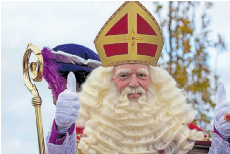
Sint was duidelijk in z'n nopjes nu de intocht kon doorgaan

Castricum - Niet alleen de kinderen genoten van de intocht van Sinterklaas, maar ook de Goedheiligman zelf. Het was aan alles te merken. Er hing weer een ouderwetse, gezellige sfeer, zowel tijdens de intocht als tijdens de show. Bijaand een foto-impresie. Foto's en tekst: Henk de Reus