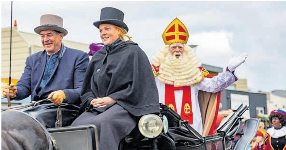
Sinterklaas is blij dat de intocht dit jaar is doorgegaan.