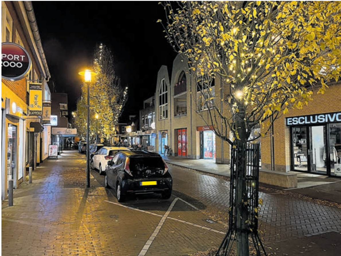
De verlichting in het dorp is er flink op vooruit gegaan.