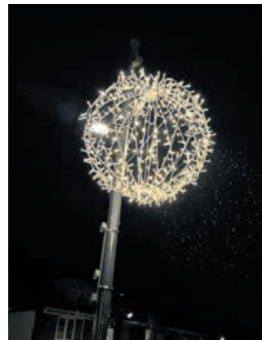
De lantaarnpalen zijn versierd met lichtbollen.

Het Dorpshart blijft tot en met het eerste kwartaal van 2022 feestelijk verlicht. Daarna worden de lampjes opgeslagen, om november weer terug te komen. „Om de donkere maanden net een beetje extra sfeer te geven.”