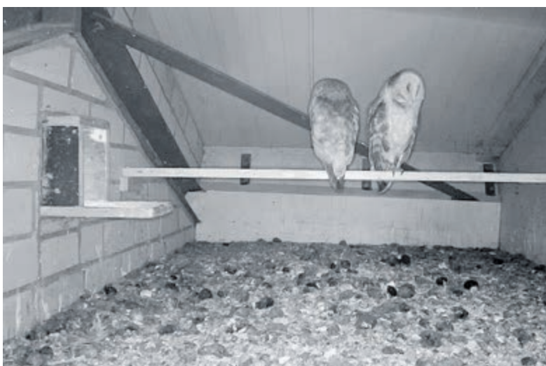
Piet heeft een infrarood cameraatje in de nestkast opgehangen om de uilen live te kunnen volgen.