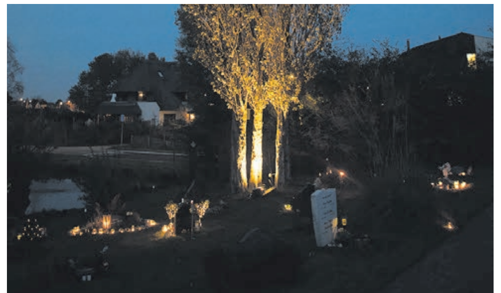
Een eerdere editie van allerzielenherdenking in Castricum.

knutselwerkje bij het monument plaatsen. Ook bestaat – evenals in voorgaande jaren – de mogelijkheid om een gedicht of foto te laten ophangen. Dit dient men vooraf aan te melden. De looproute over de begraafplaats voert langs deze gedichten en foto's. Wie dat wil, kan zelf een kaars