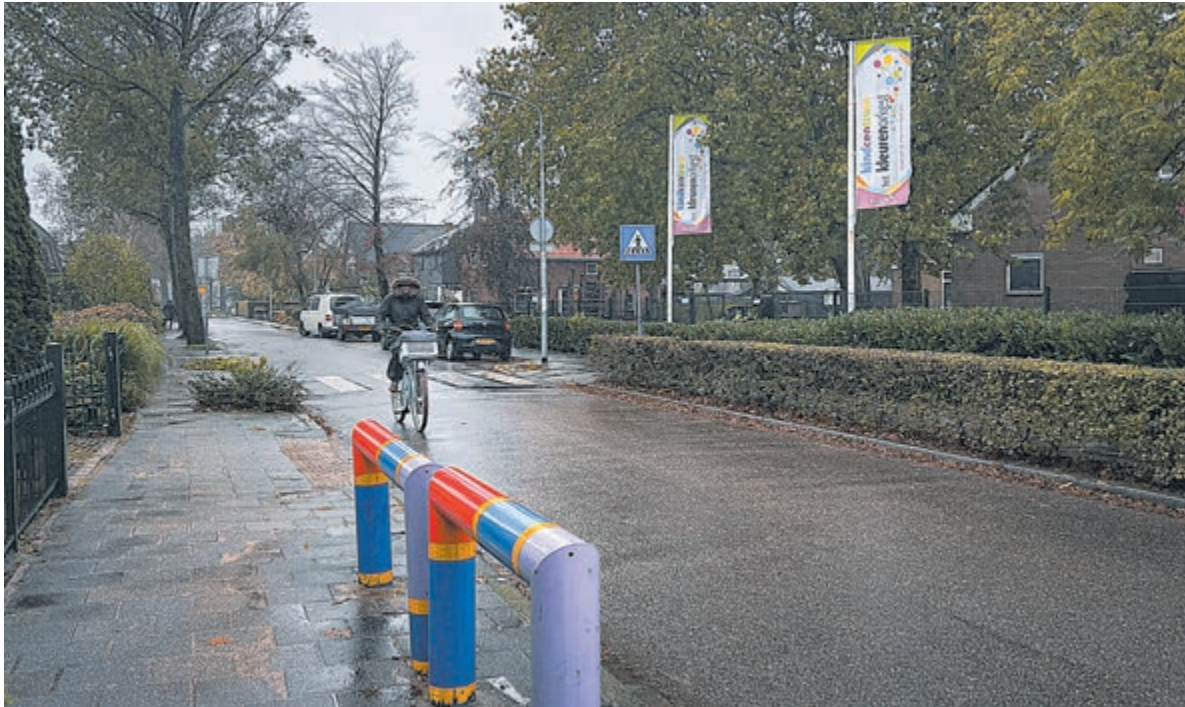
Kindcentrum Het Kleurenorkest.