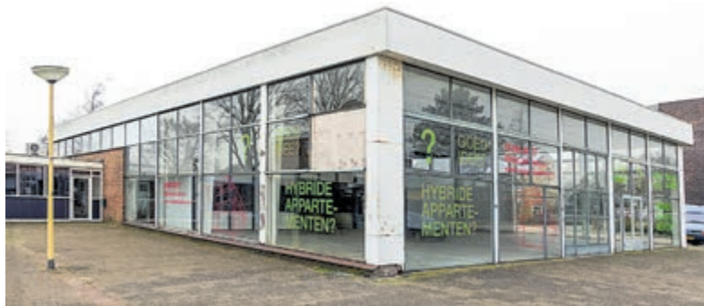
De voormalige garage van Cambium, die al jaren wacht op de komst van appartementen.

Castricum - Vanaf het voorjaar van 2021 wordt er gesproken om de bebouwing op het Kooiplein, inclusief de leegstaande garage, te herontwikkelen. Afgelopen donderdag werd er door de betrokken ontwikkelpartijen tijdens een raadsinformatiebijeenkomst een toelichting gegeven op de stand van zaken, waaruit bleek dat er nog geen ontwerp kon worden getoond.