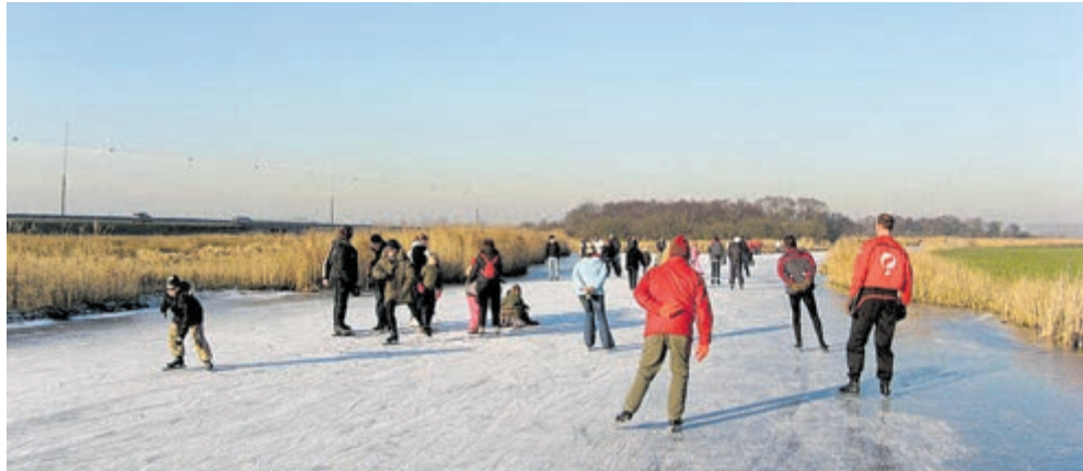
Schaatsers op de Slikker Die langs de A9.