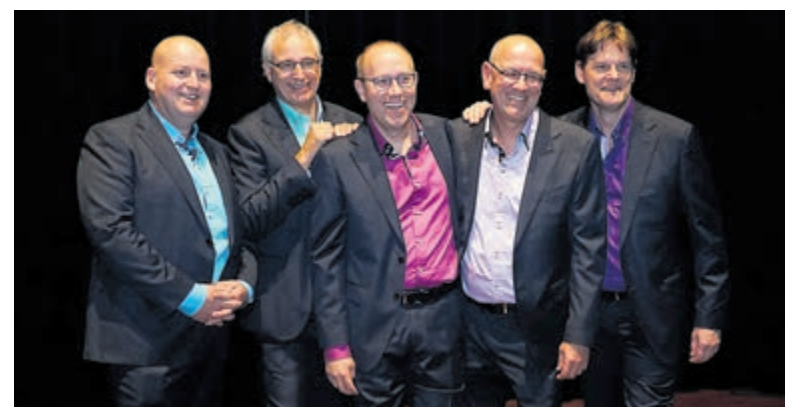
Het kwintet Brothers-4-Tune heeft leden uit Velsen en Castricum.

De zaal aan het Wilhelminaplein 1 gaat om 15.00 uur open en de muziek start om 16.00 uur. Uiteraard is de toegang gratis.