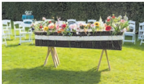
Een bloemenband rond de mand of kist is een relatief nieuwe trend.

Soms willen de nabestaanden aandacht vragen voor een goed doel en vragen ze in plaats van bloemen om een donatie. Soms is het duidelijk dat de overledene alleen van een bepaalde kleur bloemen hield en wordt er gevraagd om rode, witte of juist kleurige bloemen en soms wil men juist een bepaalde soort bloem wel of niet: geen lelies of alleen rozen. Vaak