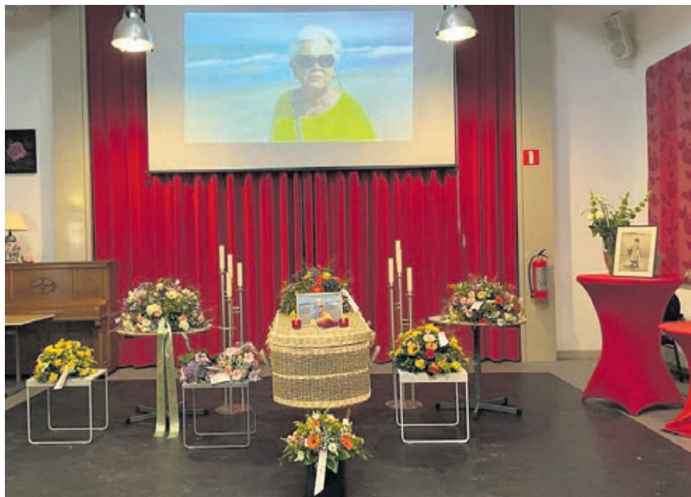
Het afscheid van Janny werd geregeld door Charon Uitvaartbegeleiding.

Lees mijn volledige verhaal op de website: www.charonuitvaartbegeleiding.nl/mijn-eerste-uitvaart/ ."