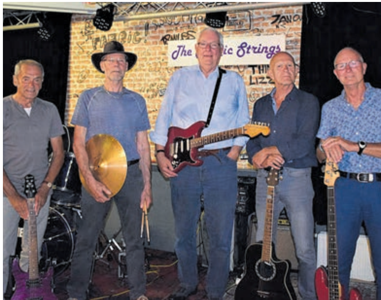
The Magic Strings.

Akersloot - In het begin van de jaren 60 van de vorige eeuw ontstond in Akersloot het eerste gitaarbandje dat zich richtte op de toenmalige merendeels Amerikaanse popmuziek van onder meer Buddy Holly en The Everly Brothers. Al snel trad de band