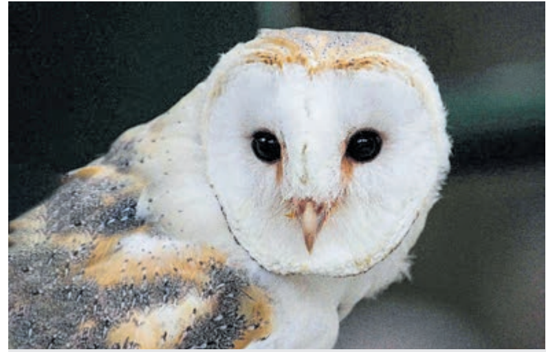
Een volwassen kerkuil.

Piet zegt dat het beter gaat met de kerkuil. „Dit is mede te danken aan het plaatsen van nestkasten op plekken waar de uil graag nestelt; hoog in schuren, kerken en bomen. Vogelwerkgroepen zoals die van ons zijn hier verantwoordelijk voor. Waren er begin jaren 90 nog maar 100 broedparen in Nederland, vorig jaar waren het er 4000!“ Ook belangrijk is de muizenpopulatie: geen voer, geen uilen!