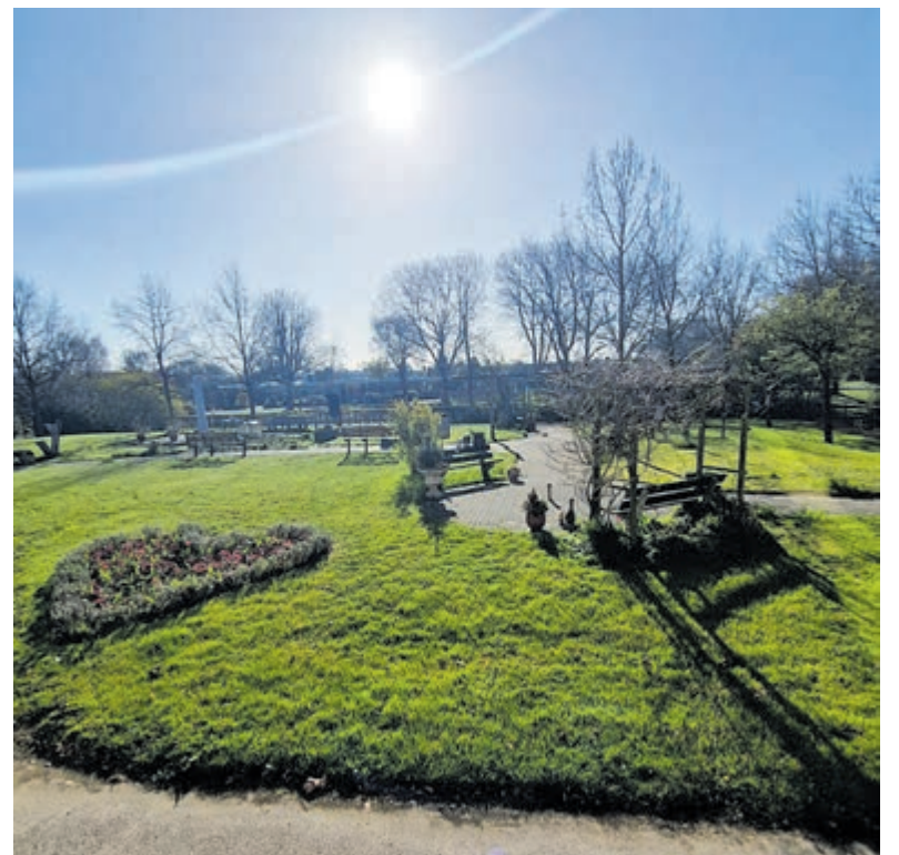
De vernieuwde tuin bij woonzorgcentrum De Santmark.

Nieuwsgierig? Kom gerust eens een kijkje nemen! Je bent van harte welkom!