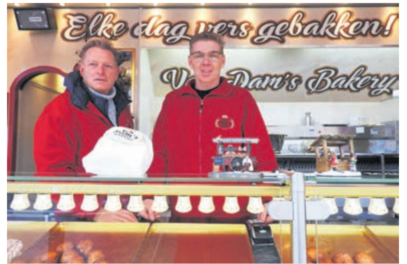
Het team van Van Dam's Bakery vorig jaar in Castricum.

(Uitgebreidere versie op www.castricummer.nl )