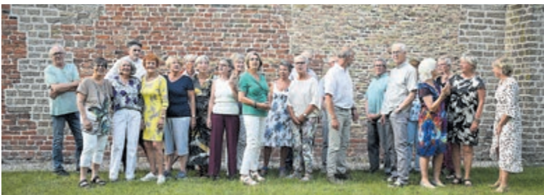
Het koor De Vredenburgers.