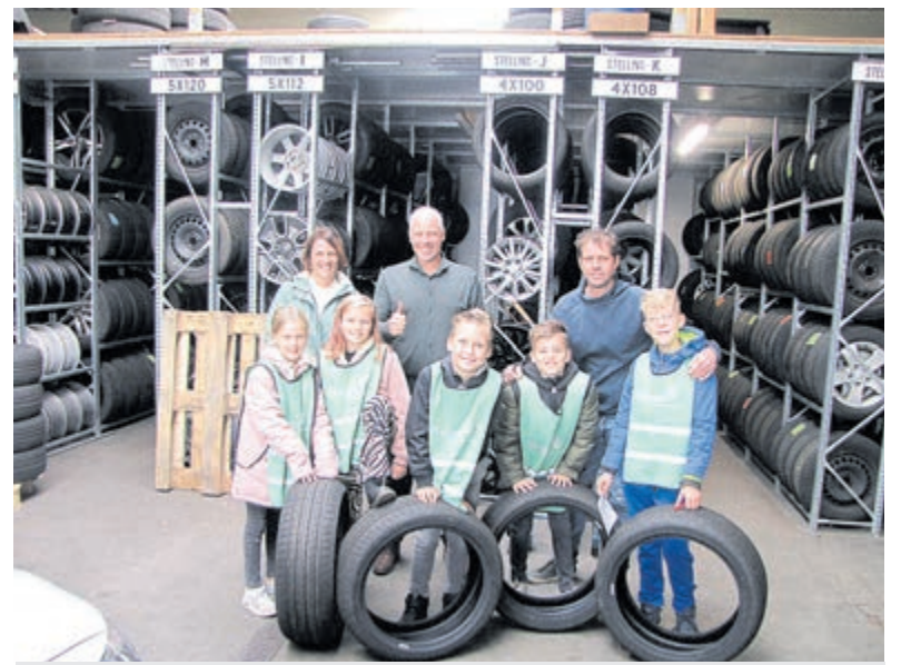
Een groep deelnemers aan de Roefeldag met hun begeleiders.

Nieuwsgierig? Kijk dan vooral eerst even op onze website www.gezondoud.nl of bel 06-53837045. Een proefles is uiteraard GRATIS