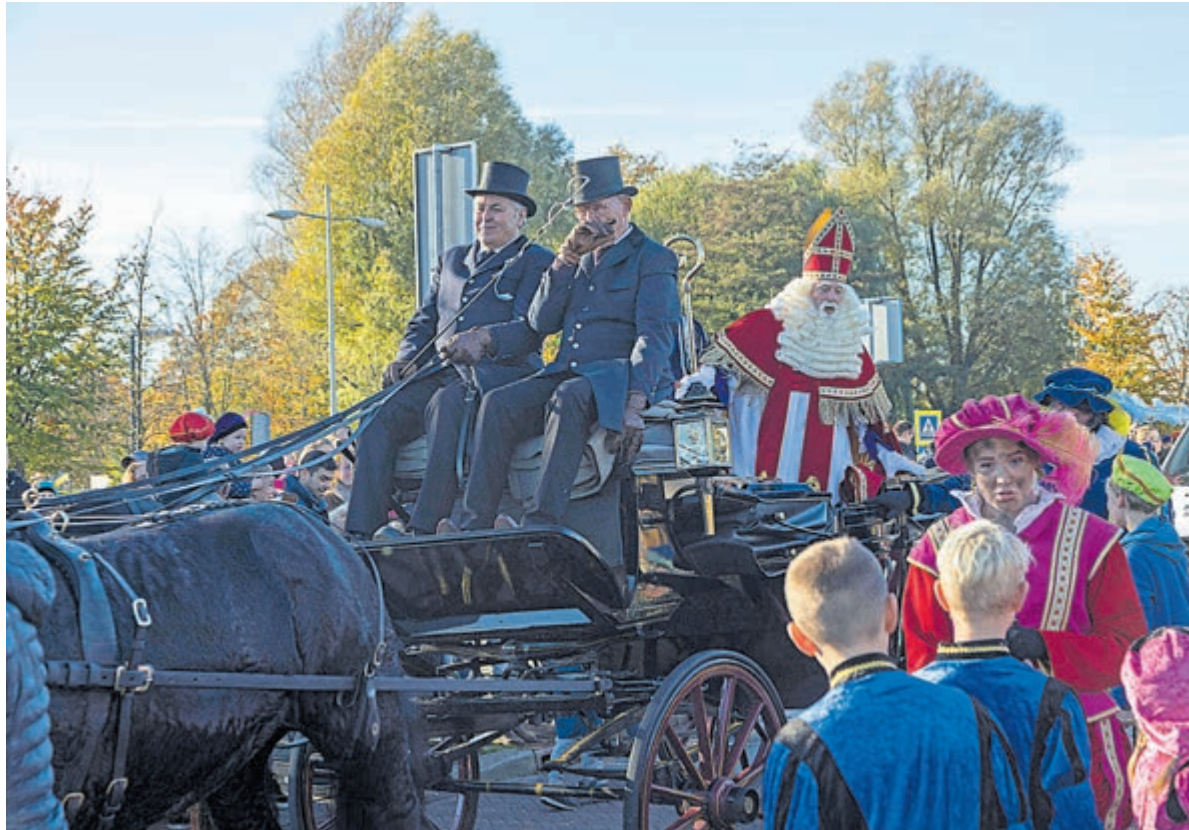
De intocht van Sinterklaas in 2022.