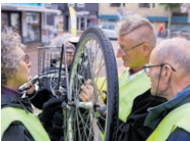
Vrijwilligers controleren gratis de fietsverlichting.