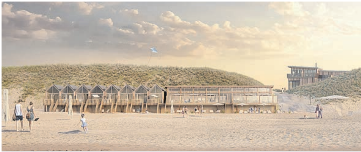
Artist impression van het nieuwe paviljoen Zoomers met strandhuisjes.