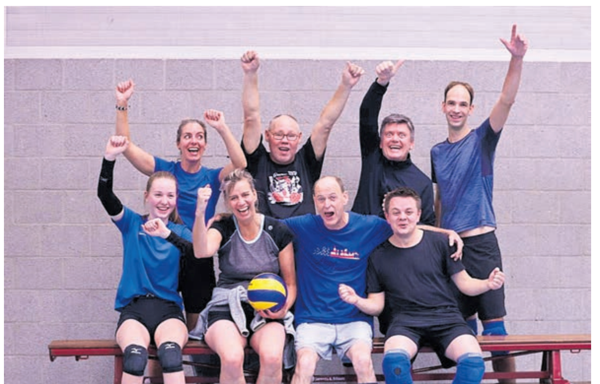
De winnaars van het Croonenburg Bitterballentoernooi.

Wil je meedoen of meepraten in Castricum, Limmen of Akersloot, laat dan van je horen door een e-mail naar castricum@fietsersbond.nl te sturen.