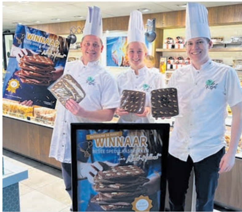
Het team van De Roset is trots op het winnen van de wedstrijd in Noord-Holland.

Castricum - Patisserie en chocolaterie De Roset heeft de lekkerste speculaasbrokken van Noord-Holland. Tot die conclusie kwam de jury van het Patisserie College tijdens de jaarlijkse wedstrijd. Vandaag wordt bekendgemaakt wie de lekkerste speculaasbrokken van Nederland heeft. Het is dus mogelijk dat ook hier De Roset als winnaar uit de bus komt.