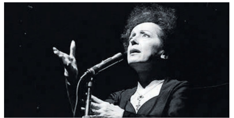
Edith Piaf (1915 - 1963) wordt geëerd met deze voorstelling.