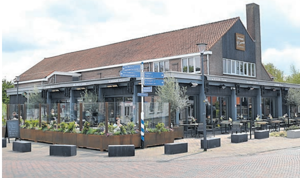
De Hooghe Heeren in Hoogwoud.