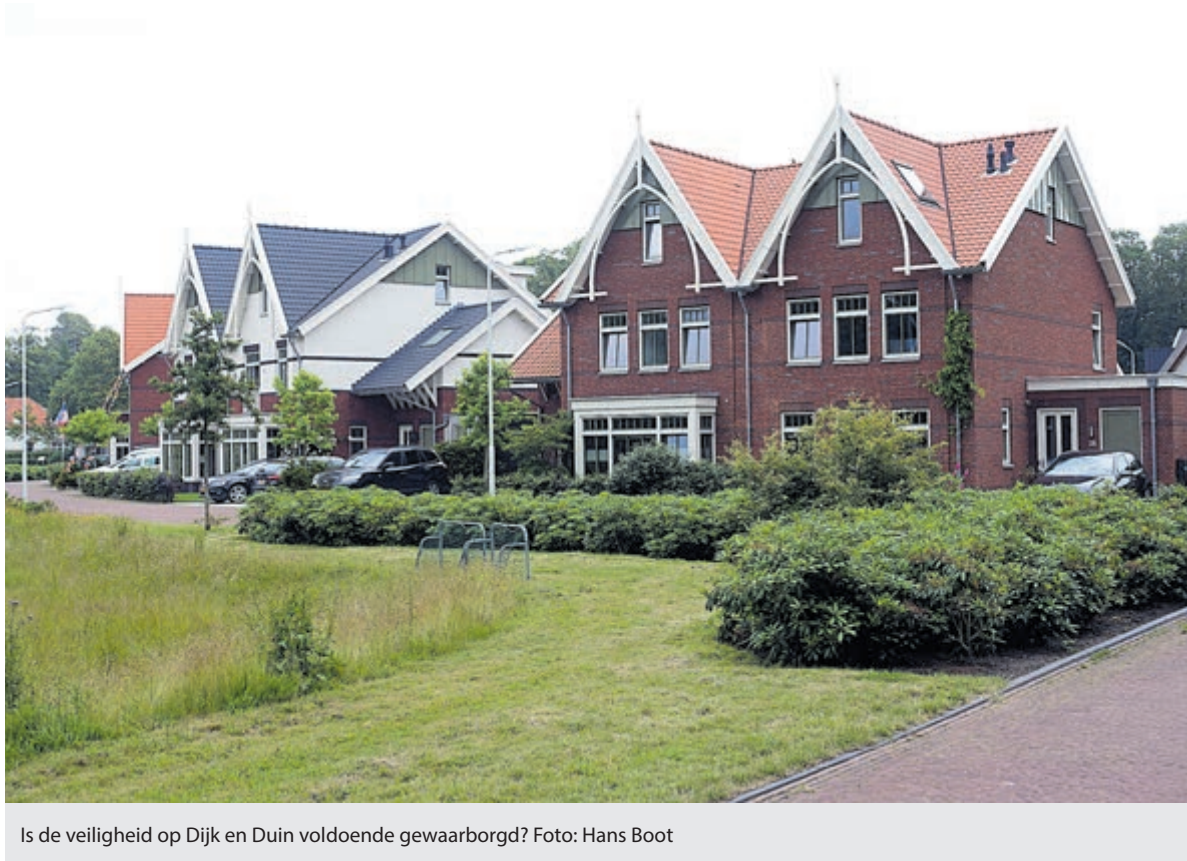
Is de veiligheid op Dijk en Duin voldoende gewaarborgd?

Op werkdagen is er een onderlinge waarneemregeling voor en door praktijken Bakker, Hoekstra, Coppoolse en vd Maarel. Info via websites, deurposters en telefoonbandjes. Praktijk Bakker gesloten van 11 t/m 15-10. Praktijk Hoekstra gesloten van 18 t/m 22-10.