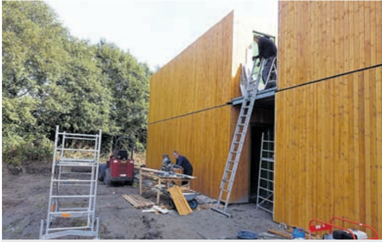
Aan de Castricumse flexwoningen wordt nog wel gewerkt.

Akersloot/Castricum - Het is algemeen bekend dat de nood onderzoekenden naar sociale huurwoningen schrijnend is. In Akersloot deed een commissie onderzoek naar de behoefte van deze huisvesting en stelde daarover een rapport op. Dat heeft weer een relatie met de bouw van flexwoningen en het verwijt van de provincie dat de gemeente te weinig toewijst aan statushouders.