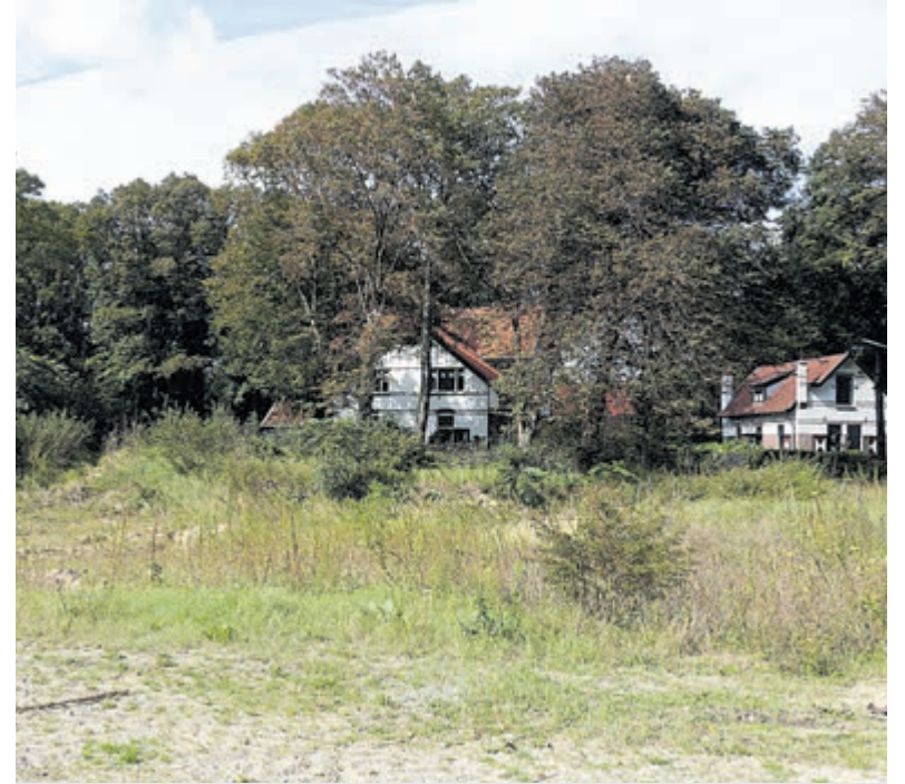
De locatie waar de elf woningen moeten komen.

Het onderwerp kwam ook nog ter sprake in de raadsvergadering van afgelopen donderdag. Daarvoor had de VVD een motie ingediend, waarin de partij stelde het onredelijk te vinden dat de gemeente aan de taakstelling wordt gehouden. Redenen hiervoor zijn dat de provincie op 23 juni aan het Rijk schreef de zorgen van Castricum te delen en de taakstelling zelf ook niet realistisch vindt. In de motie, die werd aangenomen, wordt het college onder andere verzocht via de provincie aan te dringen bij het Rijk op een nieuwe regeling, waarbij de taakstelling meer in evenwicht is met het aantal gerealiseerde nieuwbouwwoningen. De raad wil ook weten welk percentage van nieuw gerealiseerde woningen er nodig zou zijn voor sociale woningbouw om de taakstelling te halen. Tot slot wenst de raad dat het college zich voortaan inzet op de kwantiteit van huisvesting en zich baseert op een minimale voorziening als dat nodig is om de taakstelling te behalen.