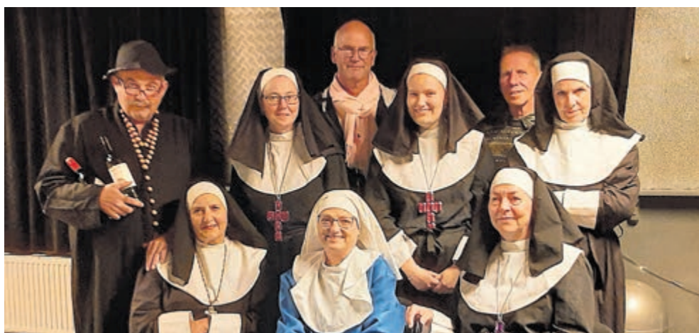
De cast van de voorstelling 'Zonde van de Zusters'.