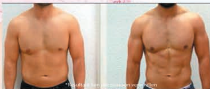
*Resultaat kan per persoon verschillen

1. Filipovic, A., Kleinöder, H., Dörmann, U., and Metzke, J. Electrostimulation—a systematic review of the effects of different electrostimulation methods on selected strength parameters in trained and elite athletes. J Strength Cond Res. 26(9): 2600-2614.