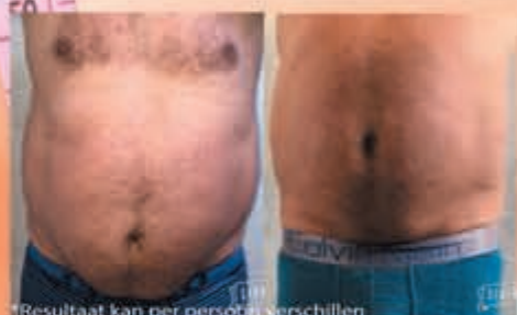
*Resultaat kan per persoon verschillen