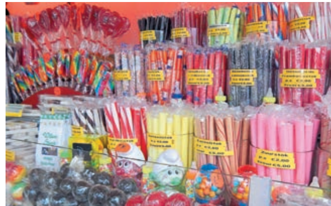
Zuurstokken, spejkes en draaien, altijd maar draaien in nostalgie. (Foto/tekst Aart Tóth)

Bakkum - Zaterdag 12 oktober gaan de remmen weer los in Bakkum op het Strandvindersplein, waar de jaarlijkse nostalgische kermis zal feestvieren. Zoals gebruikelijk is deze feestvreugde grotendeels afgestemd op kinderplezier. Prachtige nostalgische draaimolens, rupsen, maar ook sky-jumping. Uiteraard ontbreken ook de zuurstokken en suikerspinnen niet. De kermis zal tot en met maandag 14 oktober vertier geven.