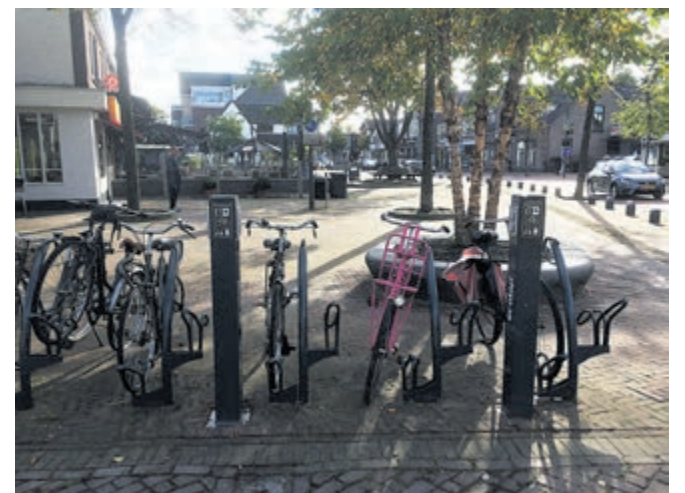
Gerealiseerd, E-bike laadpalen op dorpsplein.