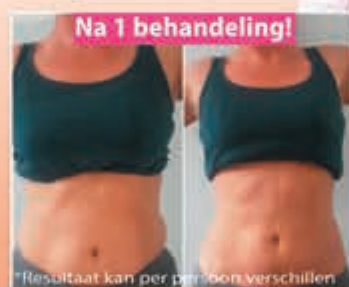
Na 1 behandeling!