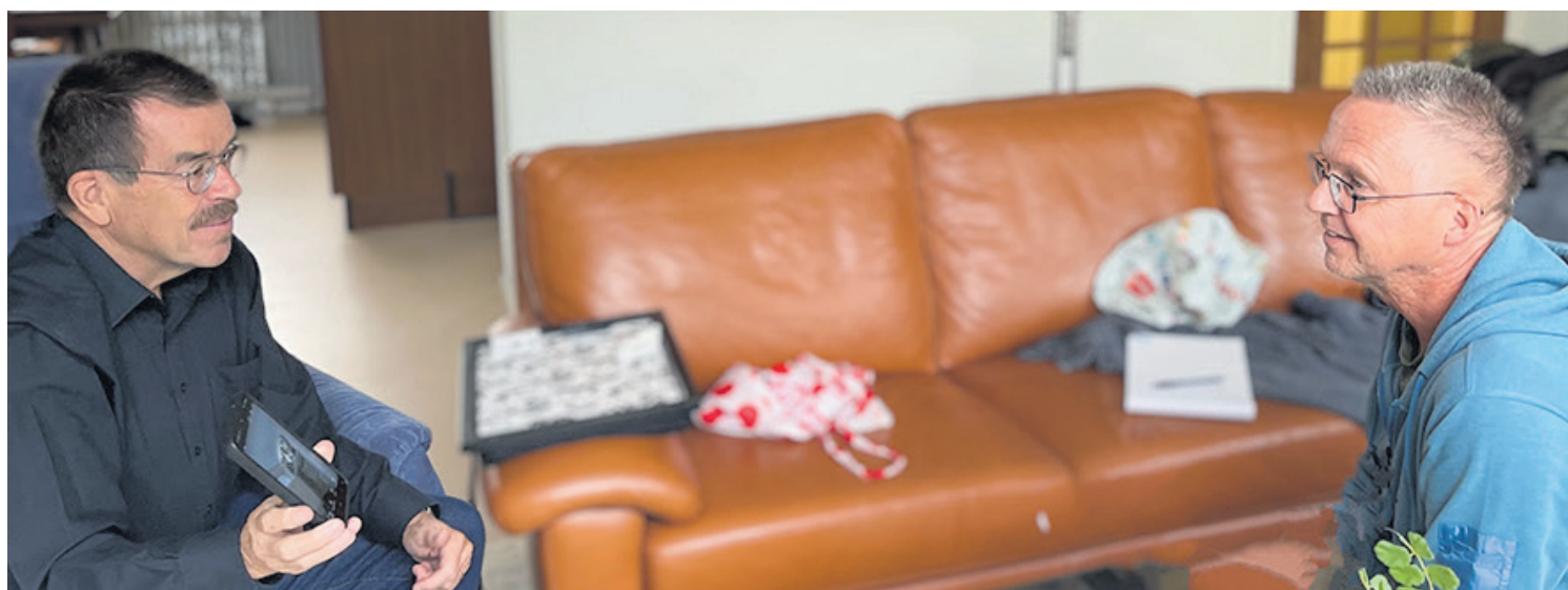
René Daalmans (links) en Arie Meijboom zijn energiecoaches bij CALorie Castricum.

Arie: „Vaak beginnen we met kleine stappen zoals radiatorfolie en ledverlichting. Andere zaken zoals gevelisolatie kunnen we al afleiden uit het bouwjaar van de huizen. Het is natuurlijk aan de bewoners om daar al dan niet wat mee te doen.” René: „Onze doelgroep is iedereen die iets wil met het huis en energieverbruik. In de praktijk merken we dat mensen die al langer bezig zijn met energiebesparing ook nog iets aan onze gesprekken kunnen hebben. Bijvoorbeeld de ontdekking dat de open haard een trekpat kan zijn waar de warme lucht uit verdwijnt. Of beter: elektriciteit verbruiken als de zon schijnt en je optimaal je zonnepanelen gebruikt. Daarvoor zijn handige hulpmiddeltjes op de markt. De coaches kunnen je daar alles over vertellen.”