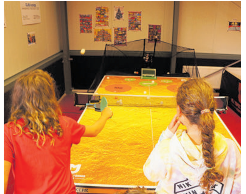
Spelen tegen een tafeltenniscomputer is ook onderdeel van de reguliere trainingen.