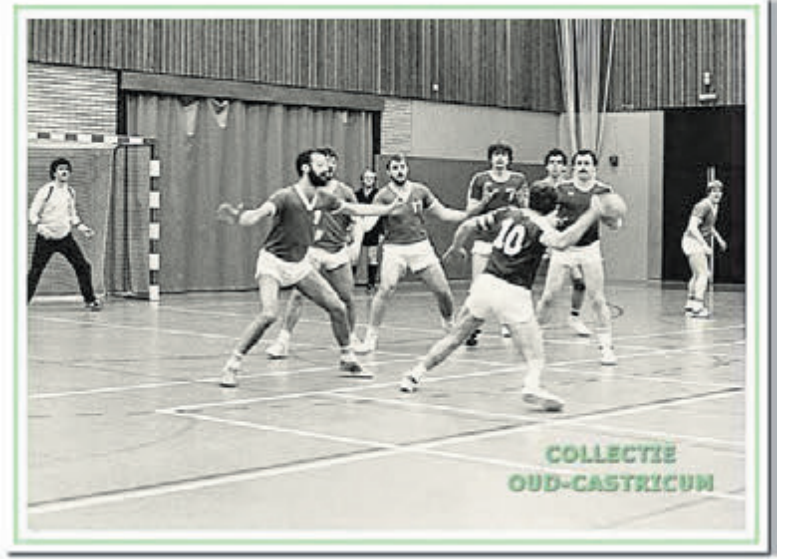
Het herenteam van CSV tijdens een wedstrijd in sportcomplex De Bloemen in 1984.