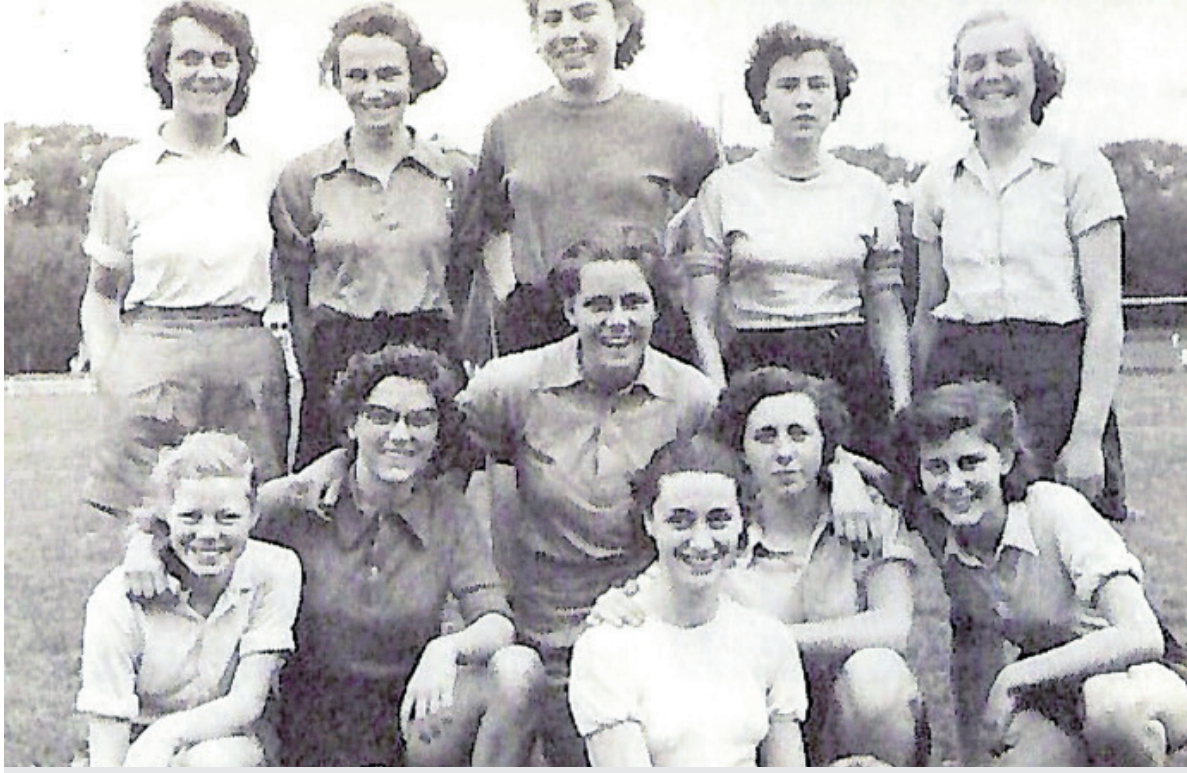
Het eerste damesteam van CSV in 1948.

Castricum - Seizoen 2023-2024 wordt voor de leden van handbalvereniging CSV extra bijzonder. De vereniging jubileert en organiseert diverse activiteiten om bij dat feit stil te staan. Dat begint al in september met een ouder-kind-toernooi voor leden. In november staat een reünie voor oud-leden op het programma.