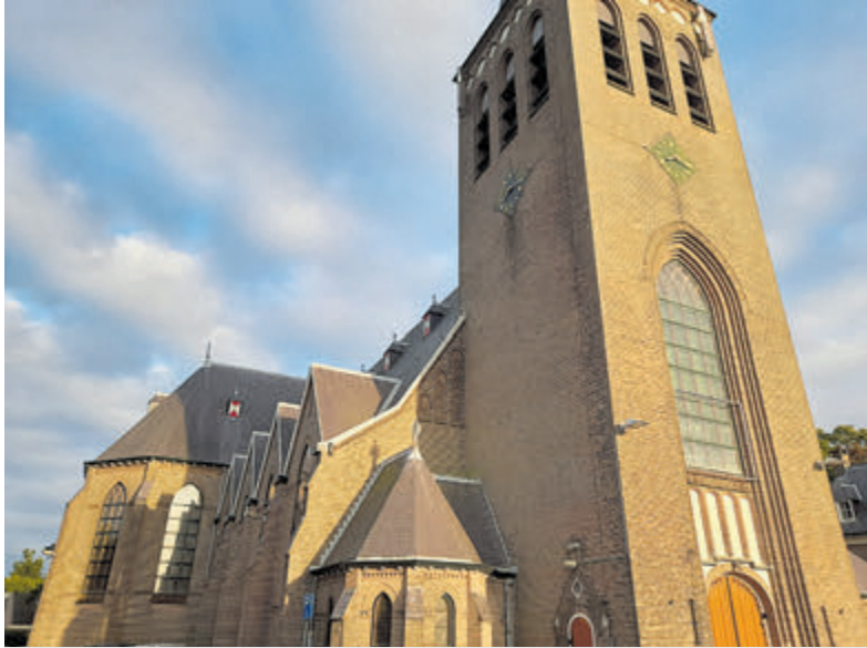
De St.-Pancratiuskerk aan de Dorpsstraat 113 in Castricum.

Castricum - Op zaterdag 9 en zondag 10 september zet parochie De Goede Herder Castricum de deuren van de St.-Pancratiuskerk aan de Dorpsstraat 113 weer wagenwijd open. Op zaterdag bent u van harte welkom van 13.00 tot 16.00 uur en op zondag van 11.00 tot 16.00 uur. In de kerk zullen bijzon-