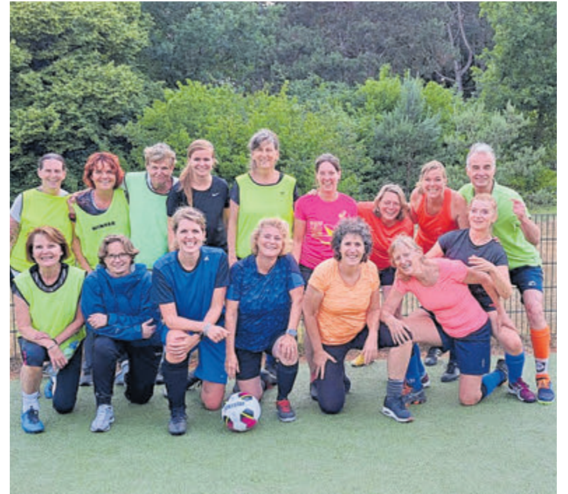
De deelnemende vrouwen zijn 35-plussers.