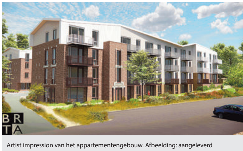
Artist impression van het appartementengebouw.

Castricum - Per brief van 11 augustus jl. zijn 450 huurders in Castricum door Kennemer Wonen geïnformeerd over de doorstroomvoorrang die wordt toegepast bij de toewijzing van de 48 in het najaar op te leveren appartementen op het landgoed Duin en Bosch. De gegadigden daarvoor zijn in de eerste plaats mensen van 55 jaar of ouder die in een sociale huurwoning van de corporatie in het dorp Castricum wonen.