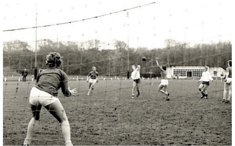
Het damesteam tijdens een wedstrijd in 1967.