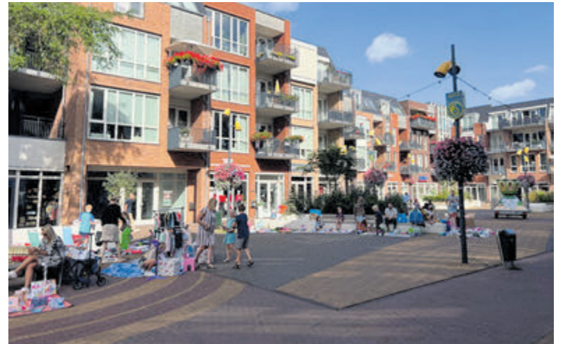
De kleedjesmarkt voor kinderen maakt ook deze keer deel uit van de zondagsmarkt.

caat aanschaffen. Een certificaat gaat ongeveer 75 euro kosten. De baten komen ten goede aan de certificaathouders. Als de stroomprijs (te) laag wordt dan wordt de opbrengst van de panelen aangevuld met een subsidie van de overheid. Omdat het stroomnet vol is heeft CALorie tijdig een aanvraag ingediend bij Liander. Die aanvraag is goedgekeurd en in de herfst van 2023 zal volgen planning een aansluiting worden gerealiseerd. Wie mee wil doen kan zich op https://zonopcalorie.nl inschrijven.