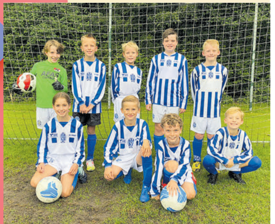
FC Castricum is een voetbalclub voor alle leeftijden.