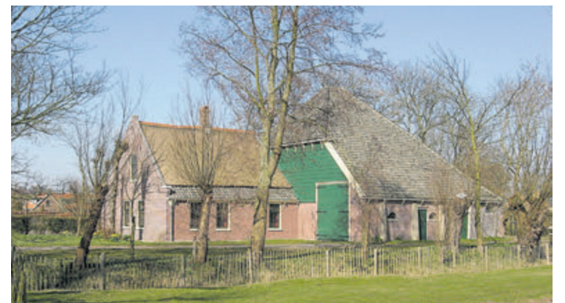
De boerderij aan de Breedeweg 80.

Wie met één of met beide projecten mee wil zingen, is van harte welkom bij de repetities op woensdagavond. Je kunt je opgeven bij Isabella Brandhorst (icbrandhorst@planet.nl).