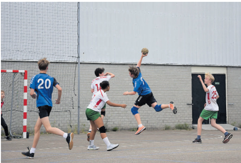
Spannende momenten tijdens een veldwedstrijd.

Op zaterdag 4 november is de grote reünie voor oud-leden van CSV. Het zal een gezellige bijeenkomst worden met veel ruimte om herinneringen op te halen. Wie erbij wil zijn, kan zich via www.csvhandbal.nl/over-csv/jubileum aanmelden of een e-mail naar jubileum@csvhandbal.nl sturen. Ook is het mogelijk om aan te melden voor de nieuwsbrief, waarin andere festiviteiten in het kader van het jubileum zullen worden aangekondigd. Medio januari zal een speciale verenigingsdag plaatsvinden waarbij de jeugd in actie kan komen samen met de senioren. Ook een clinic rolstoelhandbal staat op het programma. Verder worden in het jubileumjaar twee loterijen gehouden. Bij de opening van het speelseizoen op zaterdag 9 september zijn lootjes te koop (1 euro per stuk, zes voor 5 euro) waarbij onder meer kaartjes zijn te winnen voor voetbal- en handbalwedstrijden van topniveau. Een bedrijf in duurzame natuurlijke verzorgingsproducten heeft bovendien een pakket samengesteld ter