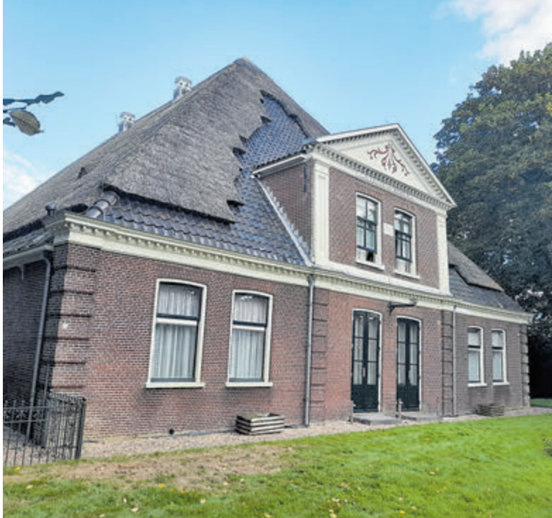
Cultureel centrum Vredeburg aan de Dusseldorperweg 64.