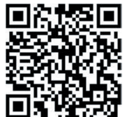
Aanmelden voor de Kermisrun is heel eenvoudig na het scannen van deze QR-code.

Indien je liever niet wilt meedoen aan de Kermisrun en langs het 2,2 kilometer lange parcours wilt komen kijken, voel je vrij om zelf de nodige sfeer te maken en de deelnemers een boost te geven! Dit kan in de vorm van muziek (maken), aanmoedigingen en/of sfeervolle versierselen langs de route, hier ben je geheel vrij in! Hang bijvoorbeeld de Limmer vlag op, maak er wat leuks van!