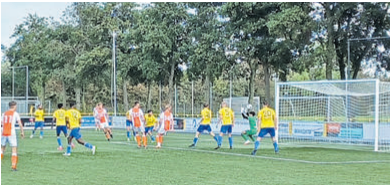
Limmen trad zondag aan met het vernieuwde team. Enkele jeugdleden hebben de plaatsen ingenomen van vier vertrokken basisspelers.