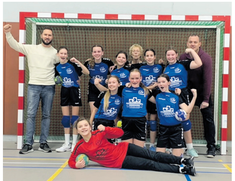
Jeugdteam D2 in 2022.

waarde van 150 euro. Op 4 november volgt de superloterij met prijzen als een uur vliegen voor twee personen, het bijwonen van een festival backstage met Kris Kross Amsterdam en overnachting inclusief ontbijt voor twee personen en is opnieuw een luxe verzorgingspakket.