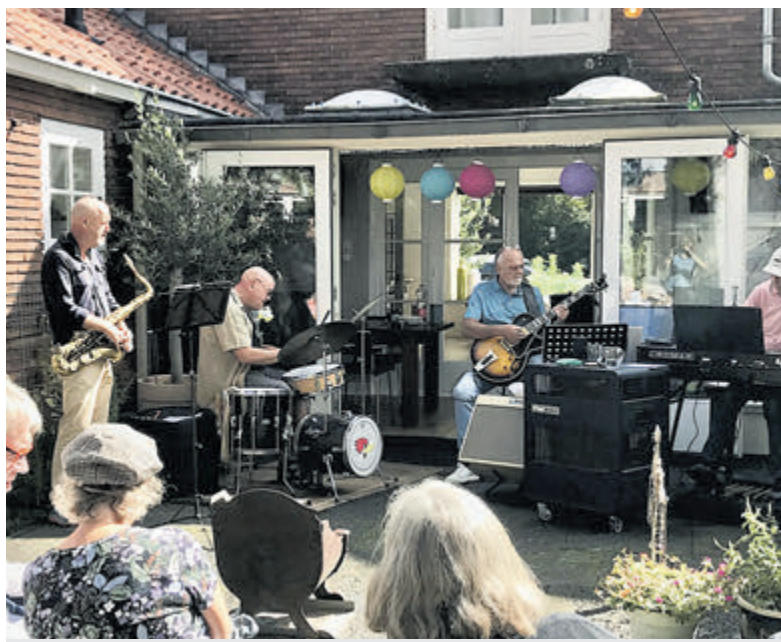
Sfeerimpressie van een eerdere editie van het Muziektuinen Festival.

Castricum - Het is bijna zover! Op 10 september, tussen 11.00 en 17.00 uur, barst de derde editie van het Muziektuinen Festival in Castricum