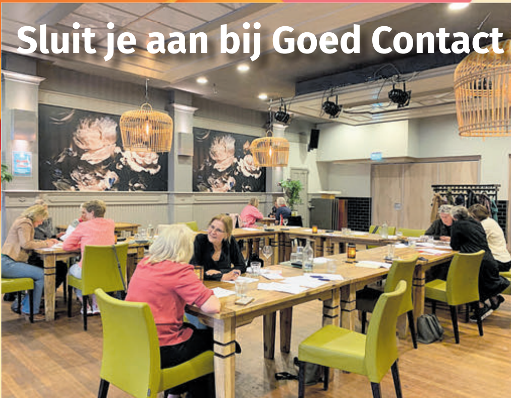
Leden van Goed Contact socratisch in gesprek.

Castricum - Goed Contact is een professioneel en zakelijk netwerk voor ondernemende vrouwen in Castricum en omgeving. Ondernemend kan zijn in loondienst, met een eigen onderneming of als zzp-er. Het zijn allemaal vrouwen die houden van initiatief nemen, die actief en betrokken zijn en die graag andere ondernemende vrouwen kennen. Het is een professioneel netwerk, gericht op beroepsmatige en ondernemersvaardigheden, persoonlijke ontwikkeling en inspiratie.