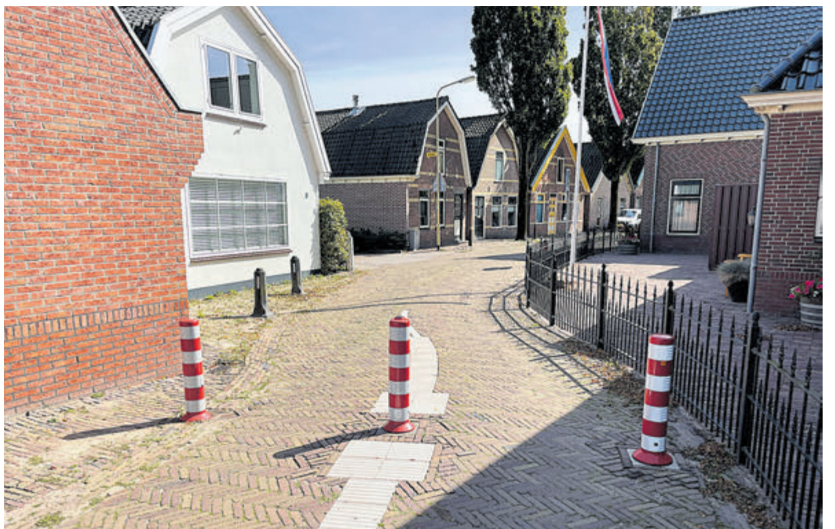
Het paaltje in de Schoolstraat.

de gemeenteraad dat heeft gevraagd. Uiteraard is dat objectief gebeurd. We hebben het verloop van de participatie teruggemeld aan de bestuurlijke klankbordgroep, inwoners en ondernemers. De resultaten worden nu samengevat en de diverse varianten worden doorgerekend om te bekijken of ze het probleem goed gaan oplossen.” De gemeente verwacht de uitkomsten in oktober aan het college en de raad voor te leggen. „Zodra zij het rapport hebben ontvangen, worden de uitkomsten ook besproken met de VCV. De raad neemt daarna een tussenbesluit.”