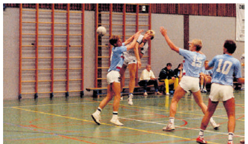
Het herenteam van CSV in actie (jaartal onbekend).

Bedrijven die nog iets aan sponsoring (in diensten of producten) voor de loterij willen bieden of anderszins wil sponsoren (reclamebord, teamshirts, groene sponsor) kunnen via sponsoring@csvhandbal.nl contact opnemen.