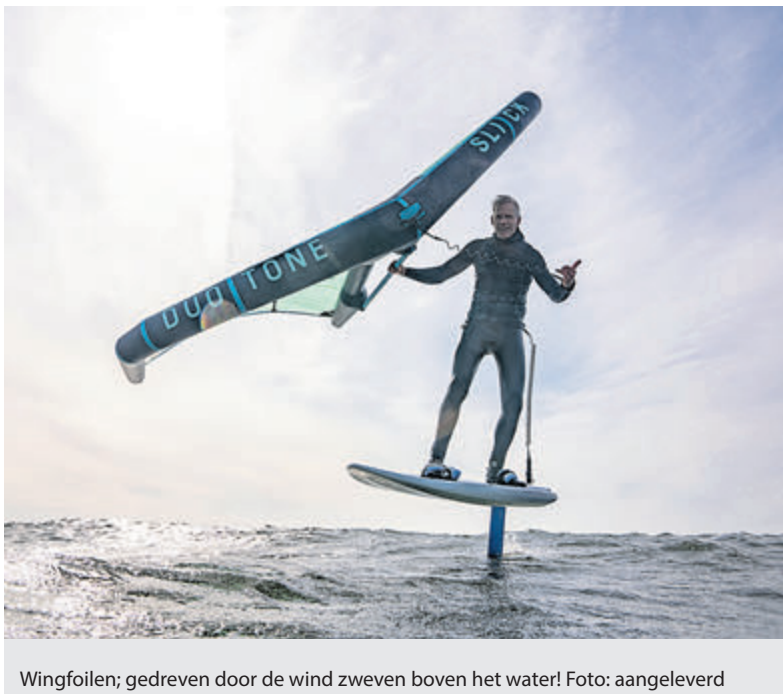
Wingfoilen; gedreven door de wind zweven boven het water!

Castricum - Aan de Castricummer Werf 2a bevindt zich de unieke winkel Surfspots Castricum. Een winkel, ontstaan vanuit de persoonlijke passie van ondernemer Robert Adrichem voor de surfsport. Je kunt