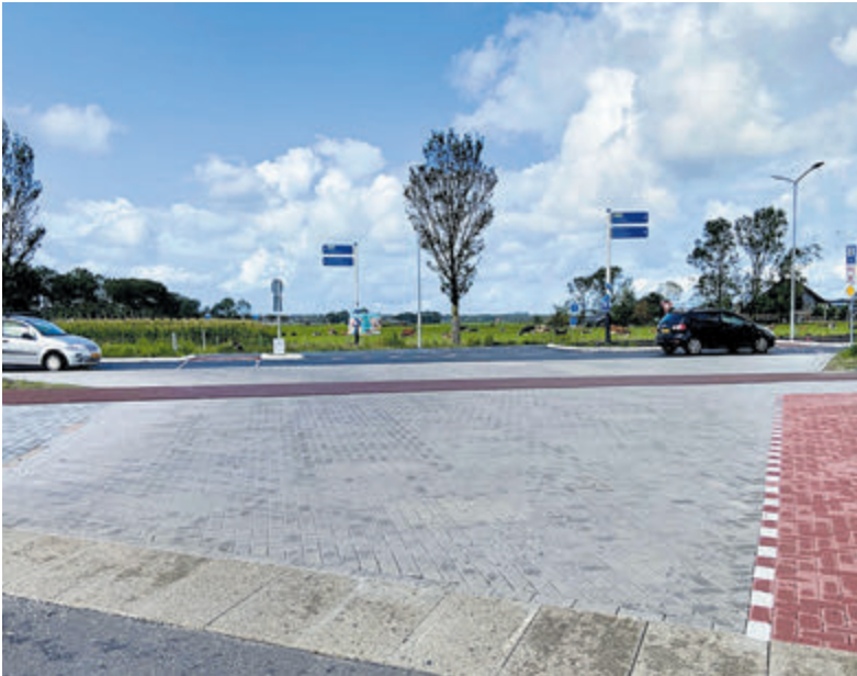
Zicht op het kruispunt vanaf de Uitgeesterweg.

Aansluitend kunnen volwassenen zich vanaf 10.00 uur inschrijven voor de Katerloop. Zij betalen 5 euro per persoon en starten om 10.30 uur.