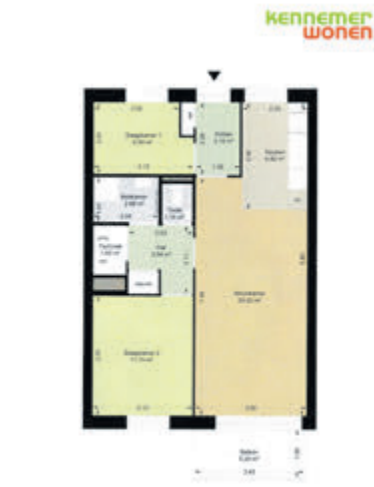
Plattegrond van een woningtype.

„In Nederland wordt het aandeel ouderen steeds groter en ook de gemiddelde leeftijd komt steeds hoger te liggen. Tegelijkertijd wordt zo lang mogelijk thuis wonen vanuit