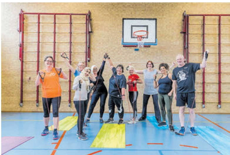
Enthousiaste deelnemers aan de leefstijllessen voor volwassenen.

Castricum - Wil je graag fitter of actiever worden? Dan zijn de leefstijllessen voor volwassenen echt iets voor jou! Sport en bewegen heeft een positieve bijdrage op de fysieke en mentale gezondheid. Daarnaast zorgt sporten/bewegen voor plezier en ontmoeting. Soms is het lastig om te weten welke sport- of beweegactiviteit én aanbieder er bij iemand past. Tijdens deze lessen kunnen volwassenen (30 t/m 60 jaar) uit de gemeente Castricum dat onderzoeken.