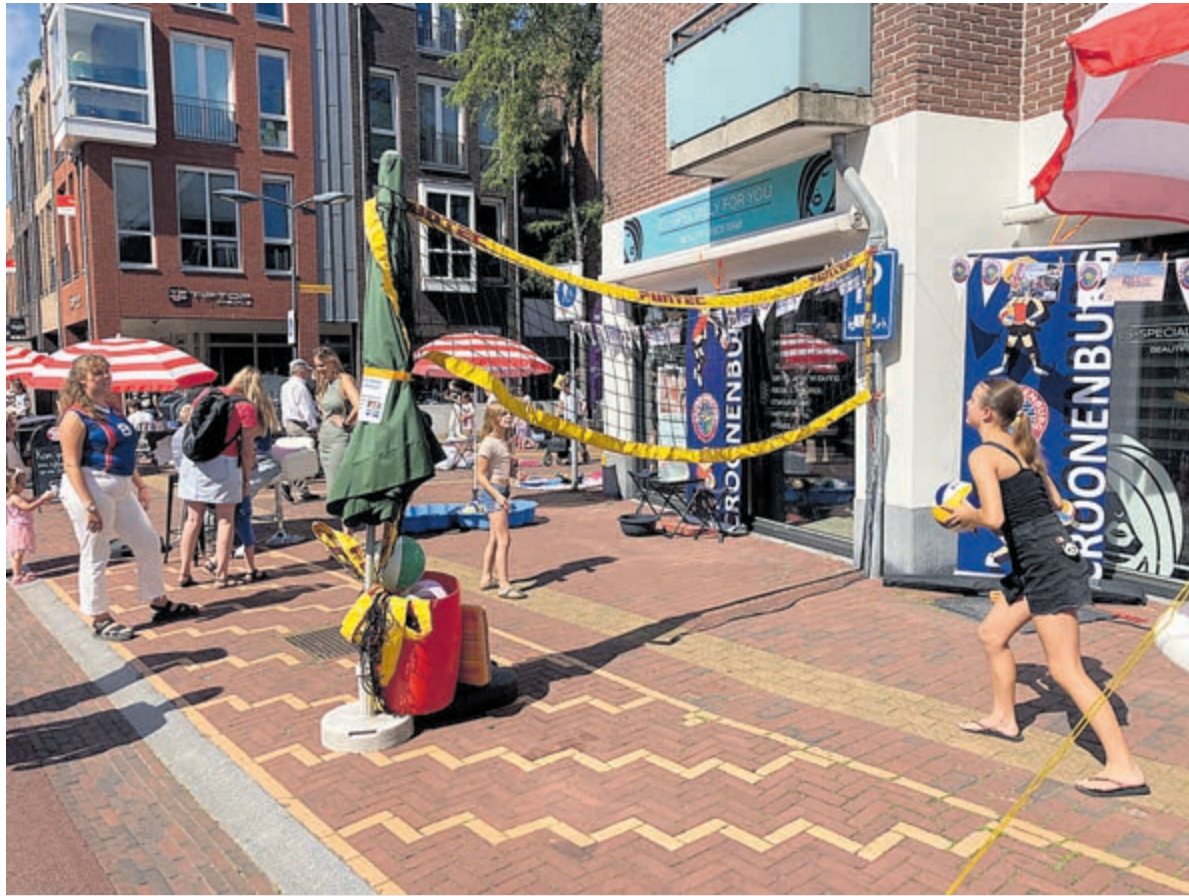
Aan de volleybaloefening van Croonenburg werd enthousiast deelgenomen.