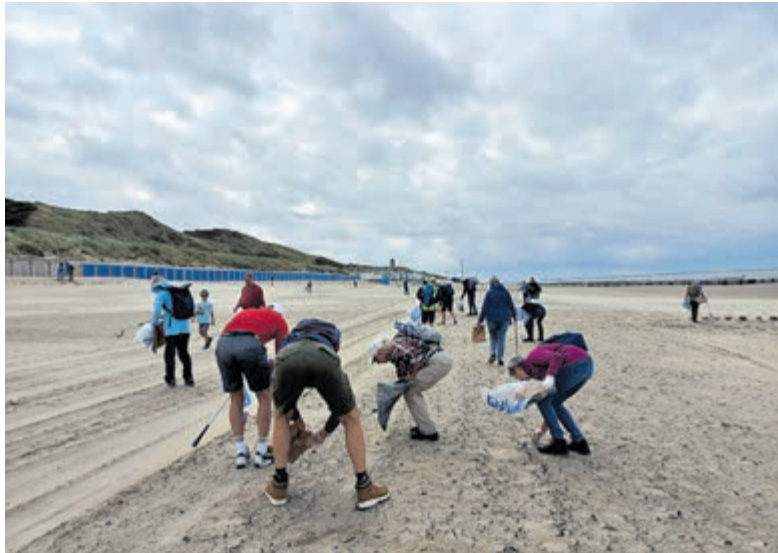
In twee weken tijd ruimden de vrijwilligers de hele Noordzeekust op.

Regio - Vorige week dinsdag kwam de Boskalis Beach Cleanup Tour van Stichting De Noordzee ten einde. Van 1 tot en met 15 augustus ruimden 1827 vrijwilligers in dertig etappes de hele Nederlandse Noordzeekust op. De vrijwilligers haalden in vijftien dagen 6081 kilo afval op van de stranden van Schiermonnikoog tot en met Cadzand. Ze raapten tevens 27.854 sigarettenpeuken op.