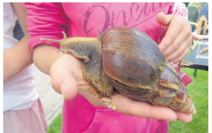
De reuzenslak is één van de beestjes die de kinderen tijdens het Beestjespad van dichtbij kunnen bekijken.

Het atelier van schilderes Sabrina Tacci en fotograaf Marina Pronk aan de Van Oldenbarneveldweg 32 in Bakkum is elke vrijdag van 13.00 tot 18.00 uur geopend voor publiek. Tevens elk tweede weekeinde van de maand geopend op zaterdag en zondag van 13.00 tot 18.00 uur.