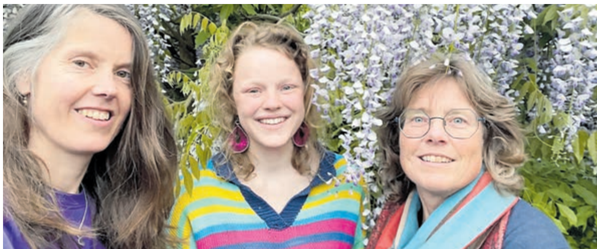
De zanggroep Kamilliedjes.

Een selectie van haar gedichten en keramiek is te zien in de etalages van Dorpsstraat 63 in Castricum.