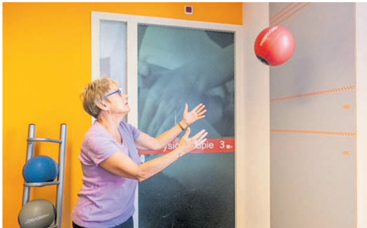
Met de training valpreventie werk je aan het verbeteren van kracht en balans.

mers avond-bosbad. Ga je mee? Op 17 september kun je ook meedoen aan een natuurbelevingsdag met het thema 'Oogst'. Tijdens maandelijkse natuurbelevingsdagen ga je aan de slag met wat op dat moment buiten te vinden is en leer je wat geneeskrachtig is en eetbaar. Je maakt een kruidenproduct en een kunstwerk, proeft een wilde lunch, beleeft een natuurritueel in de boshutten van St.-Wilfried. Meer informatie is op www.natureworks.nl te vinden (of mail naar info@natureworks.nl ).