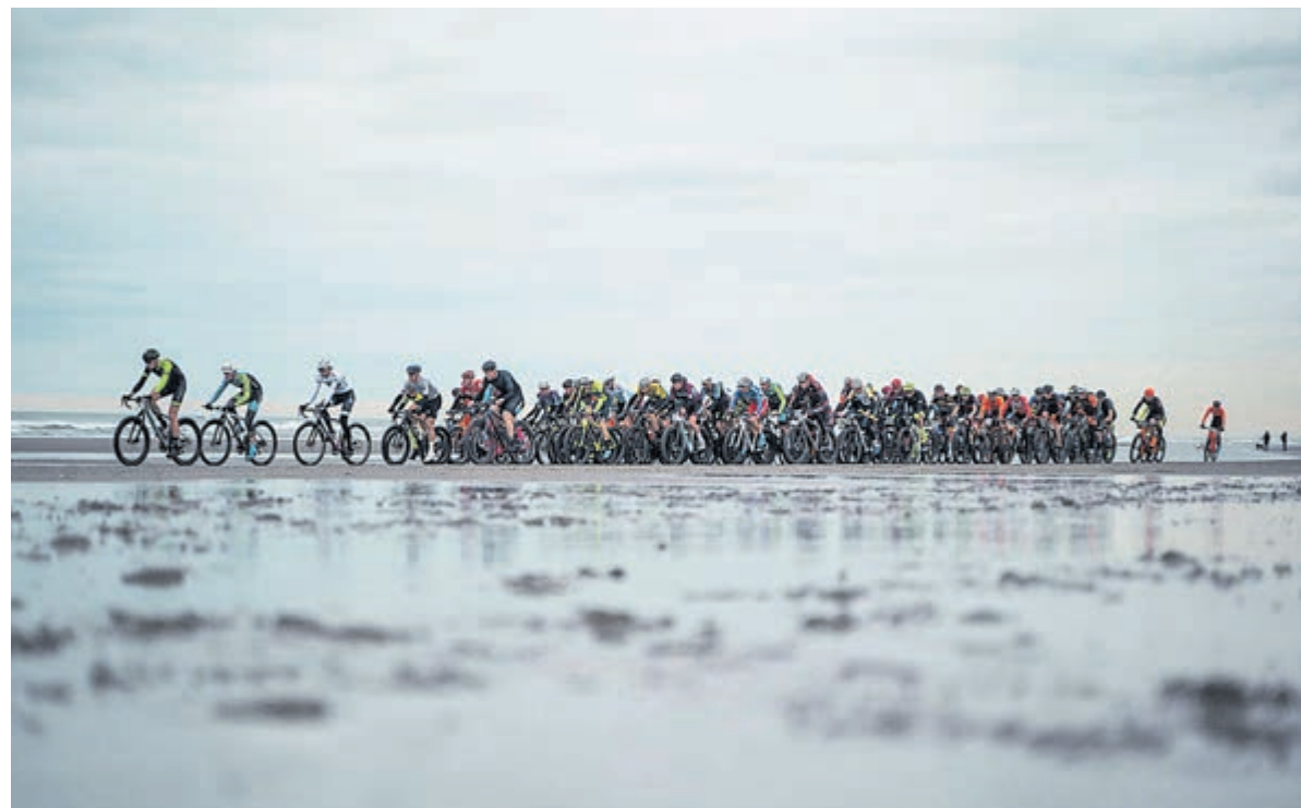
De wielersklassieker Egmond-Pier-Egmond vindt plaats op zaterdag 13 januari 2024.

Regio - In januari komen duizenden liefhebbers van strandfietsen, hardlopen en wandelen naar Egmond aan Zee. Het nieuwe sportjaar begint op zaterdag 13 januari met de strandrace GP Groot Egmond-Pier Egmond. Een dag later, op zondag 14 januari, staat de hardloopklassieker NN Egmond Halve Marathon op de agenda. In het laatste weekend van januari begint het nieuwe wandelseizoen met de Egmond Wandel Marathon. Iedereen die 2024 sportief wil starten, kan zich nu alvast inschrijven voor deelname.