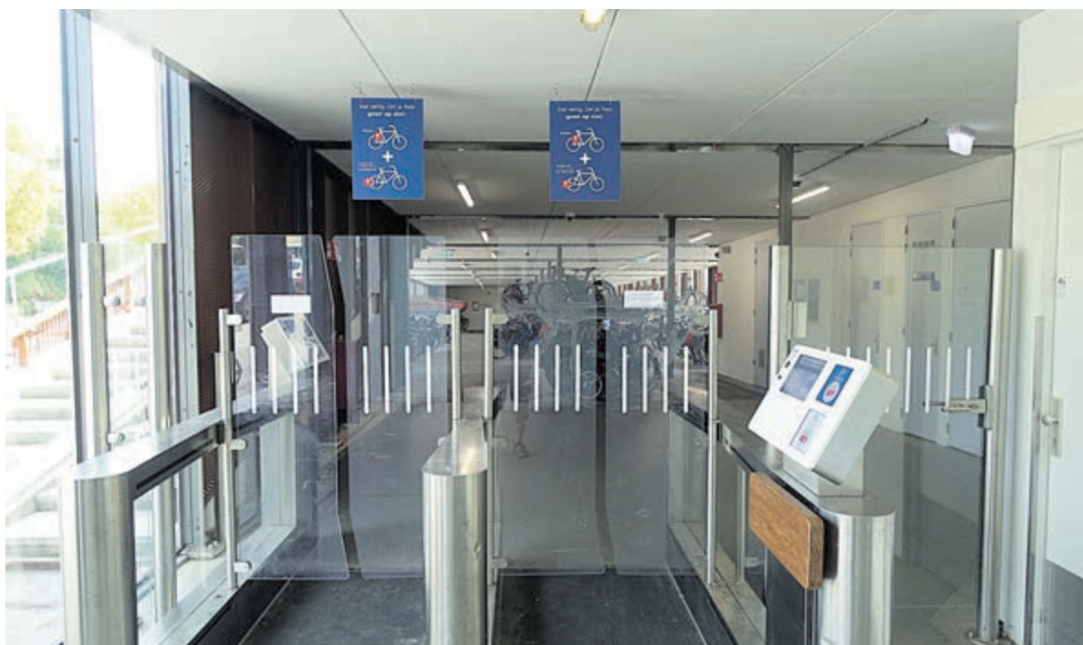
De entree van de 'bewaakte' stalling bij het station.