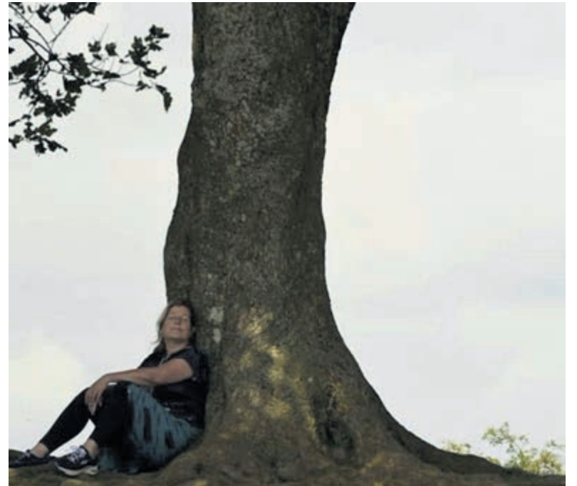
Bosbaden brengt je in een kalme natuurlijke staat van zijn.

Oproep Herkent u zichzelf in bovenstaande? Wilt u aandacht besteden aan het verbeteren van uw kracht en balans, om sterk en gezond te blijven en lang thuis te kunnen blijven wonen? Neem dan contact op met Reva Centre. Of kent u zelfstandig wonende ouderen, bij wie sprake is van een valrisico? Maak hen dan attent op deze leerzame cursus. Deze oproep geldt zowel voor familieleden als huisartsen, thuiszorgmedewerkers, vrijwilligers en mantelzorgers.