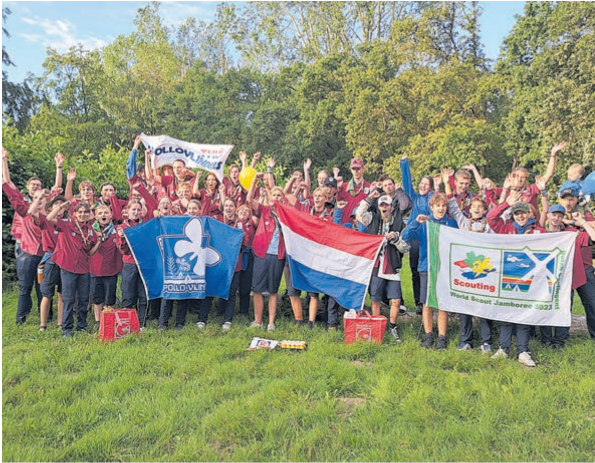
Zaterdagochtend zijn de scouts feestelijk onthaald met een ontbijtje.