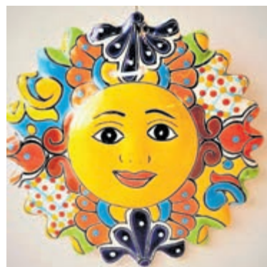
Deze goudgele zon van keramiek fleurt huis en tuin mooi op.

De schildertechniek is door de Spanjaarden naar Mexico gebracht en daar verder ontwikkeld, waarbij de kleurrijke Mexicaanse invloeden voelbaar zijn. Het keramiek is op 1200 graden gebakken en dus geschikt voor zowel in huis als in de tuin (wel met vorst even binnenhalen). Wereldwinkel