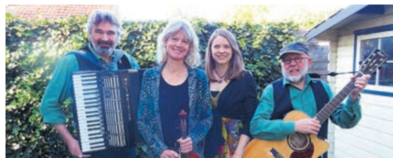
De muziekgroep Unicorn.

Het Oer-IJ is verdwenen, maar de rivier heeft zijn sporen nagelaten en is in het landschap nog alom aanwezig. Het was voor Lia een missie anderen daar op te wijzen. Haar kennis te delen. Bij voorkeur op de fiets en onderweg steeds maar weer stoppend om met oude kaarten in de hand en brede armgebaren te wijzen op specifieke kenmerken van de omgeving; een subtiel hoogteverschil, een geleidelijke glooiing, een kronkelende kreek.