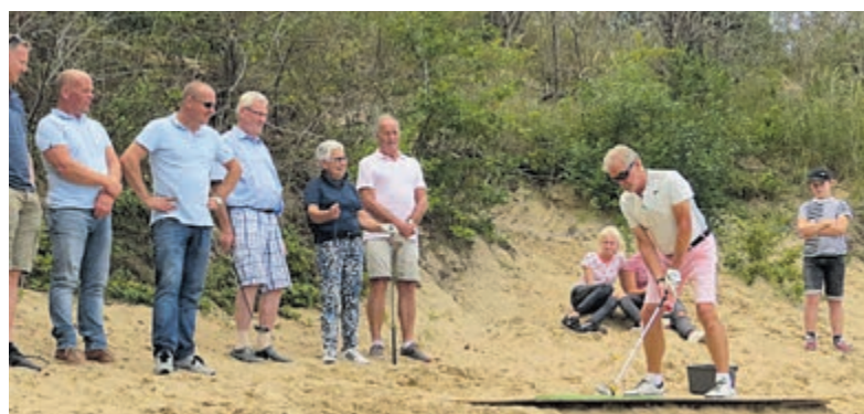
Ook dit jaar zal de afslag vanaf de Papeenberg niet ontbreken.

Castricum - Zaterdag zal op de velden van Vitesse '22 voor de dertiende maal het Puikman open golftoernooi worden gespeeld. Na twee jaar afwezigheid is het evenement weer terug op de kalender. Tijdens de jaarlijks door Vitesse georganiseerde veiling hebben de spelers van wat vroeger het roemruchte derde seniorenteam was tien kavels ter beschikking gesteld aan de hoogste bidders. Allen