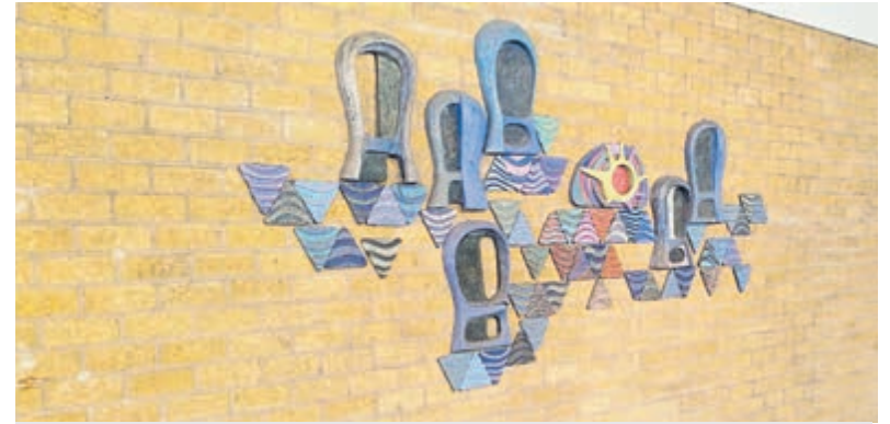
De wandkeramiek in 1969.