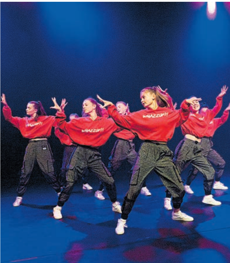
Selectieteam Whazzup?! sleept bij danscompetities regelmatig een prijs in de wacht.

Castricum - clubMariz is hét adres voor dansen! Een eigentijdse dansschool en feestlocatie waar jong tot oud zich wekelijks uitleeft. Alle lessen worden verzorgd in echte danszalen door professionele gediplomeerde of intern opgeleide dansleraren.