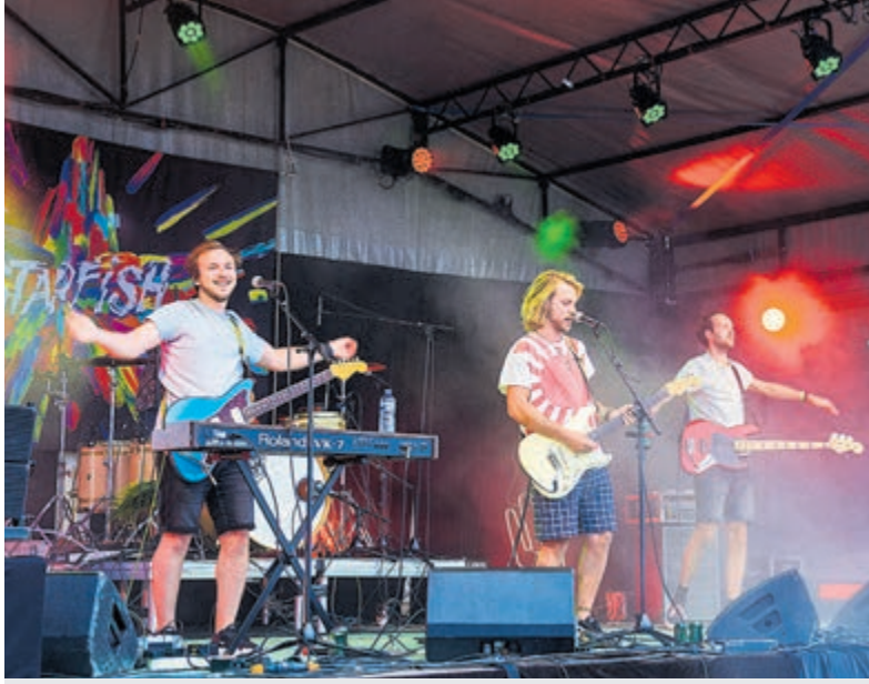
De band Starfish tijdens een optreden.