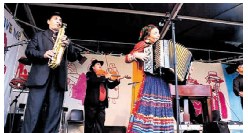
De Transylvania Gypsy Band.

Voor meer info of inschrijven: kijk op www.clubmariz.nl , stuur een e-mail naar info@clubmariz.nl of bel: 06 53192461.