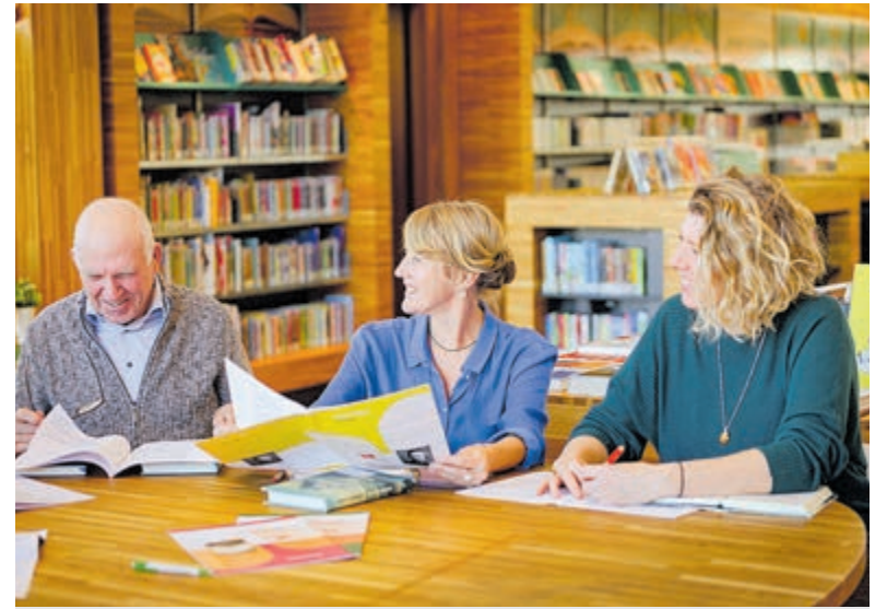
Deelname aan een leesclub van Senia zorgt ervoor dat je anders naar een boek gaat kijken.

leid op de vleugel door Sander Sittig, werken van Brahms, Debussy en Tsjajkovski. Na de pauze is het de beurt aan pianist Antoine Pr at uit Frankrijk met werken van Haydn, Schubert en Ravel. Kaarten à €20,- zijn te bestellen via www.ihms.nl maar zijn ook verkrijgbaar aan de zaal. Er is een pinapparaat beschikbaar.