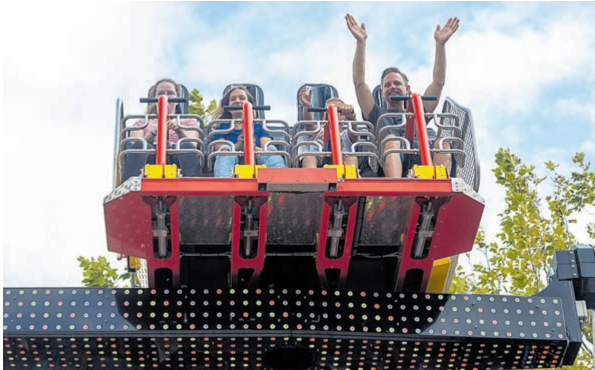
Voor een ritje in de Fireball kan een sterke maag geen kwaad.

Was het vorig jaar nog rustig op de kermis omdat de mussen van het dak vielen, dit jaar was het ideaal weer. Alle dagen droog en niet te warm. Het was te merken aan het aantal bezoekers. De redactie maakte afgelopen zondag een rondje op de kermis.