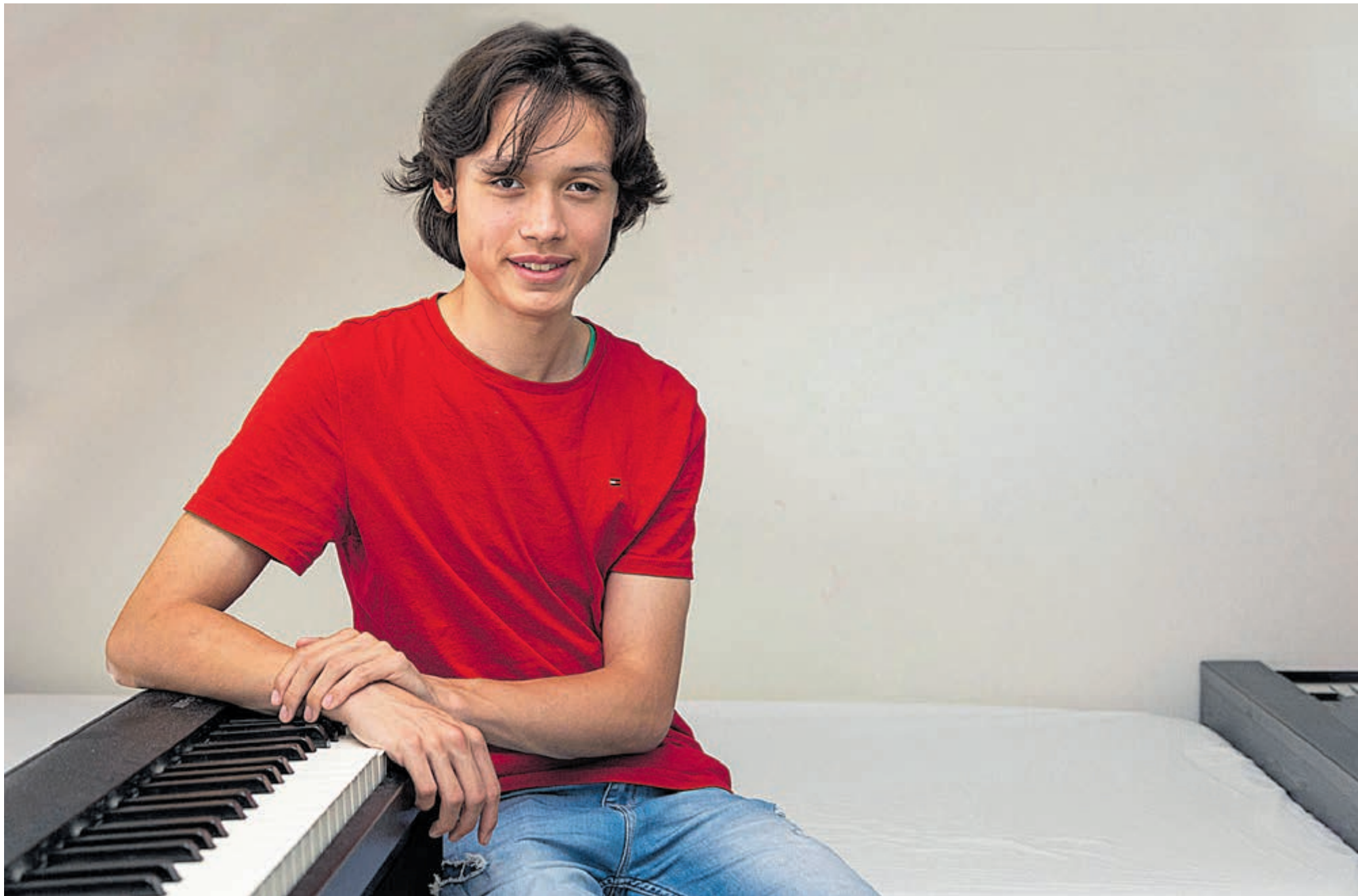
Voor sonates van Franz Liszt lijkt Benjamin zijn hand niet om te draaien.