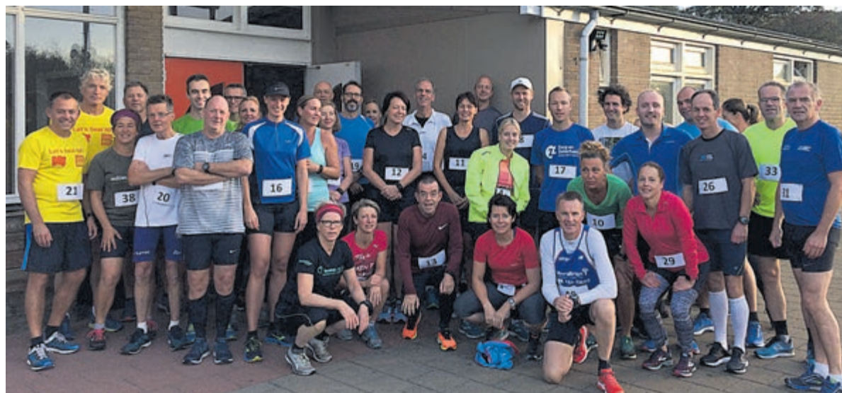
Deelnemers aan de Egmondstage trainen als groep voor deelname aan de halve marathon.

Voor de statistieken kan ik melden dat elke club de beker minimaal twee keer heeft gewonnen met Vitesse als uitschieter naar boven. Dat mag ook natuurlijk als eersteklasser. We gaan het donderdag beleven als Limmen het moet opnemen tegen Vitesse met wellicht de twee kersverse 'overlopers' Mika en Jaap. Wie er wint? Geen idee, als de sportiviteit maar hoog in het vaandel staat. We zien jullie toch weer?