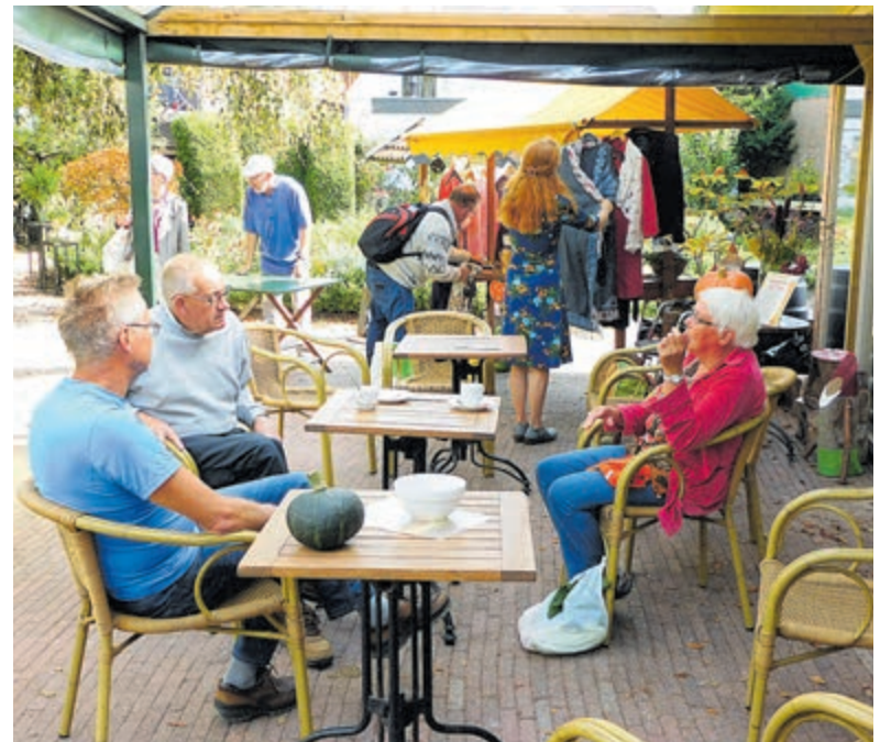
Ook Transitie Castricum neemt deel aan dit initiatief.

Kijk op: www.letsa.nl voor meer informatie. Het K-Lets-café vindt plaats in wijkcentrum De Oever aan de Amstelstraat 1 in Alkmaar.