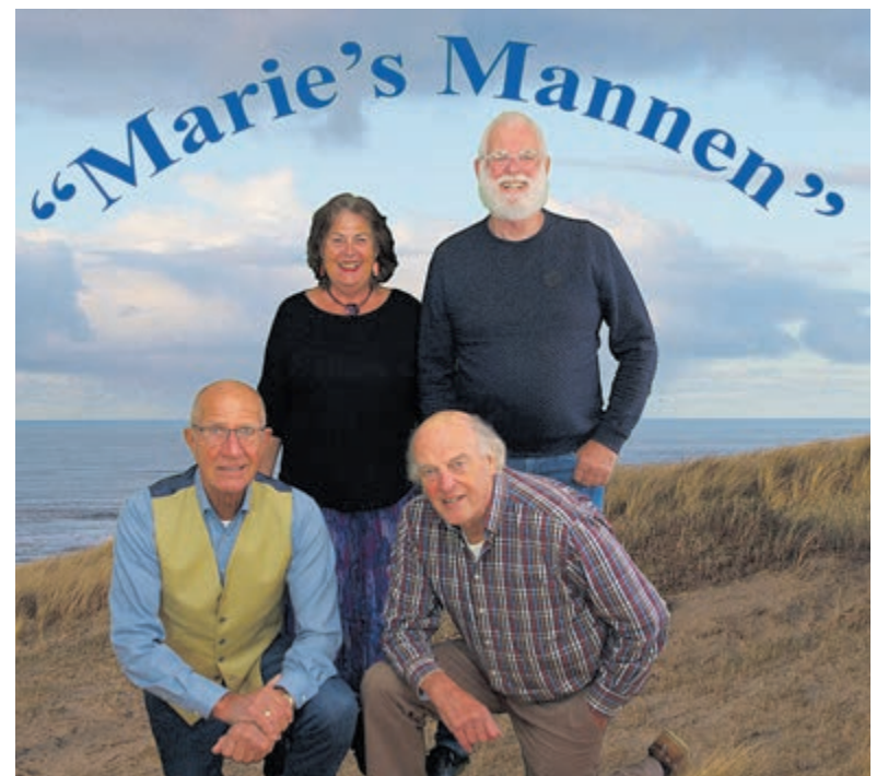
De groep Marie's Mannen.

Reserveer nu kaarten à € 2,50 via www.cultuurkoepelheiloo.nl en kom genieten van deze bijzondere voorstelling op zaterdag 26 augustus om 20.15 uur.