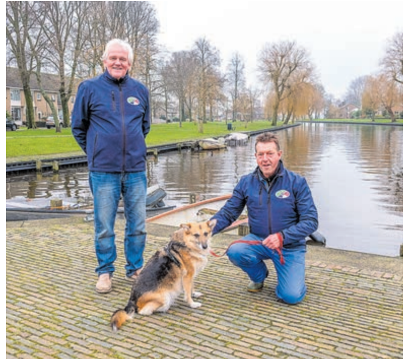
De havenmeesters heten iedereen van harte welkom bij het jubileumfeest van Watersportvereniging Limmen.

dit als zeer prettig. Als aanvangsniveau gaan we er vanuit dat de deelnemers in ongeveer 1 uur zo'n 10 kilometer kunnen lopen. In ruim vier maanden wordt dit uitgebreid, zodat je begin januari in staat bent om de halve marathon te volbrengen. Door de goede voorbereiding en geleidelijke opbouw qua trainingskilometers voorkom je blessures. De groep bestaat uit enthousiaste hardlopers die bijna allemaal meedoen aan de Egmond Halve Marathon. Je loopt met andere lopers die ook jouw tempo lopen. Tijdens de stage krijg je advies over voeding en kleding, leer je veel over looptechniek en krijg je veel looptips zodat je wedstrijden van 10 tot ruim 21 kilometer goed en ontspannen kunt lopen.”