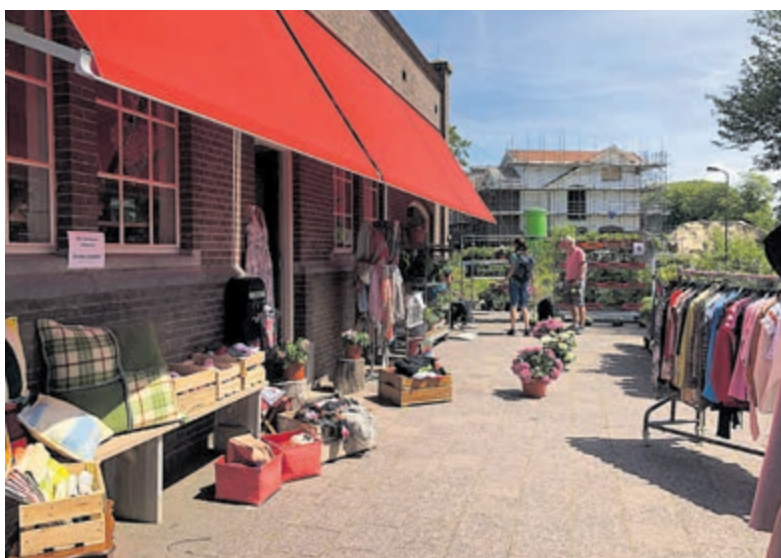
Kom lekker struinen op 25 augustus van 13.00 tot 15.30 uur.

Castricum - Op woensdag 25 augustus organiseert Reakt een zomermarkt met handgemaakte producten. Bij Reakt (onderdeel van Parnassia) gaat men ervan uit dat iedereen stappen kan zetten, door samen te kijken waar talenten en mogelijkheden liggen. Juist daarmee wordt op 25 augustus van 13.00 tot 15.30 uur uitgepakt. Tijdens de markt aan het Watertorenpad 6 is een aanbod te vinden van textiel (oude dekens), keramiek, handgeverfde T-shirts, houtwerk, schilderijen, woonaccessoires en natuurlijk ook plantjes en tweedehands kleding.