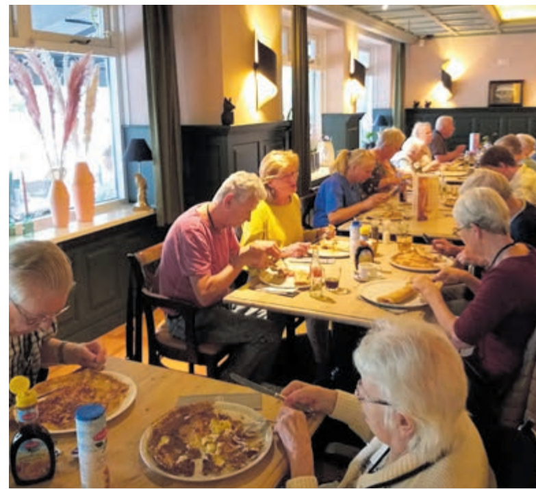
Tien bewoners van De Boogaert genoten vorige week van het uitstapje naar Johanna's Hof.