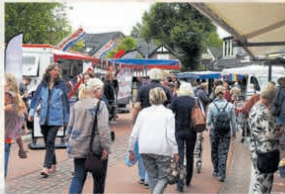
Een indruk van de Castricumse markt in zomertijd. Foto en tekst: Aart Tóth

Vakantie of niet, de markt vergeet je niet