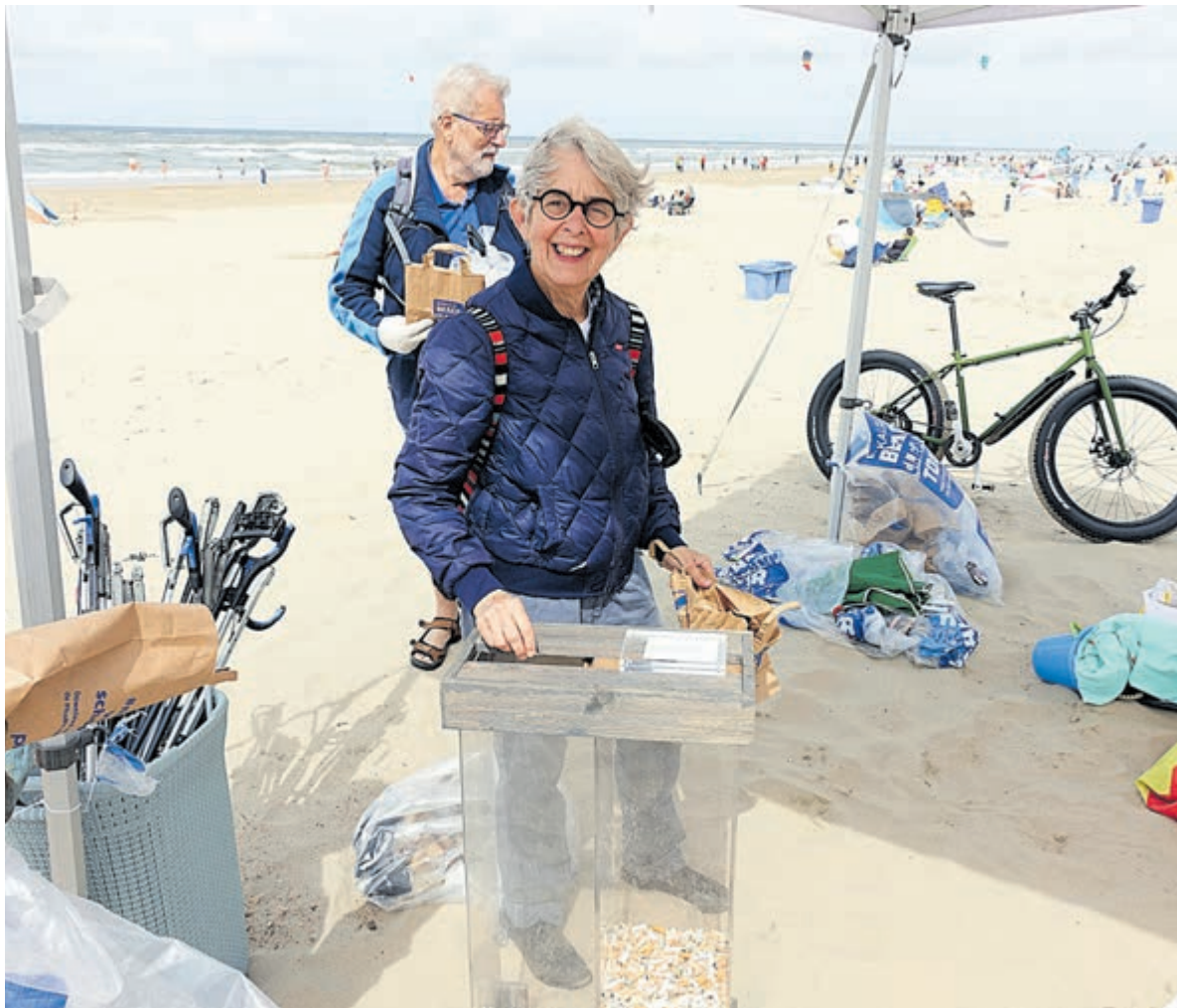
De bak met sigarettenpeuken wordt weer bijgevuld. Aan het eind van de dag werden er ruim 2700 geteld.