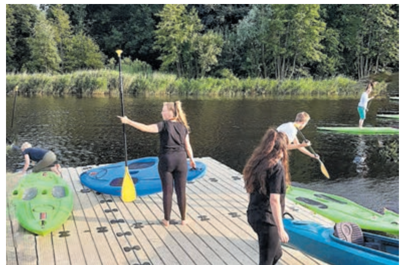
Eén van de buitenactiviteiten van Join us: een middagje kanoën op het Maalwater in Heiloo.