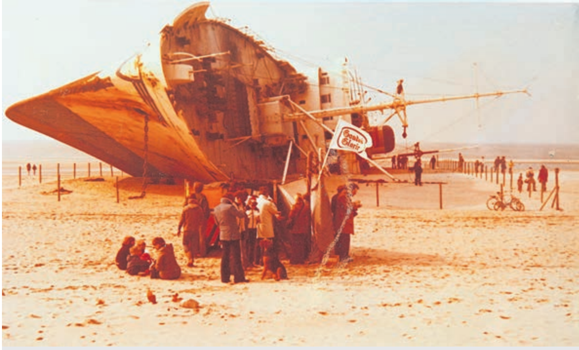
De beginperiode van Vishandel Beentjes, de stranding van vrachtschip Wan Chun in 1972.