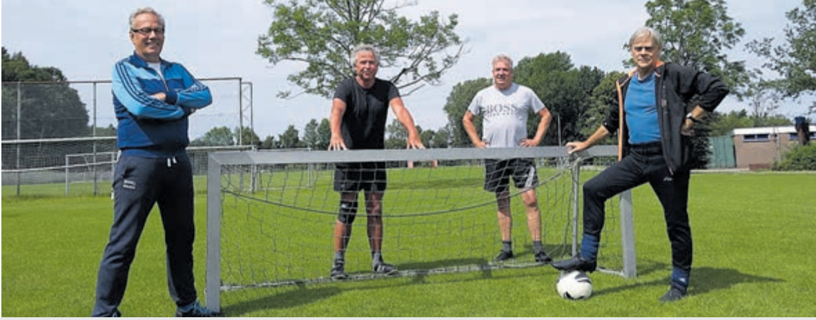
Een deel van de groep senioren die elke week bijeenkomt om te voetballen.