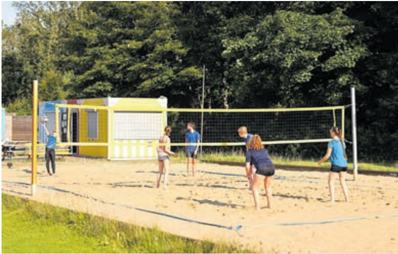
Beachvolleybal op de velden van 2beach.

Castricum - Op vrijdag 20 augustus biedt volleybalvereniging Croonenburg van 10.00 tot 11.30 uur een beachvolleybalclinic aan op de velden bij 2beach aan de Zeeweg, naast het atletiekterrein. De clinic wordt gegeven in samenwerking met de KidsVakantieCocktail. In de clinic leer je op een leuke manier al het begin van beachvolleyballen. Iedereen kan meedoen op het eigen niveau. Je gaat veel bewegen en je doet veel oefeningen met de bal. Het zand is zacht, dus vallen is geen probleem! De clinic is bestemd voor alle kinderen tussen de 6 en 12 jaar. Meedoen? Via voorzitter@croonenburg.nl kunnen belangstellenden zich aanmelden.