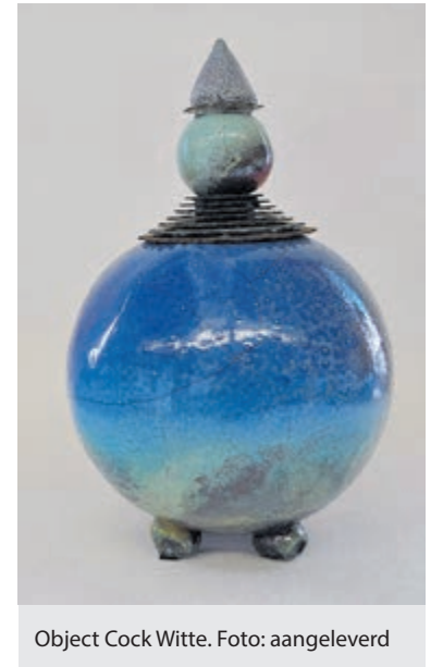
Object Cock Witte.

De SKNH telt nu zestig leden en jaarlijks worden minimaal twee exposities gehouden. De nieuwe gids wordt aan de bezoekers gepresenteerd tijdens deze expositie in Limmen. De openingstijden zijn zowel op zaterdag als zondag van 11.00 tot 17.00 uur en de toegang is gratis. Meer informatie is op www.keramisten-noordholland.nl te vinden.