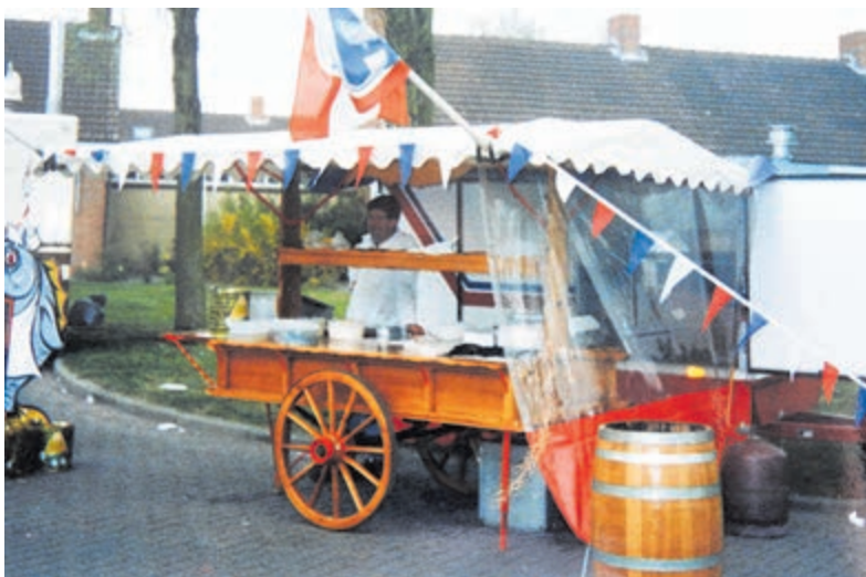
De oudhollandse haringkar, nog steeds in gebruik bij evenementen.