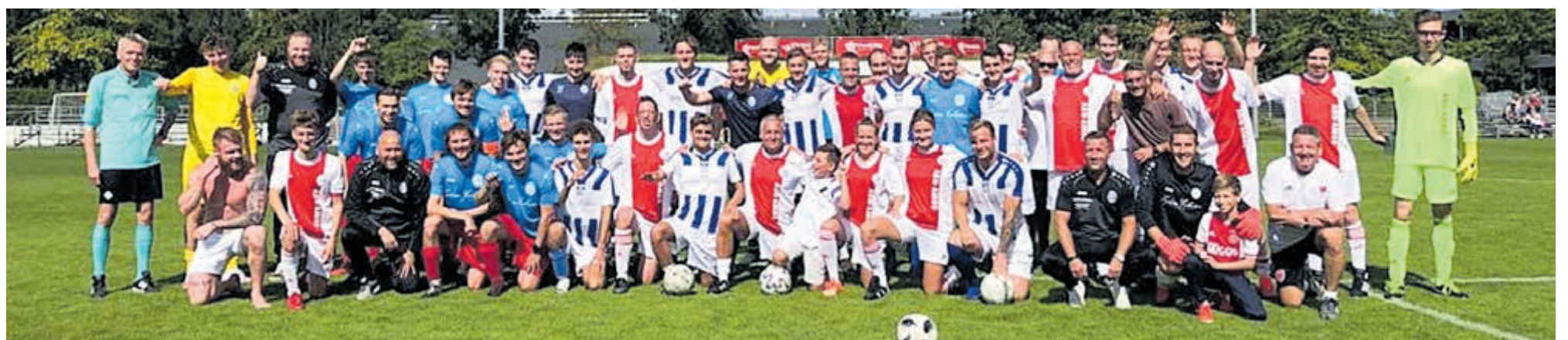
Zowel de spelers als de aanwezige toeschouwers genoten zaterdag van de bijzondere wedstrijd.