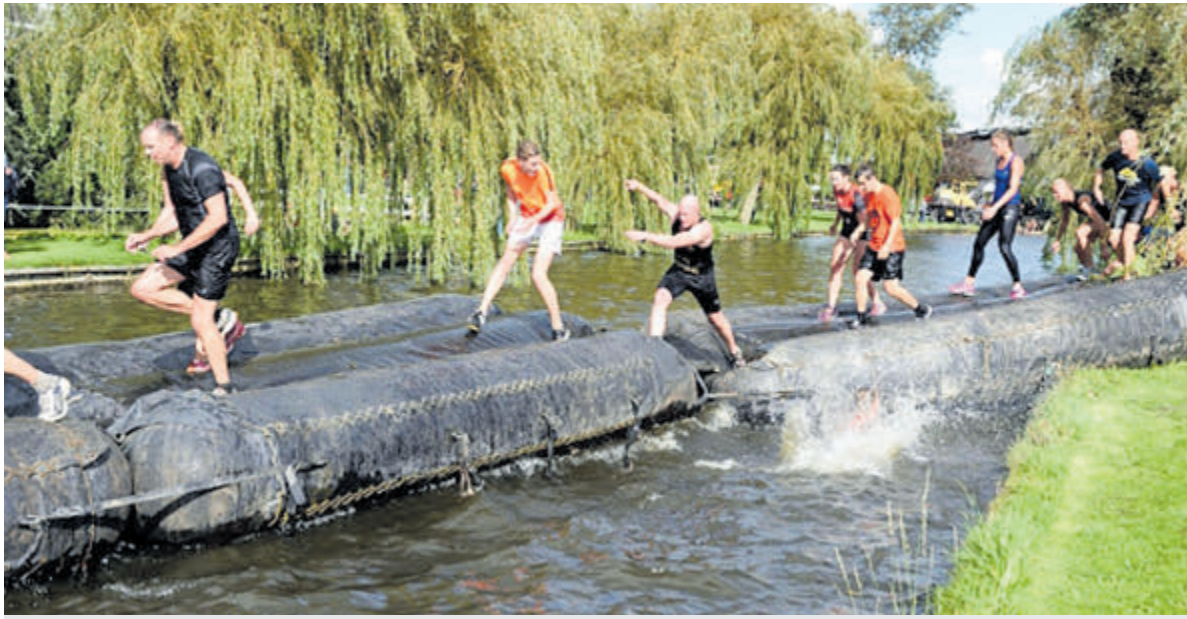
De Limmer Kermisrun zorgt steevast voor hilarische taferelen.