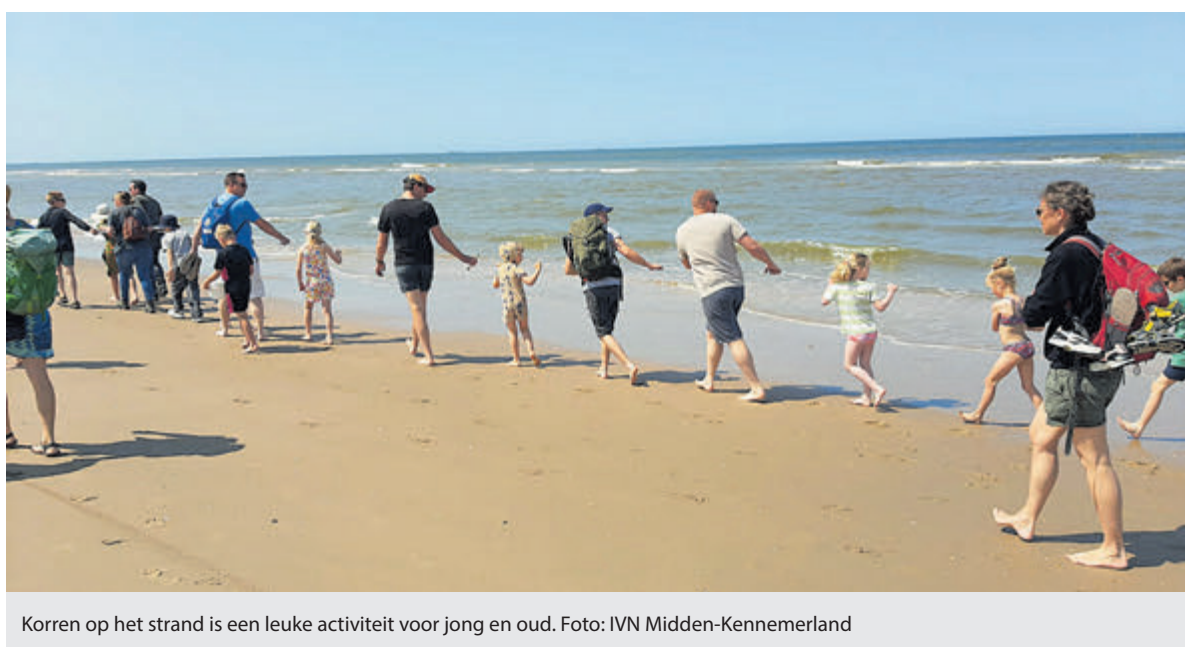
Korren op het strand is een leuke activiteit voor jong en oud.