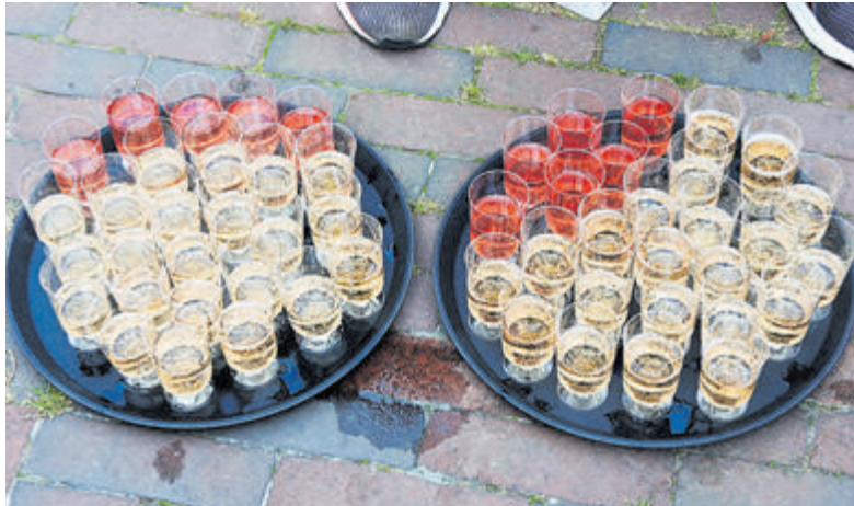
Rosé, wit of rood voorradig, net als bier en fris.

Castricum - Er zit nogal wat werk in het organiseren van een groot evenement als het Castricum's Smaakmakers Festival. Op 2 en 3 september bruist het dorpshart van Castricum weer volop, net als in 2022. Alle artiesten zijn besproken – met enige verrassingen – de horeca is geregeld en ook de aanvullingen met foodtrucks, poffertjes, suikerspin, et cetera is voor elkaar.