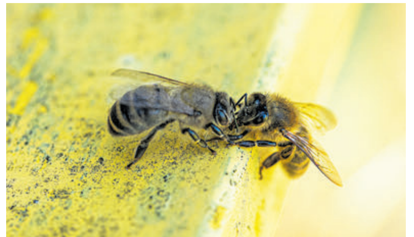
Een bijzonder tafereel: de 'haalbij' (rechts) geeft de nectar over aan een 'huisbij'.