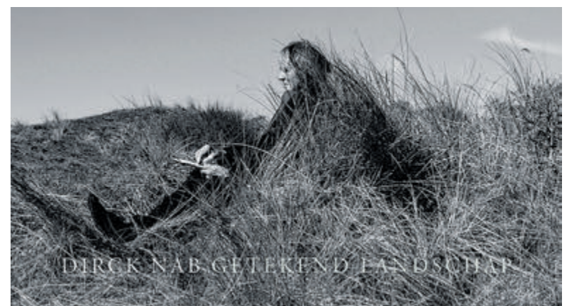
'Getekend landschap'.

Twijfel je of je in 2022 recht had op toeslagen? Of lukt het aanvragen niet? Kijk op toeslagen.nl/hulp voor de hulp die bij jou past. Je vindt hier ook welke persoonlijke hulp er bij jou in de buurt is.