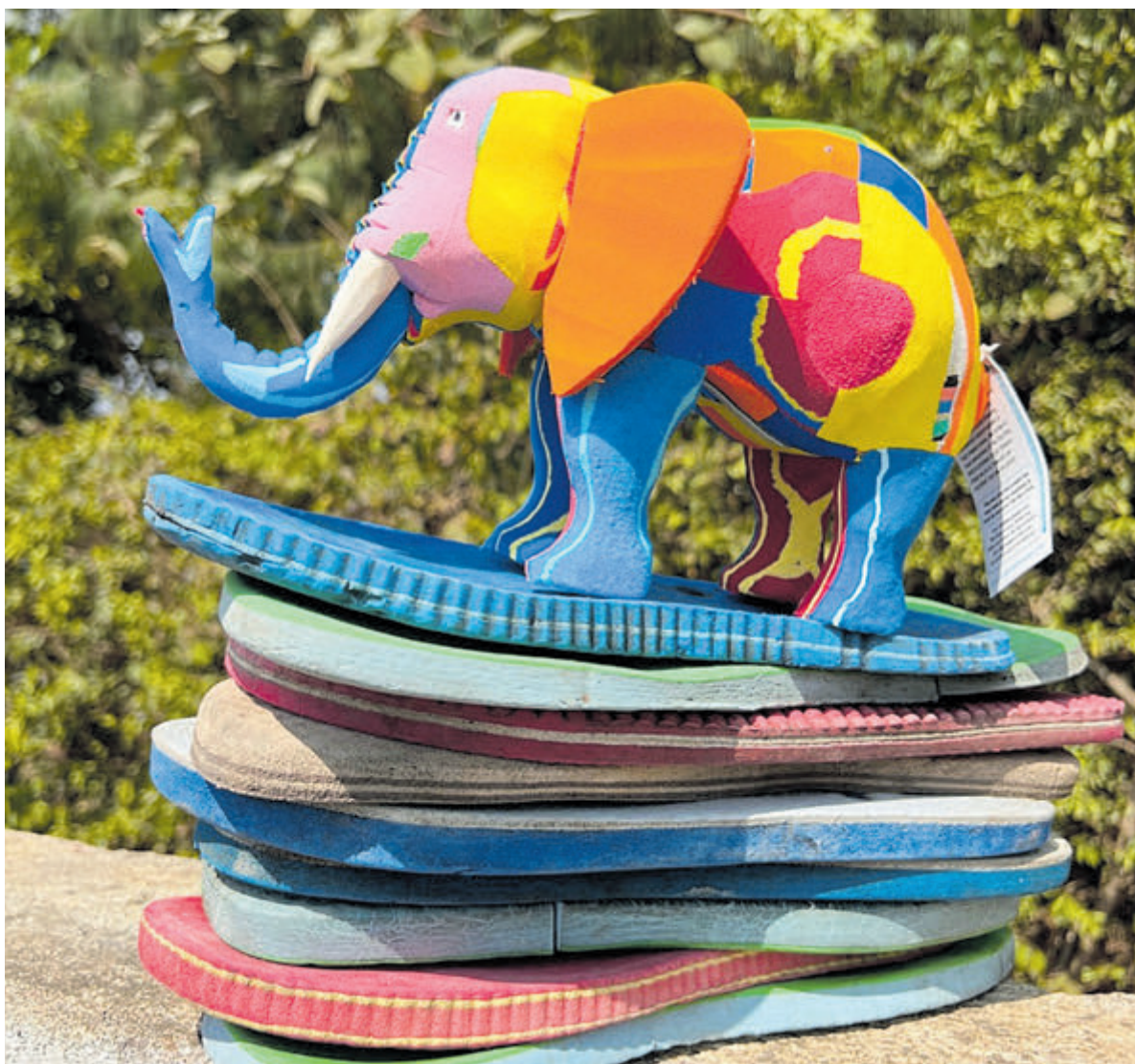
20% korting op alle producten van Ocean Sole tot en met 2 september.

uit dat de tweede editie van dit evenement net zo'n groot succes gaat worden als in 2022, ondanks een iets andere indeling. Natuurlijk zullen de weersomstandigheden bepalend zijn om er een succes van te maken, waar de organisatie in ieder geval van droog weer uitgaat. Wat betreft de uitbaters van drankjes en hapjes moesten er zelfs teleurstellingen verwerkt worden vanwege overaanbod. Daarbij natuurlijk de horeca vanuit Castricum zelf, zoals Annapurna met heerlijke Nepalese hapjes, Het Eethuysje, restaurant Carter en Tasca, clubMariz en Pasta Prima. Bij het dansen en hossen moet natuurlijk de dorst gelest worden, hetgeen uitstekend kan gebeuren bij de vele biertaps van verschillende merken, wijnbars en natuurlijk frisdrank. Wat alleen nog rest is om zaterdag 2 en zondag 3 september met stip te noteren in de agenda of kalender en de familie mee te nemen.