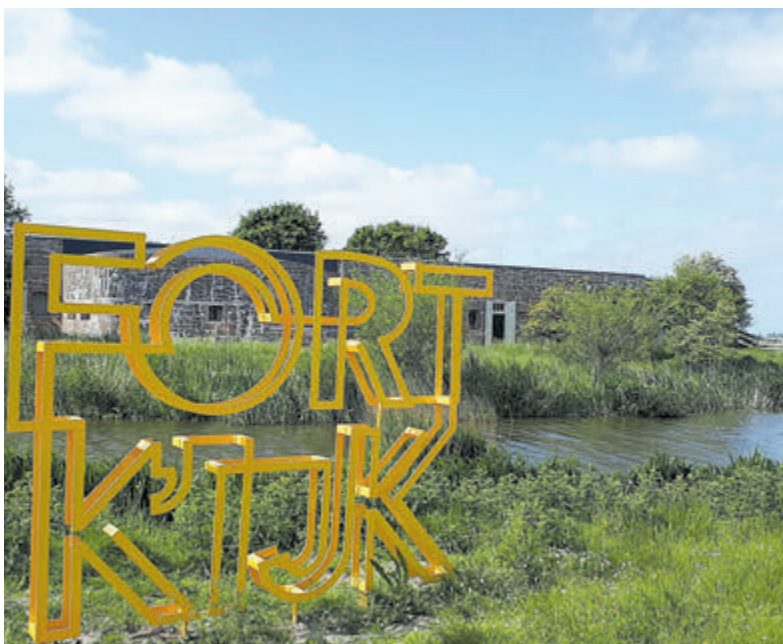
Het logo van het Fort bij Krommeniedijk.

Ga naar www.gaatumee.nl voor overige informatie en om te reserveren.