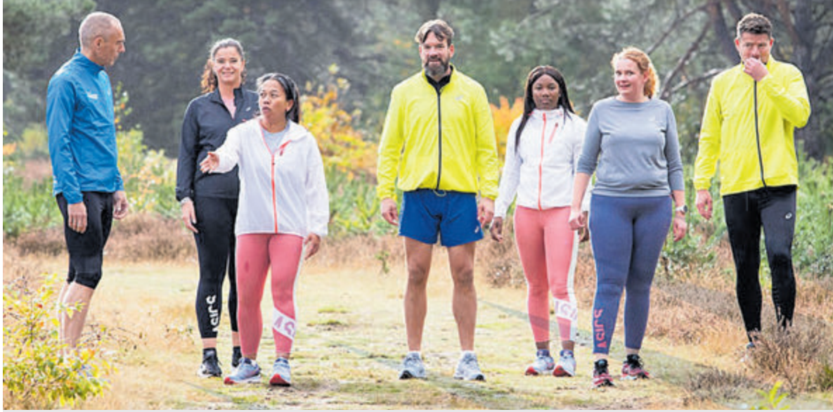
De deelnemers waarderen het dat ze niet alleen starten met hardlopen, maar samen met een groep beginnen met deze eerste stap.