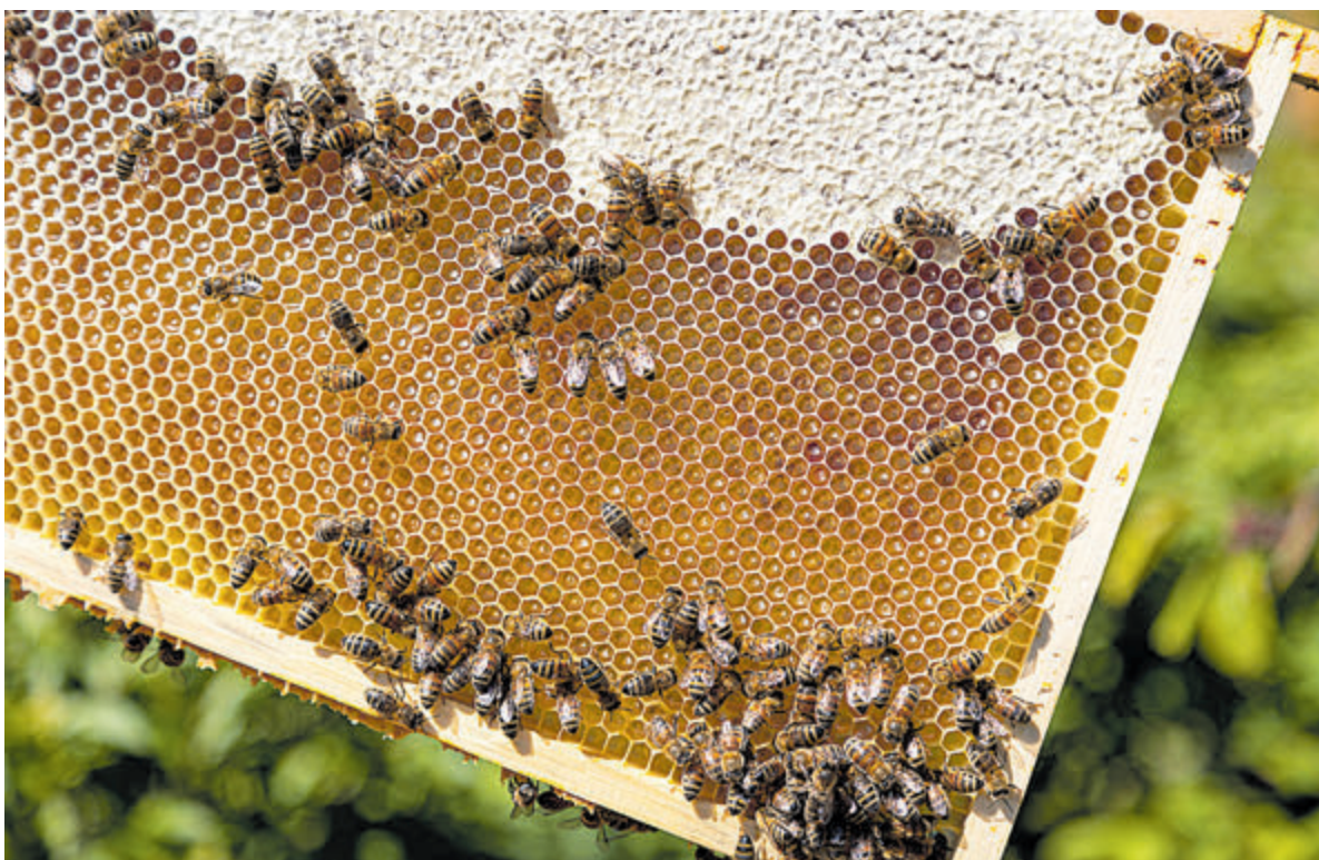
Een honingraam van dichtbij. De zeshoekige cellen zijn met uiterste precisie door de bijen aangelegd. Het grijze gebied is rijpe honing die is afgedekt met een laagje bijenwas.

Kent u ook iemand met een bijzondere hobby, beroep of een bijzonder verhaal, laat het de redactie weten via redactie@castricummer.nl .