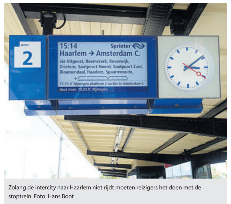
Zolang de intercity naar Haarlem niet rijdt moeten reizigers het doen met de stoptrein.

Omdat de fractie van Lokaal Vitaal zich zorgen maakt over de slechtere treinverbinding en de mogelijke gevolgen daarvan, worden de volgende vragen aan het college voorgelegd: 1. Bent u het met ons eens dat de spits-intercity van belang is voor onze gemeente? 2. Bent u bereid zich in te zetten voor het behoud van deze verbinding? 3. Bent u bereid om gezamenlijk met andere wethouders, waaronder wethouder Dorenbos uit Beverwijk, op te trekken om de NS op andere gedachten te brengen?