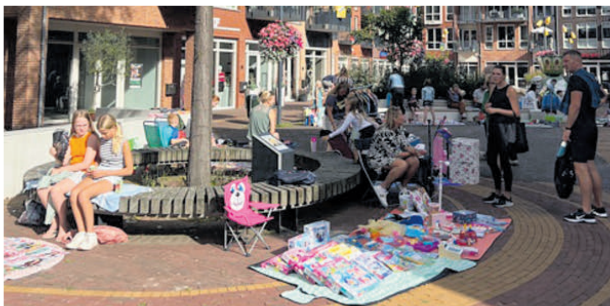
De kledjesmarkt vorig jaar.

verloren geld snel terug te verdienen. Als dat op tijd lukt, kan de vakantie toch nog doorgaan! Ondertussen komen Luan en Lucilla er dankzij een heel speciaal koffertje en de Bellinga Vakantie Bucketlist achter dat je eigenlijk helemaal geen luxe nodig hebt voor een superleuke zomervakantie.