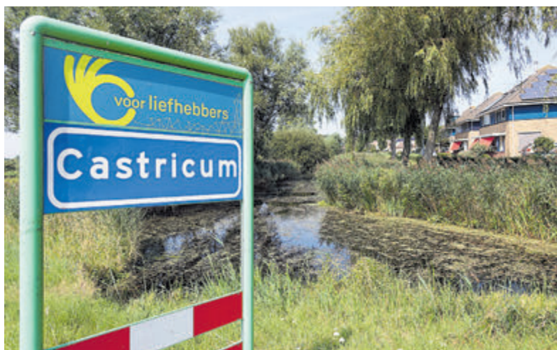
Dit bord bevestigt de hoge score van Castricum op de lijst van beste gemeenten.

Castricum - Elsevier Weekblad en Bureau Louter hebben weer onderzoek gedaan naar de meest en minst aantrekkelijke gemeenten in ons land en de resultaten daarvan gepubliceerd in de Elsevier van 29 juli. Castricum kwam ook dit keer zeer redelijk uit de bus.