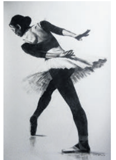
Een kunstwerk van Cor Spil.

zien zijn. De werken worden niet vaak geëxposeerd vanwege het formaat. Restaurant De Oude Keuken is één van de weinige gelegenheden om deze werken aan het publiek te tonen. Nieuwsgierig geworden? Kom dan langs aan de Oude Parklaan 117. Kijk op www.deoudekeuken.net voor de openingstijden en overige informatie.