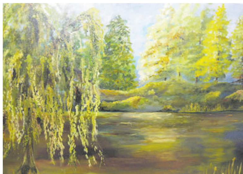
Schilderij van Tiny Blok-Voogel.

Akersloot - Vanaf zondag 6 augustus tot en met zondag 24 september is in Gemaal 1879 aan de Fielkerweg 4 (Klein Dorregeest) werk te zien van Tiny Blok-Voogel uit Bakkum. Zij exposeert onder de noemer 'Natuur in glas en verf' schilderijen in acryl en olieverf, aangevuld met glasfusie-objecten.