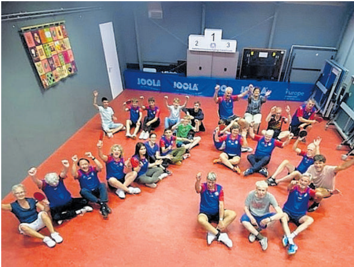
Leden van Tafeltennisvereniging Castricum vormen samen het getal 75 in het clubgebouw aan de Gobatstraat 12a.