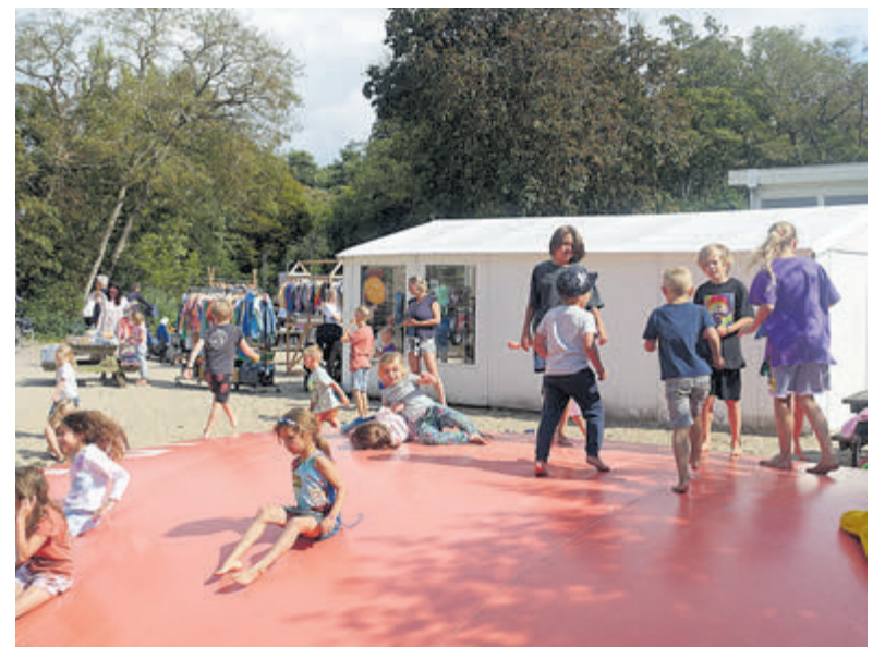
Altijd in beweging op het springkussen.