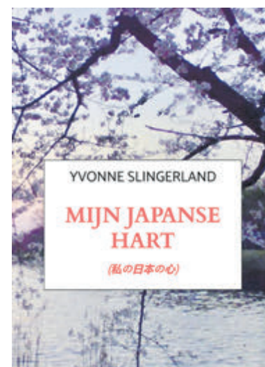
De omslag van het boek 'Mijn Japanse hart'.

ook in het hart van de lezer een plek." Kijk op www.bravenewbooks.nl/yvonnenslingerland voor meer informatie.