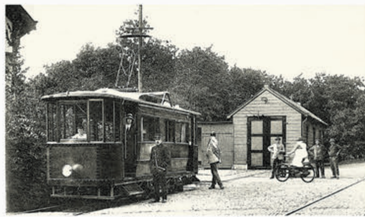
Bakkum, Tram van Duin en Bosch.

Castricum - Op het landgoed Duin en Bosch bevindt zich nog een kavel die bestemd is voor de bouw van een woning. Op het terrein staat echter een vervallen gebouw dat in lang vervlogen tijden dienst deed als tramremise. Waarom deze opstal wel mag worden verplaatst maar niet gesloopt, wordt toegelicht door Ernst Mooij.