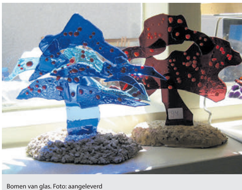
Bomen van glas.

Kijk op www.gemaal1879.nl voor meer informatie.