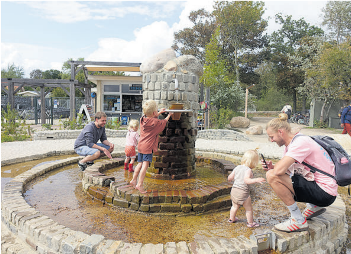
De nieuwe waterspeelplaats.

zien niet iedereen logischerwijs gelijk vakantie viert. Nieuw is ook dat er dit jaar een najaarseditie van is."