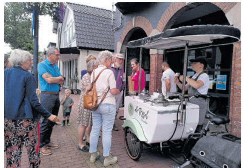
Tot besluit een lekker ijsje van De Roset.

kwamen veel mensen langs om goederen of geld te doneren. Opvallend is dat ook elke maand weer heel veel Douwe Egberts-spaarpunten worden ingeleverd. Dat is mooi, want hierdoor weet men zich verzekerd van de continue levering van koffie voor de klanten van de Voedselbank. De vrijwilligers staan vrijdag van 10.00 tot 12.00 uur weer klaar om uw giften in ontvangst te nemen.