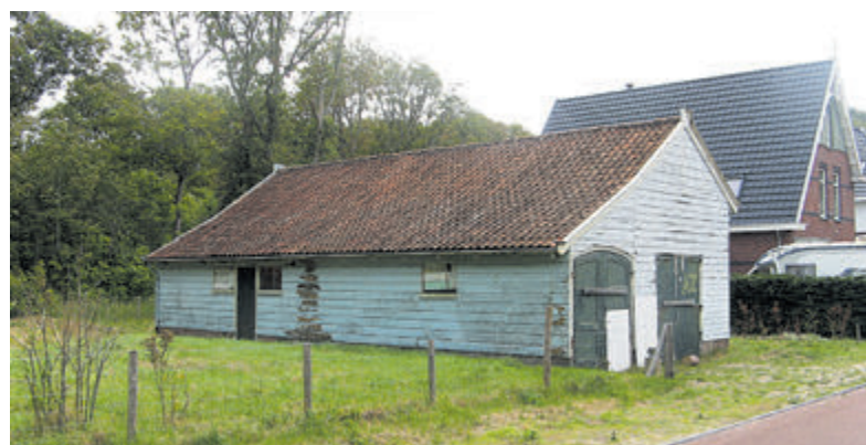
Het huidige remisegebouw.

Wellicht kan de makelaar bij wie de kavel in de verkoop staat wat meer duidelijkheid verschaffen? Desgevraagd laat Adri Hopman weten: „Ik heb de kavel bijna twee jaar geleden verkocht. De eigenaar heeft uiteindelijk een bouwplan ingediend dat ieders goedkeuring had, maar helaas