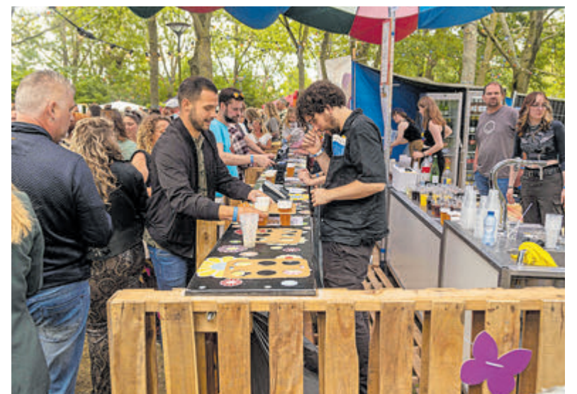
De vrijwilligers achter de bar doen goede zaken.

De band 'De Strobocops' starten hun show iets na drieën met kneiterharde muziek. Ze zingen in het Nederlands. De teksten zijn scherp en grappig en niet van platvloersheid gespeend. Bij sommige toeschouwers zie je wat ongemak. Hoe leg je je meegenomen kind uit waar dit over gaat? Tegen 17.00 uur is het voetje schuifelen, zo druk is het. De foodtrucks doen goede zaken. Mensen staan in een lange rij voor een patatje of grillburger. Er wordt aan lange tafels gegeten en het ziet er gezellig uit. Als het festival om 22.00 uur wordt afgesloten kan de organisatie terugzien op een geslaagde veertiende editie.