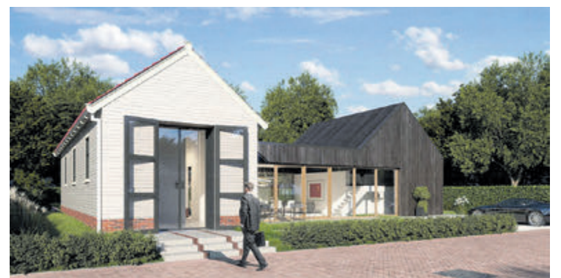
Artist impression van de nieuwe situatie.