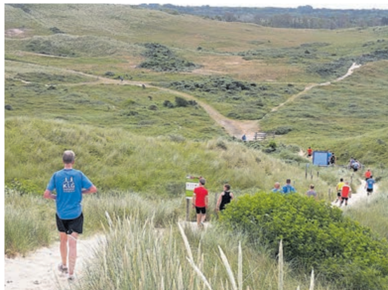
De Kennemer Loopgroep traint in het duingebied bij Heemskerk.

Kom dan meetrainingen bij de Kennemer Loopgroep. Het enthousiasme van de lopers en de trainers werkt erg motiverend! Heb je geen of heel weinig loopervaring en zou je graag willen beginnen met hardlopen? Dan moet je nog even wachten. In het voorjaar van 2022 start weer een beginnersgroep. Daarvoor kun je je natuurlijk ook nu al inschrijven. Bij de Kennemer Loop-