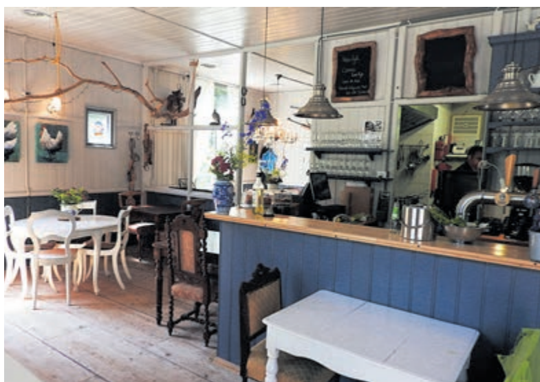
De binnenruimte van het boscafé met volop gezelligheid.

Castricum - We zijn er allemaal al eens geweest, op de fiets of wandelend. We hebben onze ogen uitgekeken naar de bezigheden, liefde en aanhangelijkheid van de vele vrijwilligers die deelnemers, die iets meer aandacht nodig hebben, een thuis bieden. Vrijwilligers zijn dan ook niet weg te denken bij Hof van Kijk-Uit in de Castricumse duinen. Vanaf het NS-station makkelijk te lopen en zeker op de fiets prima te bereiken. Het adres is Oude Schulpweg 4, maar de locatie staat ook aangegeven op de ANWB-paddenstoelen. Maar let op, eenmaal op het terrein word je vriendelijk ontvangen door de extra-speciale deelnemers, die er alles aan gaan doen om het jou naar de zin te maken. Het genieten begint meteen. Op het terras bij mooi weer, of bij iets minder lekker binnen, waar je je hart kunt ophalen aan drankjes, appeltaart en heerlijke gerechten.