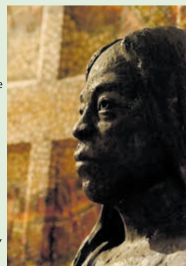
'Ini negara apa? Ze zeiden niets terug, maar bleven rustig op hun eiland.' Fotograaf Cor Boorsma selecteerde een van zijn foto's bij het verhaal van José de Korte. Het portret van klei op de foto is gemaakt door Marion Albers (IMIX)