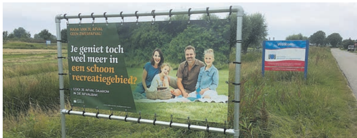
Met een positieve campagne hoopt men de bezoekers bewust te kunnen maken van het zwerfafvalprobleem.