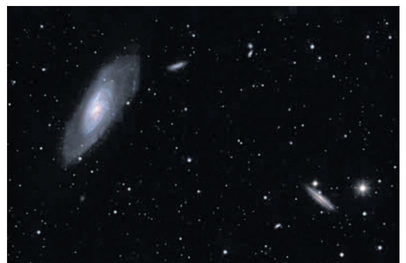
M 106, een spiraalstelsel in het sterrenbeeld 'Jachthonden' (het grootste object op de foto) in beeld gebracht.