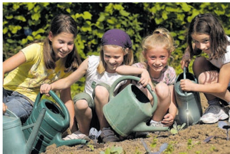
Organiseer je eigen natuurbeleving en meld die aan!

Vorig jaar vonden in coronatijd bijna honderd grotendeels aangepaste feestjes plaats tijdens Fête de la Nature. De hoop bestaat dat er dit jaar meer mogelijk is en dat ook de animo van mensen om een natuurfeest te organiseren groot is. Salomon: „Na zo lang te hebben stilgezeten, moet het bij veel mensen toch wel gaan kriebelen. Laten we er met z'n allen een fantastisch natuurweekend van maken.“ Activiteiten kunnen op www.fetedelanature.nl aangemeld worden.