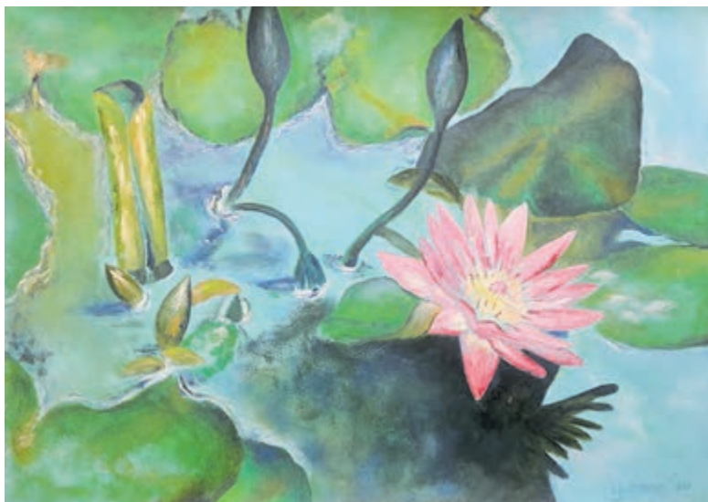
Deze week zijn de kunstschilders elke werkdag in de Tuin van Kapitein Rommel aan het werk.

Castricum - Deze week zetten Afke Spaargaren en haar cursisten hun doeken op de ezel in de Tuin van kapitein Rommel. De schilders zijn van 11.00 tot 16.00 uur in actie te zien. Publiek is van harte uitgenodigd het ontstaan van de impressies op doek te komen bewonderen. Weten deze schilders het zonlicht op de waterlelies net zo mooi te vangen als Claude Monet dat deed?