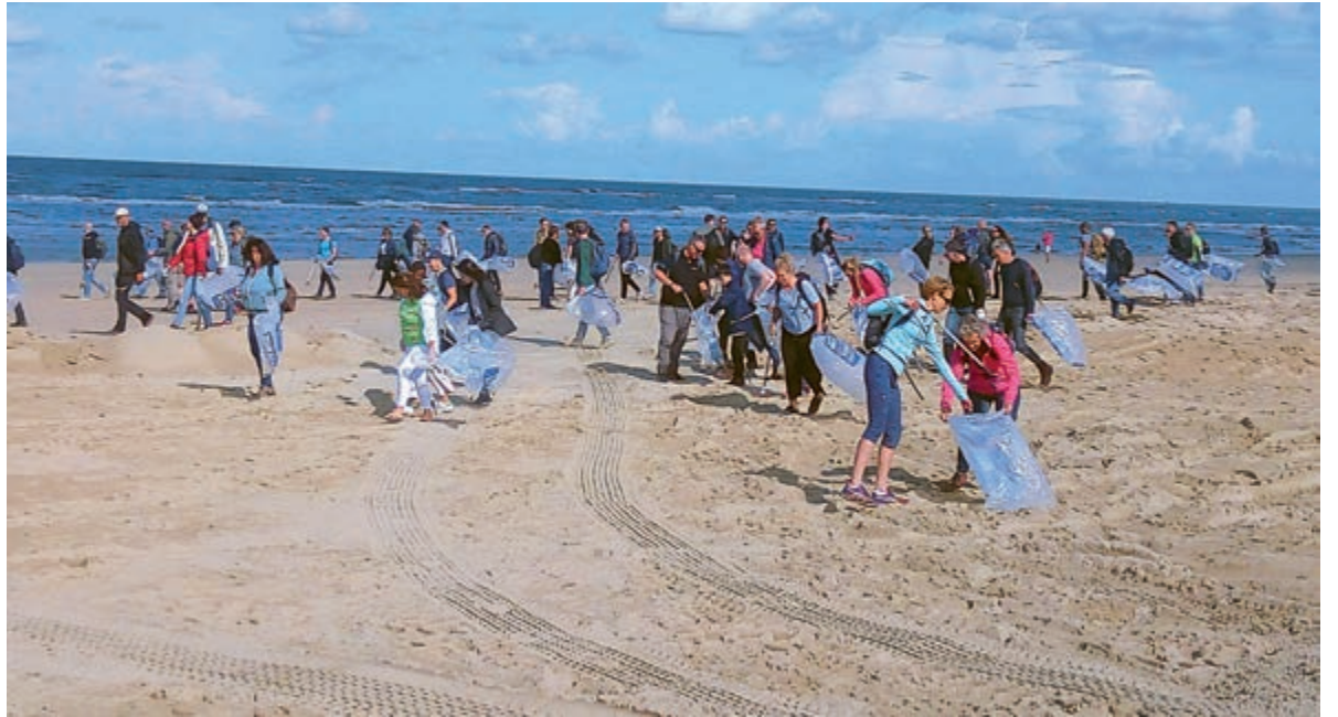
Deelnemers aan een eerdere editie van de Boskalis Beach Cleanup Tour op het strand van Castricum.

De ommezwaai komt niet uit het niets. In 2014 startten Stichting De Noordzee, de Plastic Soup Foundation en Vereniging Kust & Zee de campagne 'Die Ballon Gaat Niet Op'. De focus van die campagne was gericht op het stoppen van groot-schalige ballonoplatingen op Koningsdag, de dag waarop traditioneel veel ballonnen werden opgelaten. De organisaties en veel enthousiaste vrijwilligers riepen Oranjeverenigingen, bedrijven en gemeenten op om met ballonoplatingen te stoppen. De campagne was succesvol: veel gemeenten, scholen, bedrijven en Oranjeverenigingen stopten met het oplaten van ballonnen op Koningsdag. Uiteindelijk besloot ook de Oranjesbond in 2018 om het oplaten van ballonnen op Koningsdag officieel te ontmoedigen. In 2014 werd een motie van de Partij voor de Dieren aangenomen waarin werd opgeroepen om ballonoplatingen te ontmoedigen. De uitvoering hiervan werd door de Tweede Kamer bij de gemeenten neergelegd. De landelijke Ballonnenmonitor is bedoeld om gemeenten aan te sporen deze motie op te volgen.