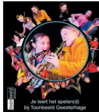
De deelnemende kinderen bespelen op 18 augustus drie of vier verschillende muziekinstrumenten.

Castricum - Op woensdag 18 augustus organiseert Toonbeeld Geesterhage van 14.00 tot 16.00 uur