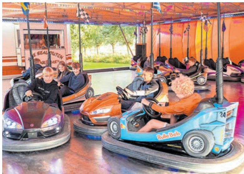
De overdekte attracties deden het goed.