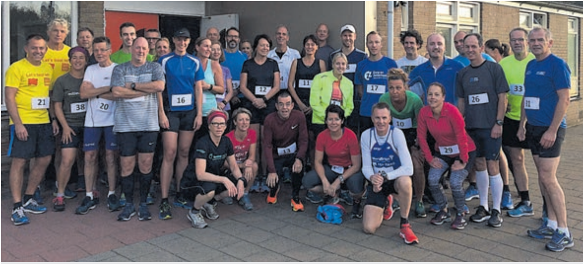
Deelnemers aan de hardlooptrainingen bij Atletiekvereniging Castricum.