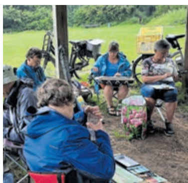
Samen creatief bezig zijn in de buitenlucht.

Castricum - „We mogen weer samen creatief zijn!“ Dat hebben een aantal leden van de vereniging voor beeldende vormgeving Perspectief dan ook letterlijk genomen en met veel plezier uitgevoerd. Met elkaar trokken ze er deze zomermaanden op uit om samen te schilderen, te tekenen, steen te hakken of met hout te werken. Zo ontstonden diverse creatieve zomerweken die de leden van Perspectief met elkaar doorbrachten. Het wisselende weer met de prachtige lichten in diverse