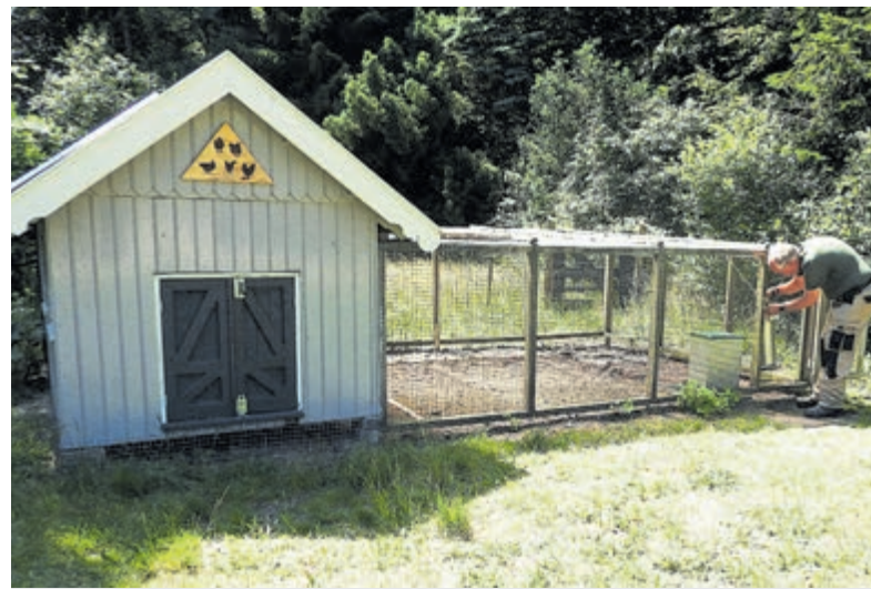
Deelnemer aan het werk bij het kippenhok met aanvullen water en voer.

Bij het horecadeel is professionele ondersteuning in de keuken, waarbij de bediening, als het even kan, in handen van de deelnemers is. Dat gaat subliem. Het boscafé is een en al gezelligheid met een huiselijk karakter. De dagbesteding op de diverse afdelingen van Hof van Kijk-Uit is iedere week van dinsdag tot en met vrijdag. Voor bezoekers is het boscafé met terras van Hof van Kijk-Uit iedere vrijdag en zondag