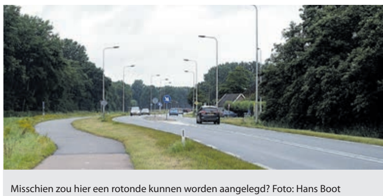
Misschien zou hier een rotonde kunnen worden aangelegd?

Castricum - Een meerderheid van de Castricumse gemeenteraad wil een nieuw onderzoek naar de aanleg van een rotonde op de provinciale weg naar Uitgeest. Deze wens is gericht op veiligheid en de plannen voor een nieuw zwembad.