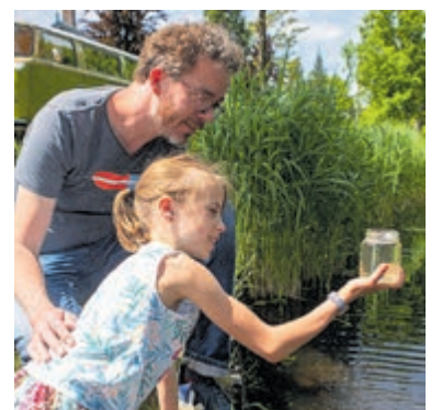
Vraag de meetkit aan en vang de watermonsters!

Met de online meetkit 'Vang de Watermonsters' ga je als burgerwetenschapper verschillende onderdelen meten van het water. Je meet onder andere de helderheid en bekijkt de aanwezigheid van planten en dieren. Je maakt foto's met je mobiel om vast te leggen waar is gemeten en om de