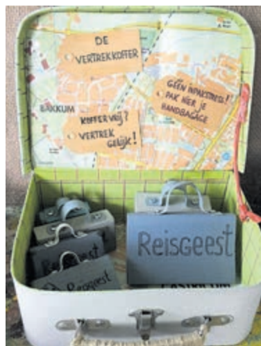
Komende zaterdag is de laatste kans om deze bijzondere reisbeleving te ervaren.

shops is te vinden op IMIXkunst.nl of FB-pagina IMIXkunst.