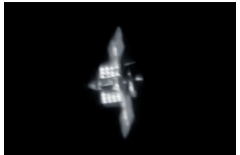
Het ruimtestation ISS op 500 km gefotografeerd.