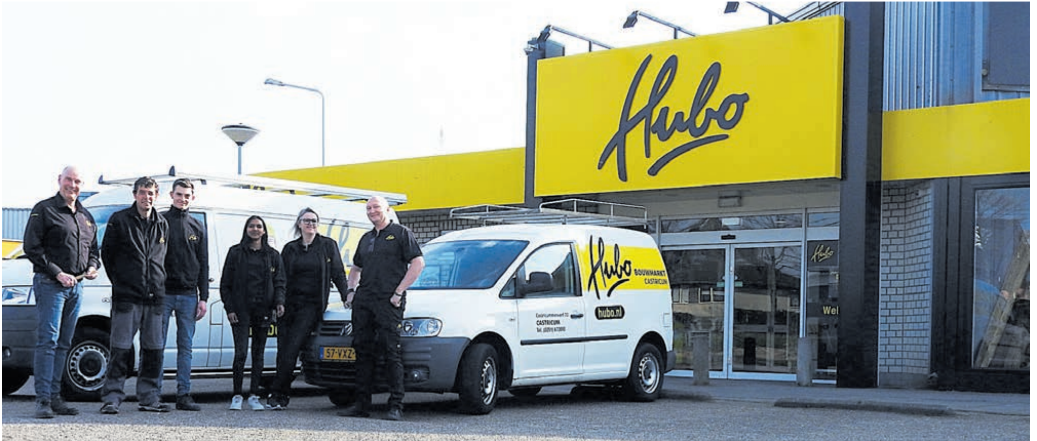
Een deel van het huidige team van Hubo Bouwmarkt Castricum.

In onze serie over familiebedrijven gevestigd in onze gemeente, wederom een aflevering met vier generaties die ruim honderd jaar deel uitmaken van familieondernemingen. Ditmaal de familie Res met een rijke historie tot aan de huidige Hubovestiging aan de Castricummer Werf.