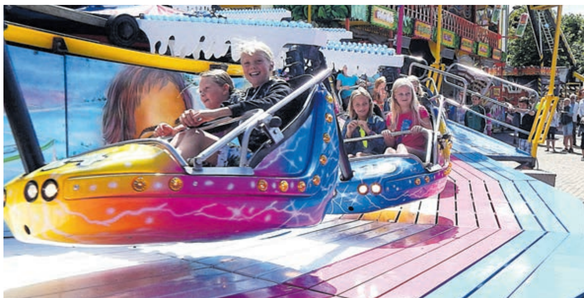
Het is nog de vraag of de kermis in Akersloot dit jaar door kan gaan.

Van de Landelijke Tijdelijke Overbruggingsregeling Zelfstandige Ondernemers (TOZO) maakten in Castricum in de eerste periode 760 zzp'ers gebruik. Daarna zakte dat aantal tot 174 in de tweede ronde om vervolgens te stijgen tot 277 in ronde drie. Voor de vierde termijn, die doorloopt tot oktober, zijn tot op heden 80 aanvragen gedaan. Tijdens de eerste lockdown kwamen de meeste verzoeken. Dit aantal nam tijdens de tweede lockdown af. De belangrijkste reden hiervoor is dat de Rijksregelingen verder uitgebreid werden, met name voor ondernemers.