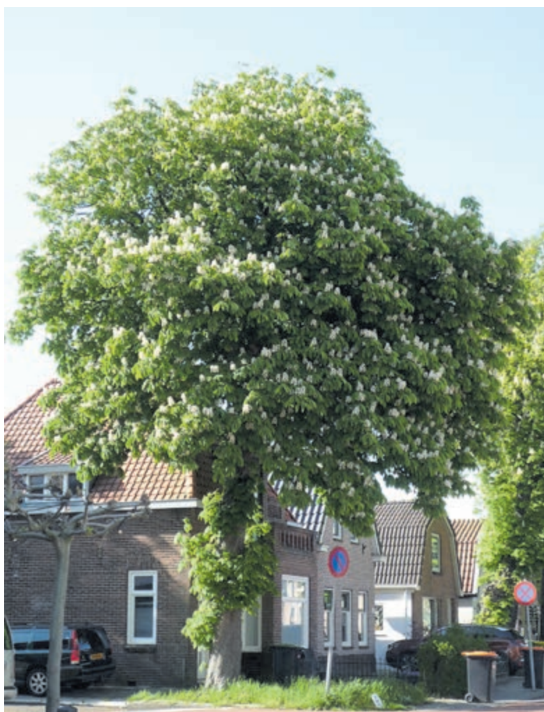
De paardenkastanje aan de Bakkummerstraat.

„We kunnen inmiddels concluderen dat online bieden leidt tot goede verkoopopbrengsten, maar ik zal niet zeggen dat wij hiermee altijd in iedere situatie de allerhoogste opbrengst realiseren. Wij zien het ook breder dan alleen het hoogste bod, het gaat om een combinatie van opbrengst en voorwaarden. Het kan best zijn dat iemand aangeeft dat hij geen financieringsvoorbehoud nodig heeft of al snel kan afnemen en dat dit de verkoper heel goed uitkomt. Het komt ook voor dat een ander dan de hoogste bidder en de verkoper een 'klik' met elkaar hebben en dat het een persoonlijke gunning is. De verkoper bepaalt te allen tijde zelf aan wie de woning wordt verkocht.”