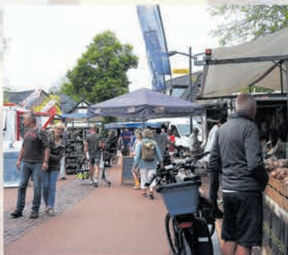
Vakantiegangers volop welkom op de Castricumse weekmarkt.

Castricum - Veel nieuwe gezichten op de wekelijkse vrijdagmarkt. Gezelligheid volop met gasten van de campings Bakkum, Geversduin en de vele boerencampings. Die willen ook kwaliteit voor bij de barbecue of gewoon in de keuken van de camper, caravan of tent. Nou, dan ben je op de markt in Castricum op het goede adres voor zo'n heerlijk gegrild kippetje van de 'Marktkip' of een gebakken visje van 'Vishandel Beentjes', aangevuld met heerlijke aardappeltjes van Karel Jansen.