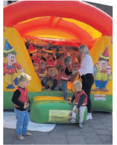
Lekker springen.