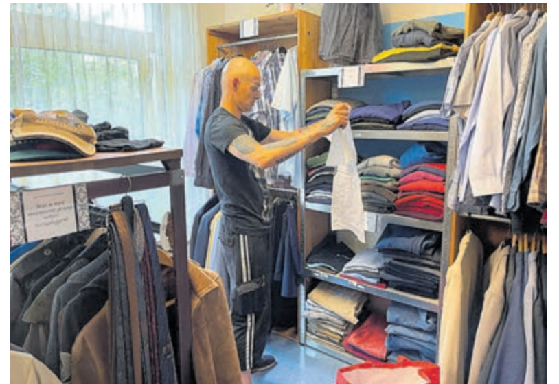
Alles netjes gesorteerd op maat en afdeling: dames-, heren- en kinderkleding.

Ieder kwartaal is er een markt bij de kledingbank waar iedereen mag komen kopen. Dat is bedoeld om wat inkomen te krijgen voor de huur om en andere kosten te kunnen betalen. Ik mag wat kinderkleren voor mijn kleinkinderen kopen. Ook ik ben een blij ei als ik naar huis ga. Kijk op www.kledingbankegmond.nl voor meer info en openingstijden.