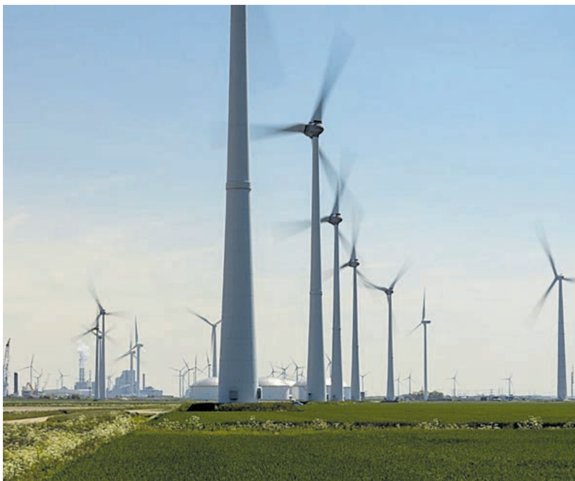
Windmolens bij de Eemshaven in 2021.