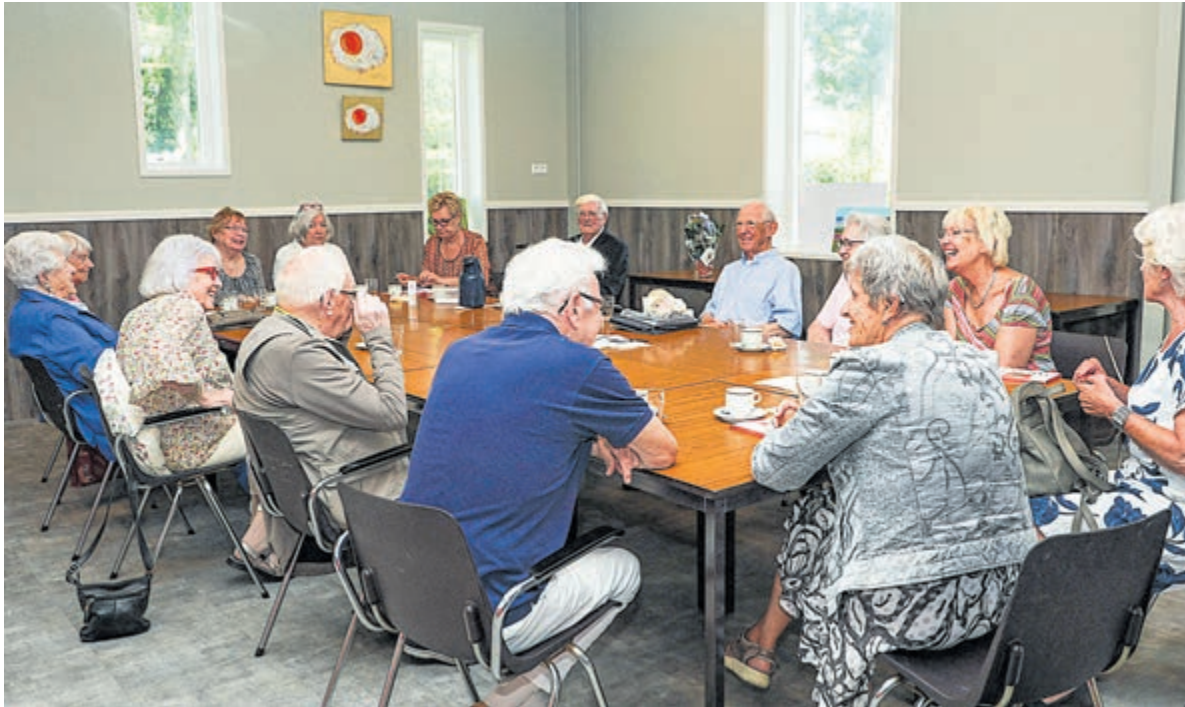
Blijde gezichten in het Biljart- en Buurtcentrum als men elkaar na zestien maanden voor het eerst weer ziet.