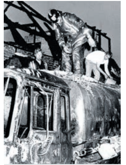
Om te voorkomen dat de resterende benzine vlam vat, wordt via het mangatdeksel ijs ingebracht.

Henks woning en zijn bedrijf zijn geheel in de as gelegd. Hij laat de verslaggever een verschroeide foto zien die later tussen de asresten is