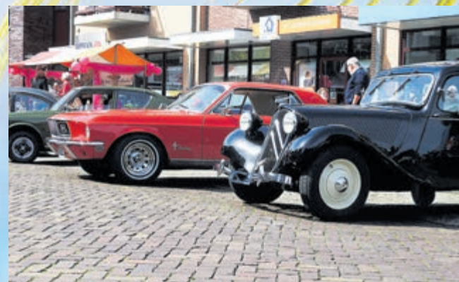
De oldtimershow in de Torenstraat trok in het verleden veel bekijks.

G&W DROGISTERIJ AKER Kerkweg 16 - 1906 AW - Limmen Tel: 072 - 505 3138 drogist@drogisterijaker.nl