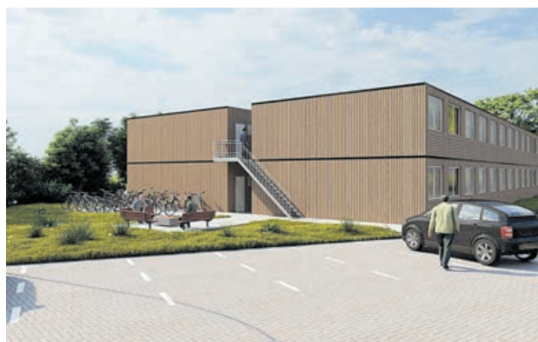
Zo zien de woonunits er bij oplevering ongeveer uit.

Castricum - Overeenkomstig het besluit van de gemeenteraad van 10 juni zijn op het daarvoor aangewezen terrein aan de Puikman voorlopig veertig containers neergezet die worden omgebouwd tot volwaardige flexwoningen. Het wachten is op nog eens acht units en het verlenen van de benodigde vergunning.