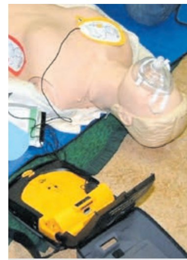
Tijdig reanimeren kan mensenlevens redden.

vergoeden. Kijk op www.ehbocastricum.nl voor alle informatie en een inschrijfformulier. Voor meer informatie of aanmelding kun je ook contact opnemen met het secretariaat van EHBO-vereniging Castricum op tel. 0251 651060 (bij voorkeur tussen 19.30 uur en 21.00 uur) of een e-mail naar secretaris@ehbocastricum.nl sturen.