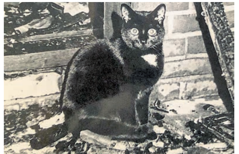
Poes Moortje zag een dag eerder haar vijf kittens door de brand verloren gaan.