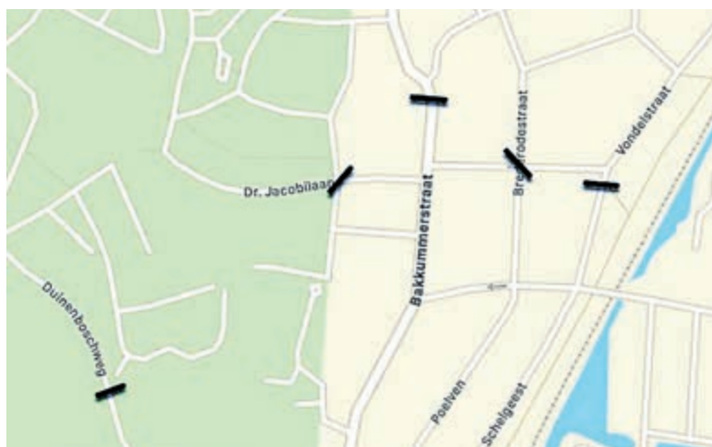
Op kruispunten kunnen auto's alleen afslaan, maar niet rechtdoor. Hulpdiensten en fietsers mogen dat wel. Doorgaand autoverkeer kan omrijden via de Zeeweg of via de Van Haerlemlaan, Oranjelaan, Kleibroek of Ruitersweg.