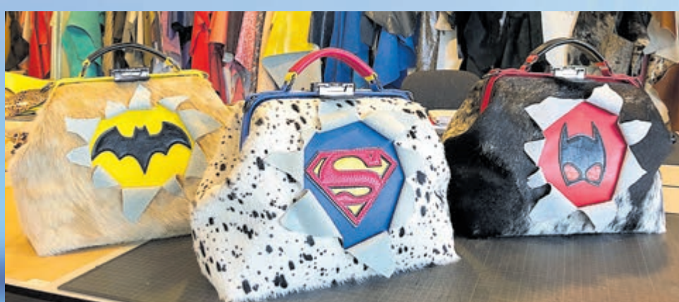
Maak zelf de leukste tassen bij POOKPOOK.