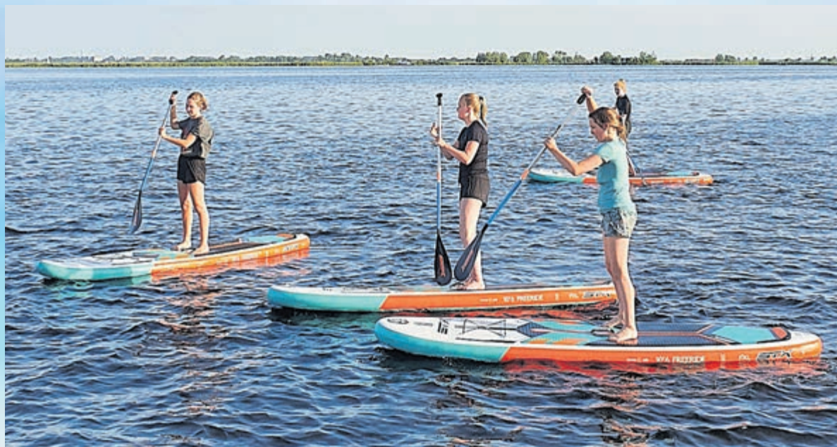
Ook suppen maakt deel uit van de watersportactiviteiten.

Dorpsstraat 39 • Castricum • www.casaibiza-shop.nl • 06-18176525