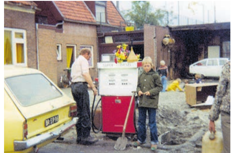
Twee weken na de brand is het tankstation weer geopend. De afgebrande resten van de woning zijn op de achtergrond zichtbaar.

gemeente een cheque van 10.000 gulden als een soort noodhulp. Het bleek een fopspeen te zijn, want twee weken later kregen we bericht dat het geld direct moest worden teruggestort. Waarschijnlijk is de burgemeester buiten zijn boekje gegaan en is hij hier door een van zijn ambtenaren op gewezen.“