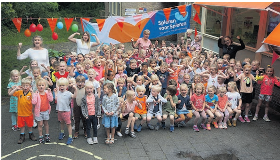
De kleuters van basisschool Cunera zijn trots op het behaalde resultaat.