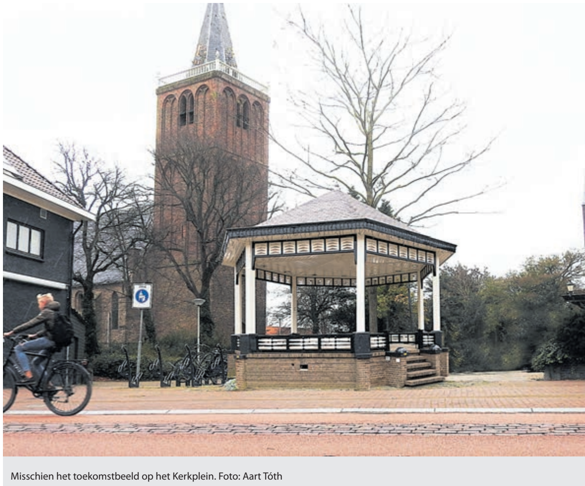
Misschien het toekomstbeeld op het Kerkplein.