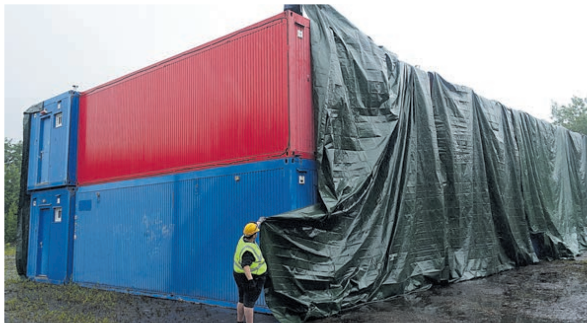
De containers worden ingepakt.