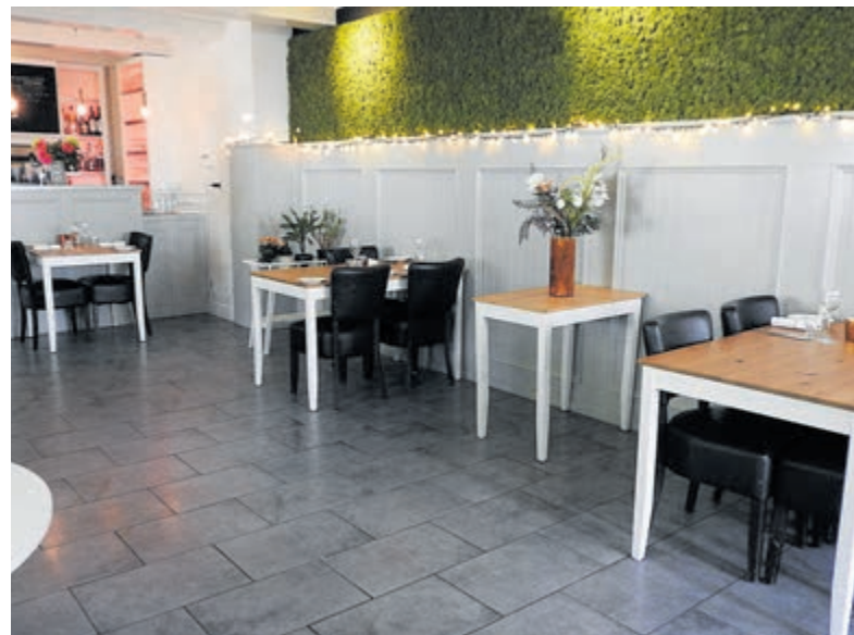
Gezelligheid troef binnen bij 't Eethuysje.

aantal bij 't Eethuysje behoorlijk gestegen. Ook omdat er, ondanks de nog steeds geldende anderhalvemeterregel, gezorgd is voor meer plaatsen in het restaurant.