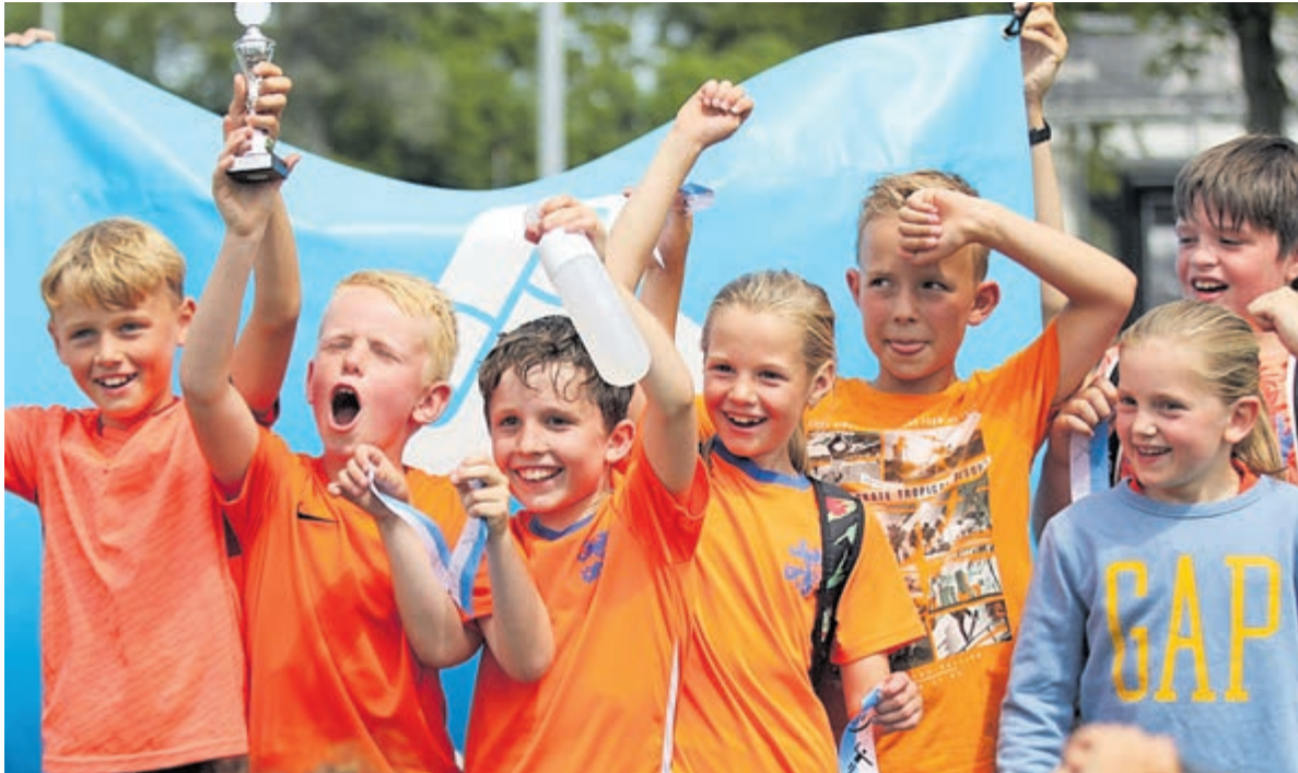
Meer dan tweehonderd kinderen namen zondag deel aan het schoolhandbaltoernooi.