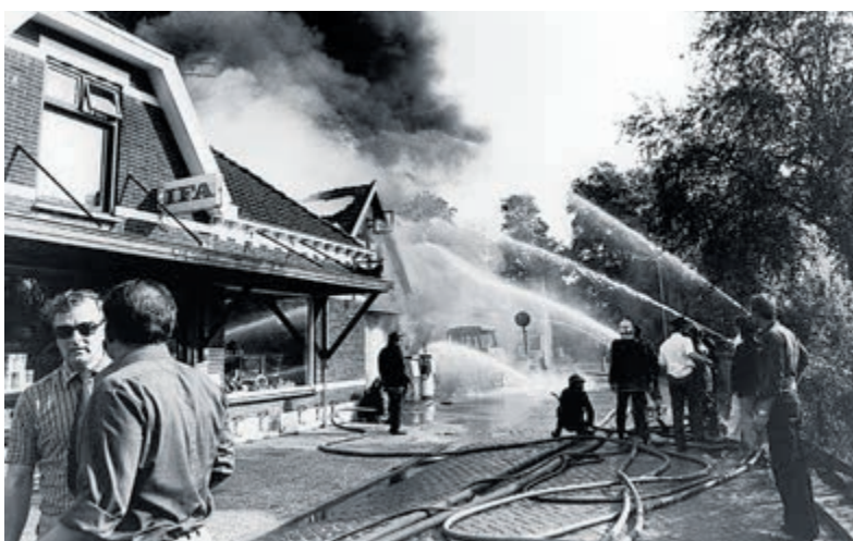
Met man en macht wordt geprobeerd de schade zoveel mogelijk te beperken.

Geraadpleegde bron: Historische Vereniging Oud-Akersloot