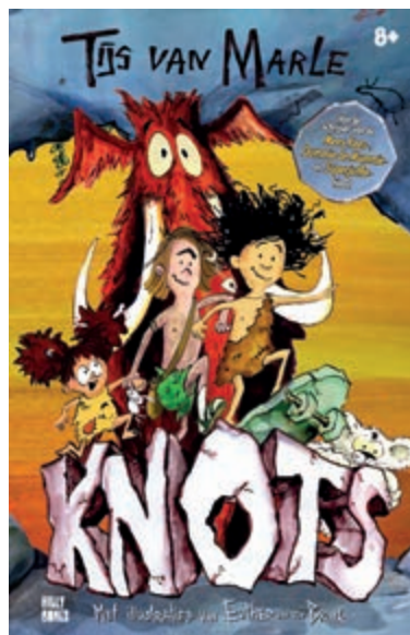
Knots wordt uitgegeven door uitgever Billy Bones (ISBN: 9789030507857).

Als Knots op een dag een kleine sneeuwleeuw vindt, komt hij per ongeluk in een knotsgek avontuur terecht. Samen met zijn nieuwe