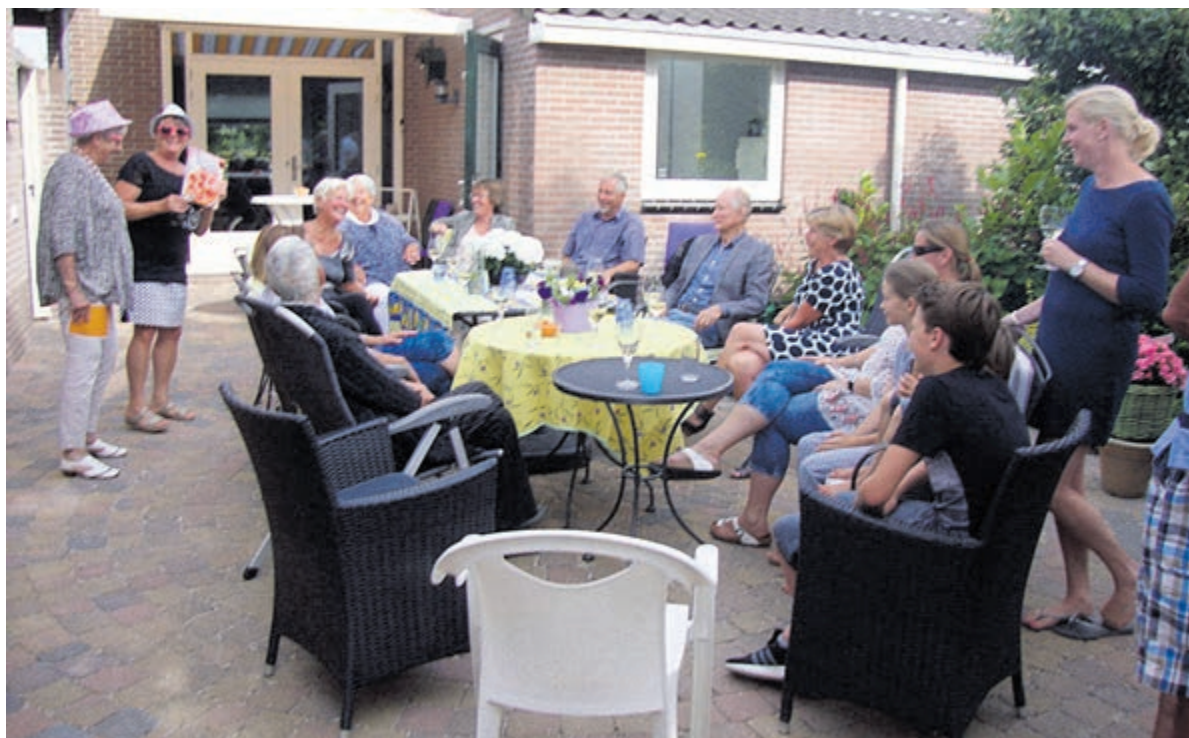
Een buurtbijeenkomst van de bewoners aan de Kooiweg in Castricum.