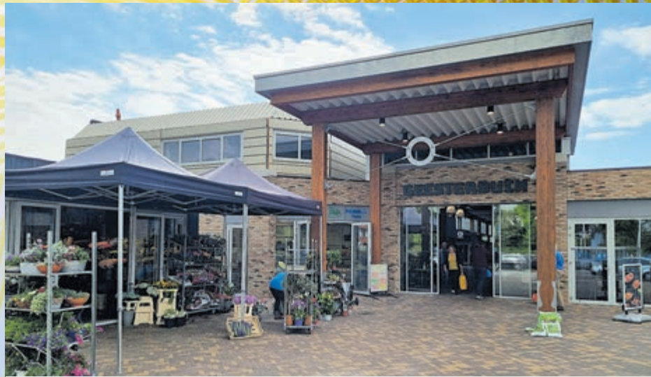
Volop keus in winkelcentrum Geesterduin.