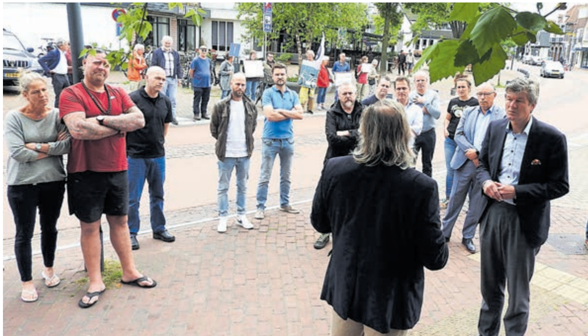
Een kleine groep ondernemers die kwam opdagen op hun vrije ochtend en overige belangstellenden en voorstellers van autoluw aan de overzijde.