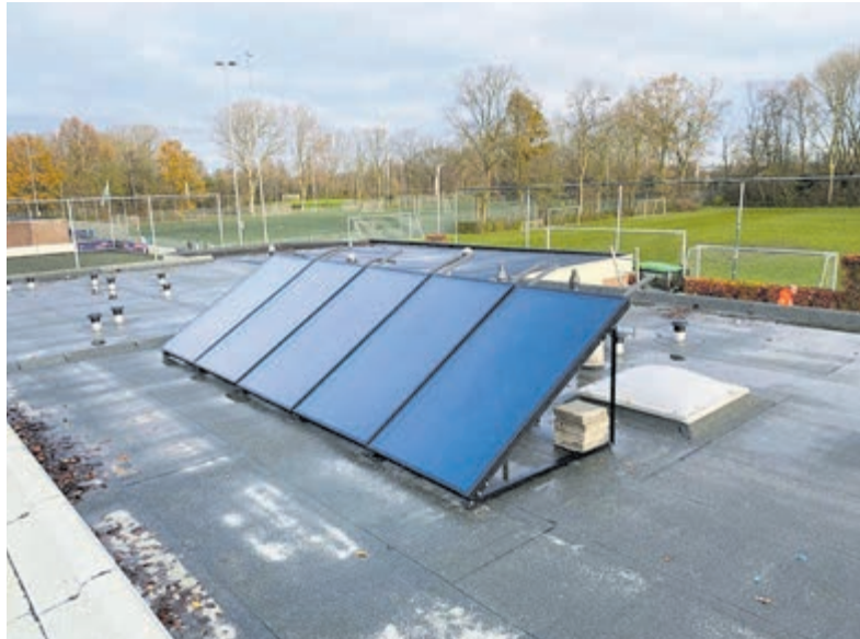
De door Lammers Toepoel geïnstalleerde collectoren ten behoeve van de zonneboiler.

kangoeroes (4 en 5 jaar) die de eerste korfbalkneepjes onder de knie proberen te krijgen. KV Helios is trots!