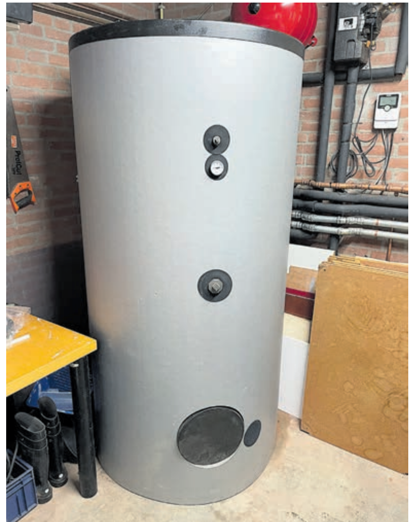
De nieuw geïnstalleerde zonneboiler met 800 liter warm water.

De volgende stappen konden gezet worden middels het selecteren van Lammers Toepoel Installatietechniek BV voor de installatiewerkzaamheden en het opstellen van een planning. In de week van 28 november 2023 is Lammers Toepoel gestart met de vervanging van bestaande boilers door een zonneboiler van 800 liter met vijf collectoren op het dak. Nog in 2023 waren deze werkzaamheden van fase 2