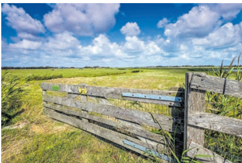
Het Oer-IJ kenmerkt zich door een grote verscheidenheid aan landschappen, zoals hier tussen Uitgeest en Castricum.

Voor de diverse medewerkers lagen na afloop exemplaren gereed. Ter plekke kon het boek besteld worden voor twintig euro, maar die korting gold enkel tijdens de presentatie vrijdag. De uitgave is vanaf heden voor 24,50 euro te koop in de boekhandel en ook verkrijgbaar bij de winkel van archeologiemuseum Huis van Hilde, Westerplein 6, pal achter het station.