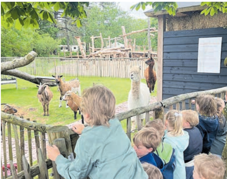
De groep kleuters tijdens het bezoek aan Camping Bakkum.

Uitgangspunt is dat uw vijver weer kraakhelder wordt, of blijft! Nuyens Tuin & Groen Shop is gevestigd aan de Uitgeesterweg 1b in Limmen.