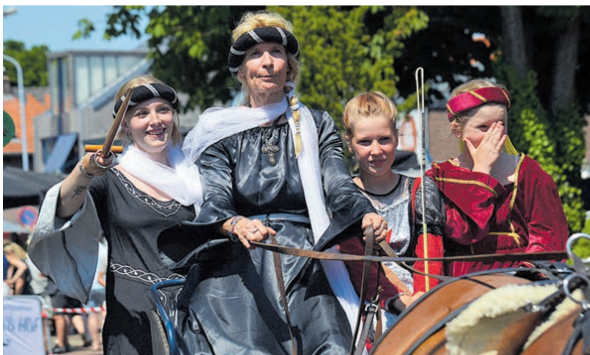
Deelnemers aan een eerdere editie van het ringsteken in Bakkum.

Ga naar: www.castricummer.nl/aanmelden-nieuwsbrief en meld je aan