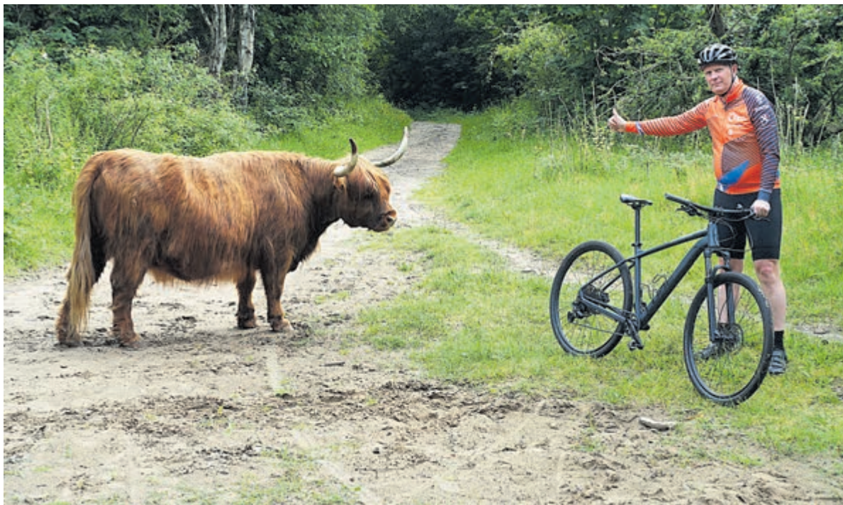
Edwin bereidt zich alvast voor met een Schotse Hooglander. Foto: Hans Boot

Castricum - Het wil maar niet minderen met de wateroverlast waardoor ook ons land al maanden wordt geteisterd. Het is voor velen geen pretje om nu vakantie te vieren en met tent of caravan in het water te staan. Ook de Castricumse campings hebben daar constant mee te maken, zoals bijgaande foto van een van de kampeerplaatsen laat zien. Camping Bakkum was vorige week druk bezig om het water weg te pompen naar hoger gelegen gebieden. Daarbij gaat het om zo'n 250.000 liter water per dag. Nadat het in het afgelopen weekend wat droger werd, nam de overlast volgens manager Peter Ramp ook iets af: „Het lijkt erop dat er komende week weinig neerslag valt en dan zal de situatie verder verbeteren. We dachten echter ook voor Pinksteren dat het voorbij was, maar daarna is de regen opnieuw in alle hevigheid teruggekeerd. Wie kan deze stoppen?“ Tekst en foto: Hans Boot