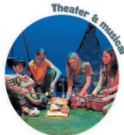
Theater & musical