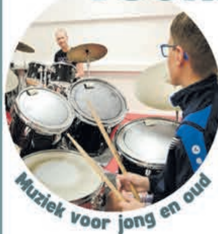
Muziek voor jong en oud