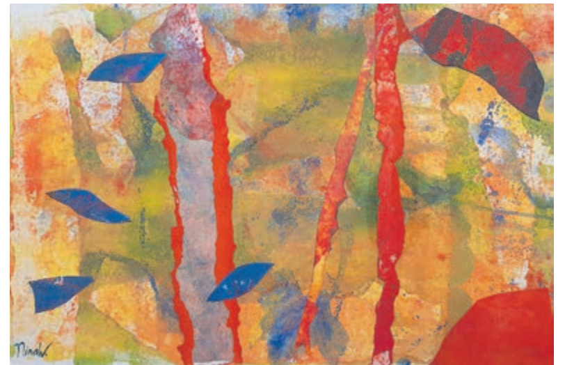
Het schilderij 'Manifold blessings'.

Kijk op www.deoudekeuken.net voor uitgebreide informatie.