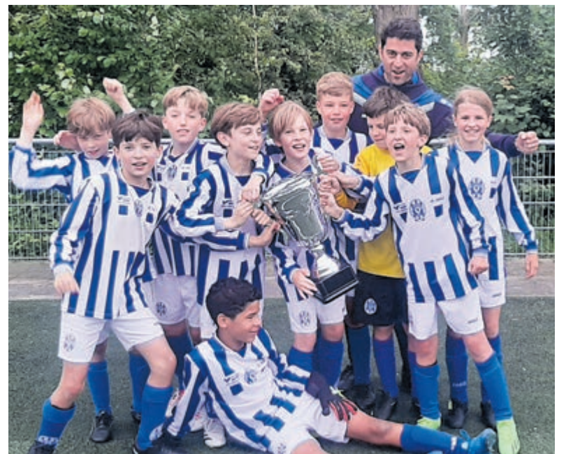
Team JO11-3 werd donderdagavond kampioen.