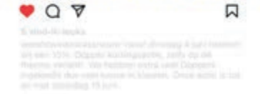
Het account van Wereldwinkel Castricum op Instagram.